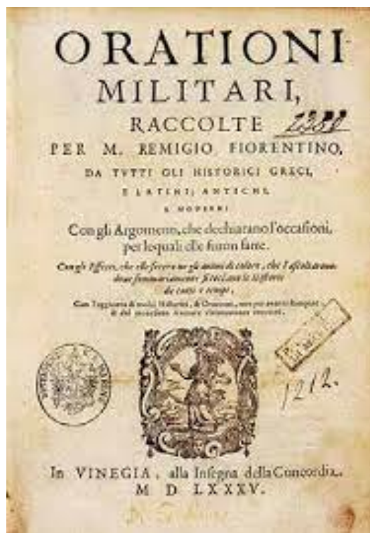
Slika 2. Najstarija knjiga Orationi militari (Venecija, 1585.)