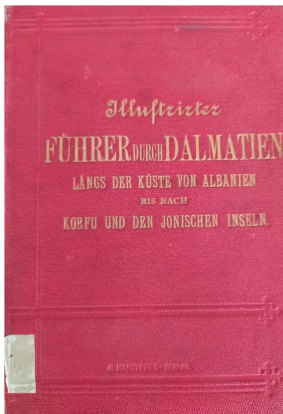
Slika 4. Vodič po Dalmaciji iz 1883. godine 65

Značaj knjižnice i fonda bio je u tome što je knjižnica tijekom dugogodišnjeg djelovanja bila uključena u najvažnije prosvjetne i znanstvene ustanove Austro-Ugarske Mornarice. Mornarica je slijedila znanstveni i tehnički napredak u svijetu pomorstva, brodogradnje, strojarstva, hidrografije, vojne tehnike i srodnih znanosti i struka, a dijelom je pridonosila tom razvoju što posvjedočuje fond i katalog knjižnice. 66 Vrijednost fonda ove knjižnice nije bila samo u brojnim vrijednim primjercima, već prvenstveno u njezinoj sveobuhvatnosti koja je proizašla iz njezine namjene za potrebe Mornarice i iz nabavljanja znanstveno relevantnih publikacija s toga područja na svim svjetskim jezicima. Sačuvani fond predstavlja svjetsku znanstvenu i kulturnu baštinu koja svjedoči o znanstvenim i tehničkim postignućima budući da je između ostalog,