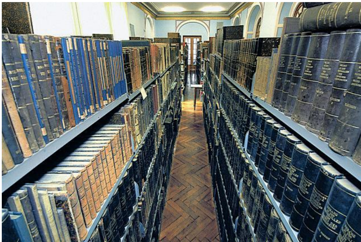
Slika 5. Zbirka Mornaričke knjižnice (danas)

Mornarica organizirala i svjetska putovanja nastojeći upoznati pomorske zemlje svijeta i njihove narode, jezike, običaje, kulturu i povijest.