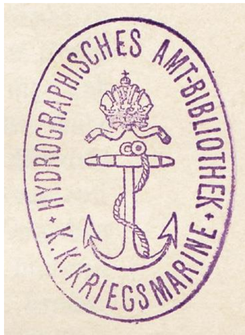
Slika 1. Pečat Hydrographisches Amt-Bibliothek, K. u. k. Kriegsmarine, Sveučilišna knjižnica u Puli, Zbirka Mornaričke knjižnice

Najstarije knjige iz fonda imaju pečate Zapovjedništva Mornarice (s dvoglavim orlom u ovalu) i mornaričkog koledža. Nakon toga korišteni su okrugli pečati s dvoglavim orlom i tekstom uz vanjski rub ovala: Bibliothek K. K. Marine. U skladu s uvođenjem naziva K.u.K. (carska i kraljevska) 1889. godine knjižnica mijenja naziv u K.u.K. Marine Bibliothek (Knjižnica Carske i kraljevske Mornarice). Stoga su, nakon što je knjižnica ušla u sastav Mornaričko-tehničkog odbora, korišteni pečati ovalnog oblika s grbom Monarhije i tekstom u ovalu (Slika 1.). 51