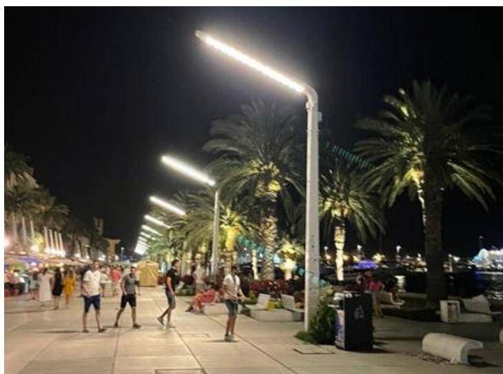
Sl. 18 Riva (zapadni vrh šetnice), 26. 7. 2019.