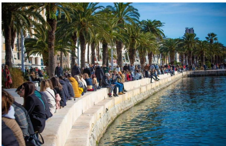
Sl. 5. Split riva 30. siječanj 2021. godine

na taj prostor kao objekt rekonstrukcije i na identitet i vezanost građana koji su tom prostoru davali prvobitno značenje. Drugim riječima, vizualno gubljenje „starog“ izgleda rive je donekle značilo i osjećaja gubljenja povezanosti s osjećajima vezanosti za taj prostor koji su se gradili tijekom stoljeća. Ipak, s vremenom se i „nova“ splitska riva uklopila u kulturnu memoriju i identitet grada zajedno s iskustvom i sjećanjima vezanosti sa starom rivom, te se i danas građani okupljaju na prostoru rive, bilo u kavanama, zbog šetnje ili bivanja u parkovnom dijelu uz more.