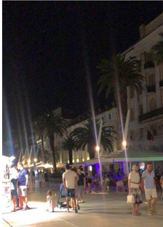
Sl. 13. Riva (12), 18. 7. 2019.