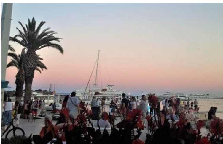
Sl. 20. Riva (zeleni dio uz more), 6. 8. 2019.