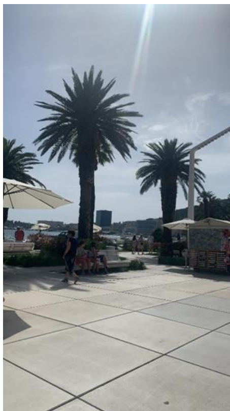
Sl. 15. Riva (6-8), 19. 7. 2019.