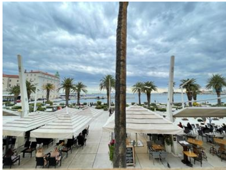
Sl. 14. Riva (20), 19. 7. 2019.