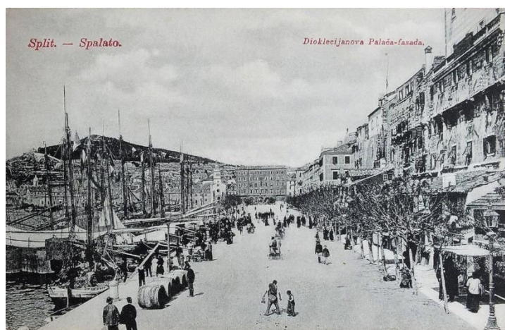
Sl. 1. Riva na početku 20. stoljeća, preuzeto s:

Kečkemet (1999) navodi da oblik rive kakvu danas poznajemo dolazi s početka 19. stoljeća dok je hrvatska bila pod francuskom vlašću, te je idejna zamisao rekonstrukcije ondašnje rive došla od strane maršala Marmonta. Prema Borčić i Mrkonjić (2014), Marmont je zaslužan najviše za nasipanje i izgradnju zapadnog dijela Rive. Na fotografijama koje su uslikane tijekom 19. i početkom 20. stoljeća se vide stare kućice (potleušice) uz južno pročelje palače koje su izgradili splitski pomorci i trgovci koje su služile kao obiteljske kuće, ali kao i trgovine npr. mrežama za ribolov. Početkom 20. stoljeća, odnosno u periodu između 1900. i 1930. godine se počinje raditi na sanaciji kućica uz zidine palače. Radilo se na obnovi pročelja palače na kojoj su kućice bile naslonjene, te su stare i trošne građevine srušene i izgrađene nove prema ideji arhitekta Kellera kako bi se uklopile bolje u ambijentalni izgled tog prostora (Borčić i Mrkonjić, 2014). Osim toga, u periodu 20ih godina 20. stoljeća splitska riva dobiva električno osvjetljenje koje je zamijenilo dotadašnje petrolejske ferale postavljene sredinom 19. stoljeća.