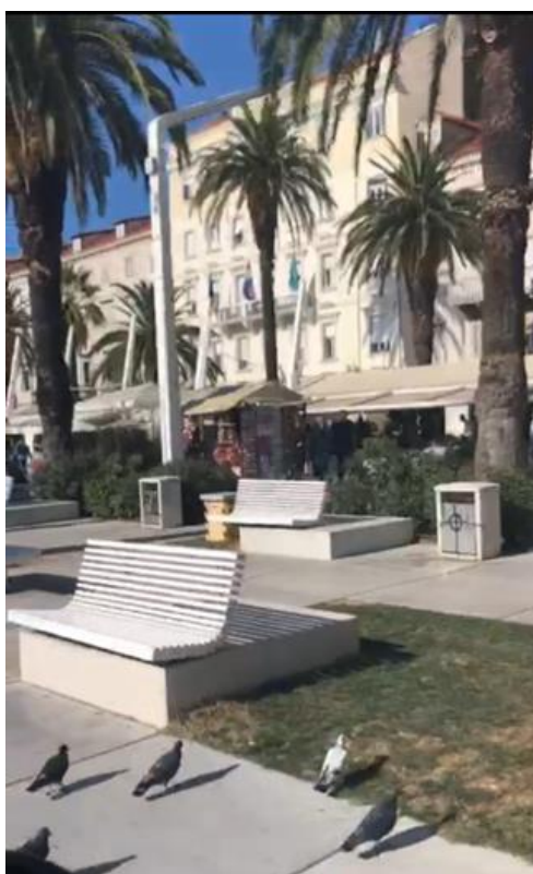
Sl. 12. Riva (zeleni dio uz more), 15. 7. 2019.