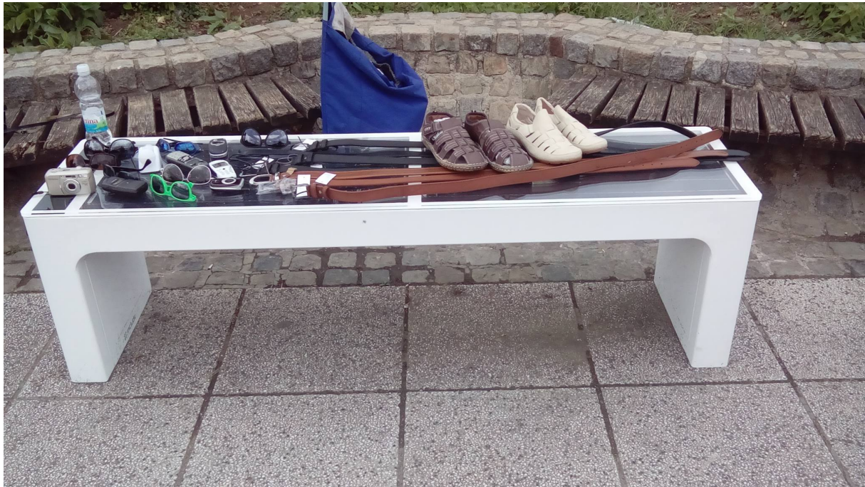
Slika 9. Pametna klupa na Trešnjevačkom trgu.

Trešnjevka je unatoč svim navedenim problemima poželjno mjesto za život i broj stanovnika je u stalnom statističkom porastu. Razlozi tomu su, iz percepcije stanovnika, dobra prometna povezanost sa gradskim središtem i ostalim dijelovima grada te solidna opremljenost potrebnim sadržajima. 149