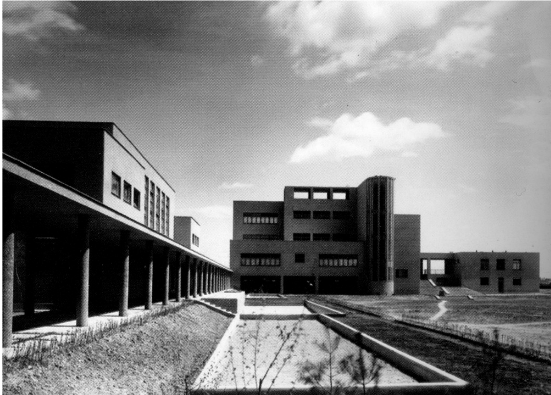
Slika 1. izgradnja škole na Selskoj cesti

stubišta, a svaku etažu zauzimaju po dvije učionice i terase. Stupnjevanjem volumena i krovnim terasama najavljen je internacionalni stil koji je uslijedio. Zemljak se osobno pobrinuo za dizajn namještaja u skladu s učeničkim potrebama i uređenje hortikulture u dvorištu sa sportskim terenima i bazenom, pa se može ustvrditi da je riječ o svojevrsnom Gesamkunstwerku .