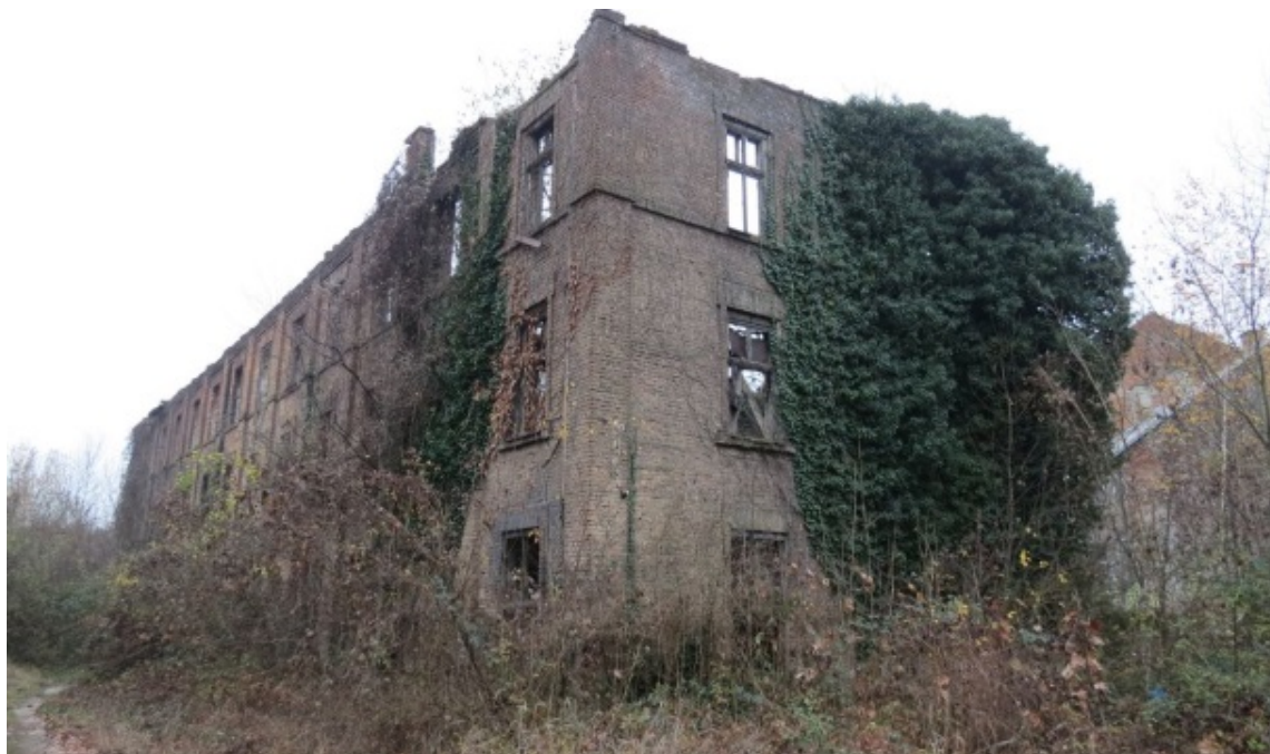
Slika 8. Bubara u današnjem izdanju

prirode. 146 Zbog toga što procesi urbane obnove nisu provedeni, na Trešnjevci postoje zapušteni i pauperizirani prostori, 147 poput bivše Bubare . Neki stručnjaci pretpostavljaju da će ovakve osiromašene lokacije postati potencijalna mjesta gentifikacijskih procesa. 148