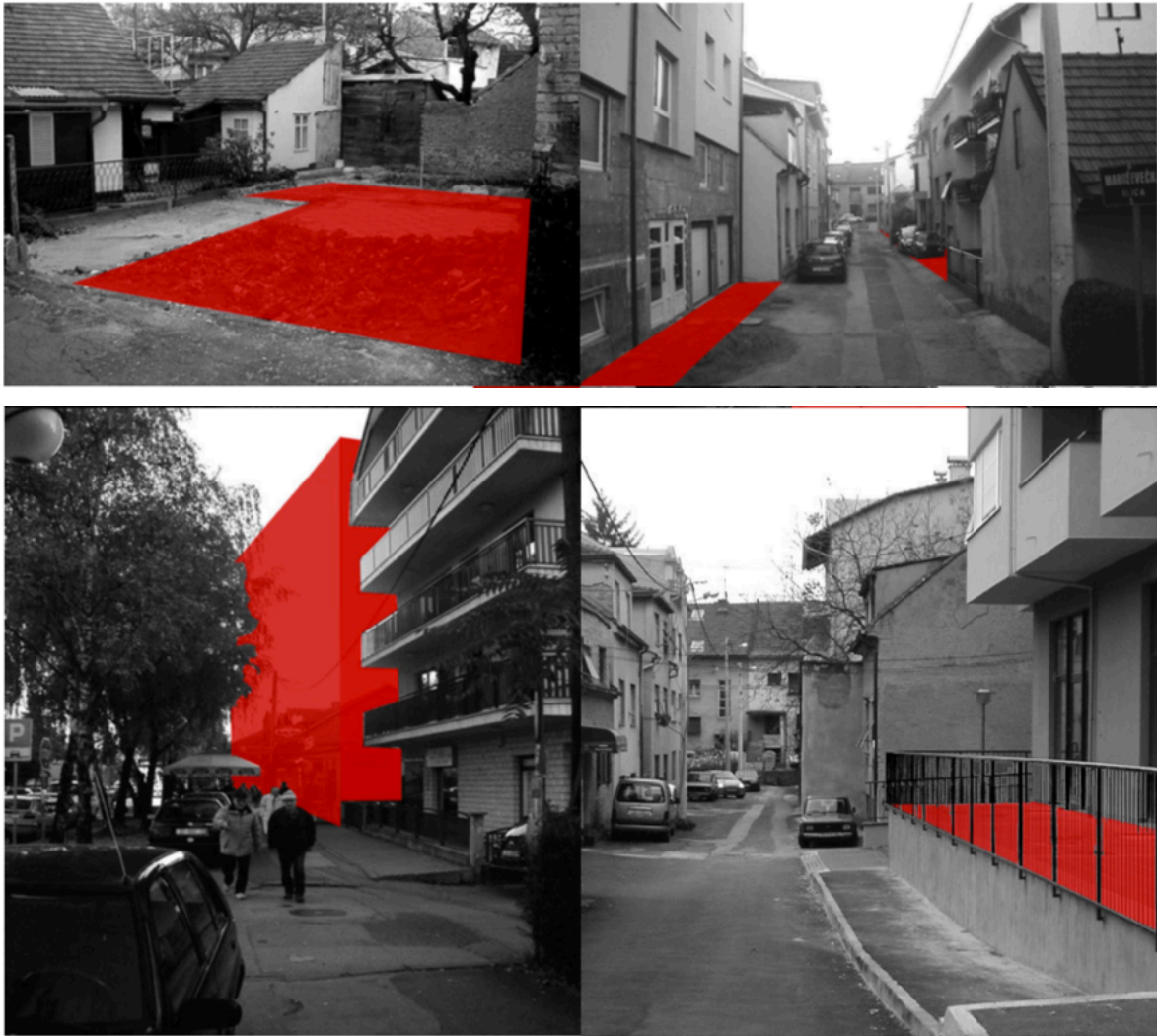
Slike 5., 6. i 7.. Trodimenzionalno zagađenje Trešnjevke

Povećanje gustoće gradnje nažalost nije pratio porast kvadrata zelenih površina, a one postojeće su često zapuštene i bez potrebnih sadržaja, primjerice dovoljnog broja klupa za sjedenje.