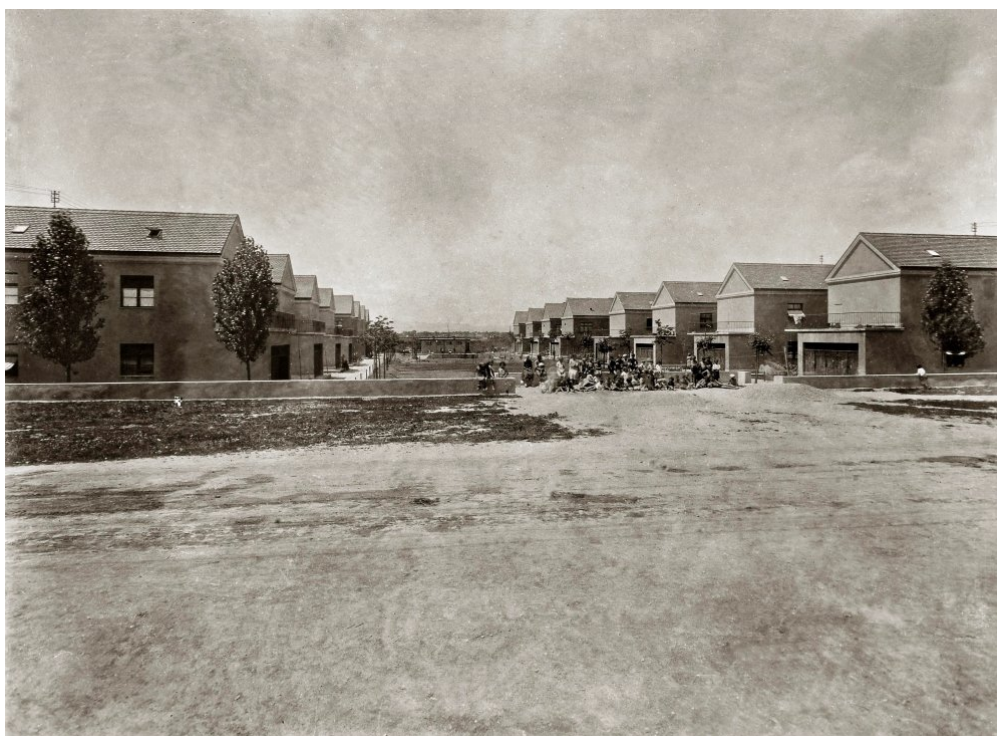
Slika 2. Naselje Istrana i invalida 1930.

Naselje Istrana i invalida izgrađeno je 1930. godine s namjerom da trideset posto stanova pripadne ratnim invalidima, a ostatak izbjeglicama koji su napustili Istru nakon anektiranja Istre Italiji 1918. godine. U samo 80 dana izgrađeno je 92 stana po projektu arhitekta Ivana Zemljaka. Zapadno od Selske ceste parcelu je zauzelo šesnaest jednokatnih stambenih nizova s po četiri ili šest stanova, kao i pripadajući kolektivni sadržaji kao što su park, igralište za djecu s malim bazenom i zajednička praonica. 62 Darja Radović Mahečić u svojoj knjizi Socijalno stanovanje međuratnog Zagreba ističe da je naselje Istrana i invalida prva kolonija radničkih kuća “novoga tipa”. 63 Unatoč tome da danas sve građevine nisu jednako dobro očuvane, naselje je uspješno zadržalo svoj cjelovit izgled.