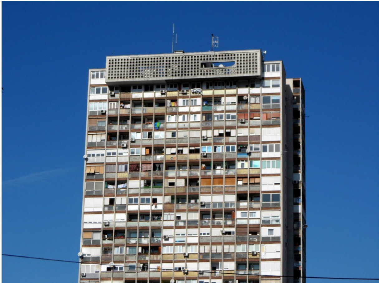
Slika 3. Trešnjevačka ljepotica

Krajem listopada 1964. godine rijeka Sava nabujala je i prelila se je preko nasipa te uzrokovala strašnu poplavu na području tadašnjih općina Susedgrad, Trešnjevka, Trnje, Peščenica i Remetinec. Poplava je napravila veliku materijalnu štetu i skrivila smrt 17 ljudi. Jedini dijelovi Trešnjevke koji nisu bili poplavljeni su oni sjeverno od Ozaljske i zapadno od Trakošćanske ulice, te Pongračevo, Ciglenica i današnje Voltino. Vodena bujica poplavila je oko 15 000 stambenih i preko 3 000 gospodarskih zgrada te je evakuirala oko 40 000 građana. O razmjeru posljedica govore statistike da je oko 10 000 stambenih jedinica oštećeno do neupotrebljivosti, oko 13 000 učenika i studenata je izgubilo školske i studentske prostore, 350 kilometara ceste je poplavljeno, a uništeno je 65% građevinskog materijala i opreme grada Zagreba kao i 81 transformatorska stanica. Procjena ukupne štete iznosila je preko 100 milijardi tadašnjih dinara. 112 Nakon poplave oformljena je inspekcija koja je obavljala pregled kuća i stanova i odlučivala o eventualnom rušenju i obnavljanju objekata. Sljedeći korak bio je gradnja novih stanova za obitelji koje bile su pogođene poplavom i ostale bez stambenih prostora, a izgrađeni su u Dubravi, Volovčici, Botincu i Gajnicama. Zgrade koje su u Prečkom građene za smještaj