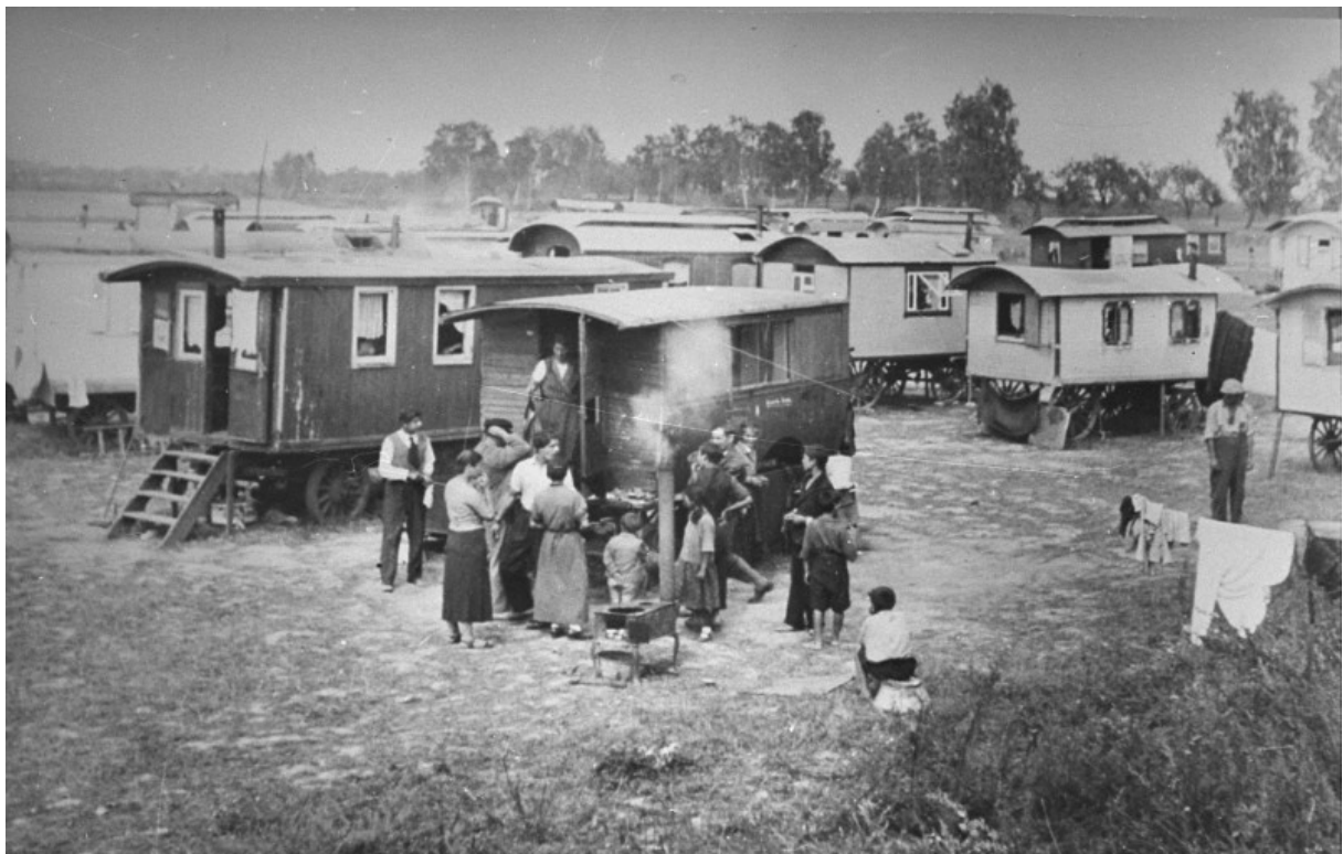
Marzahn, prvi internacijski logor za Rome i Sinte u Trećem Reichu. Njemačka, datum nepoznat

i Sinti internirani na bivše igralište okruženo bodljikavom žicom, nije se smjelo izlaziti nikamo osim na posao, a slično je bilo i u frankfurtskom logoru Dieselstrasse u koji je internirano mnogo Roma i Sinta iz susjednih gradova Darmstadta, Mainza i Wormsa pa je broj porastao i na 200 do 300 ljudi (Ibid: 42, 43). Svaki je logor imao obično po dva policijska službenika koji su nadzirali zatvorenike, i to tako da su ujutro i navečer provodili prozivke za vrijeme kojih se svaki član obitelji morao pojaviti, reći svoje ime i broj članova obitelji te salutirati Heil Hitler , a neposluh se naplaćivao premlaćivanjem, katkad i bičevanjem (Ibid.).