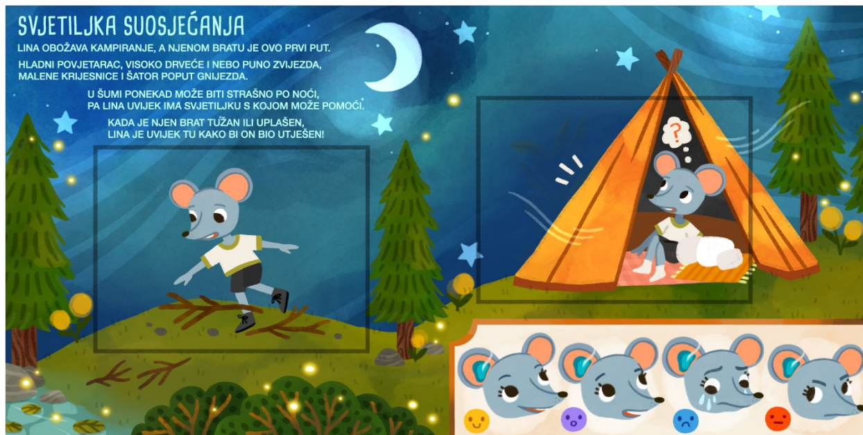
Slika 17. Svjetiljka suosjećanja – prvi prikaz