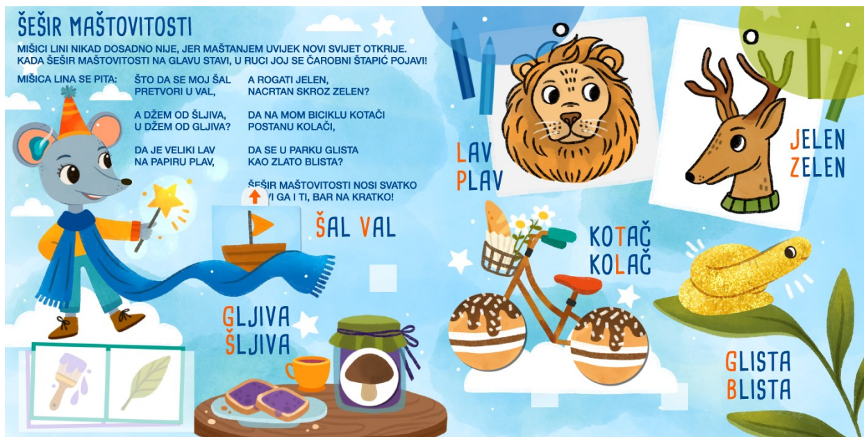
Slika 11. Šešir maštovitosti – prikaz nakon pomicanja interaktivnih sastavnica