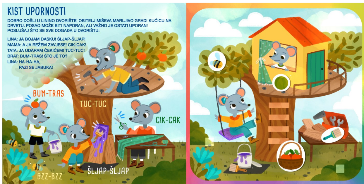
Slika 5. Kist upornosti - prikaz prije pomicanja interaktivnih sastavnica