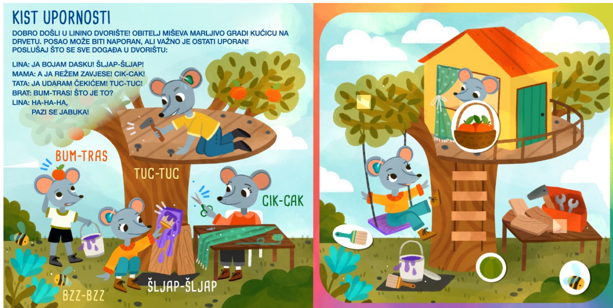
Slika 6. Kist upornosti - prikaz nakon pomicanja interaktivnih sastavnica

Roditelj potiče dijete na traženje i zamišljanje mogućih zvukova na ilustraciji. Osim traženja zvukova, roditelj ohrabruje dijete na imitiranje istih uz popratno korištenje mimike i geste.