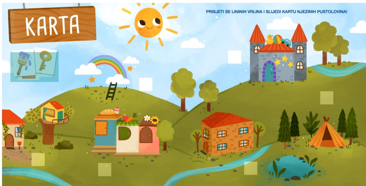
Slika 20. Karta – prikaz prije spajanja kartica s pripadajućom lokacijom

Svaka vrlina uključuje veći broj zadataka, pa se tako rad na samo jednom dvostraničju može produžiti ovisno o djetetovoj želji za ponavljanjem – primjerice, igra s medvjedićima (skromnost), igra sa šeširom (maštovitost) te zadaci slušnog pamćenja (radoznalost) mogu se provoditi nekoliko puta zaredom. Dakle, rad na jednom dvostraničju može trajati kao puni rehabilitacijski sat ako dijete aktivno sudjeluje i duže zadržava pažnju na interaktivnim sastavnicama. Iz tog razloga, moguće je koristiti zaključne stranice kao brzi pregled sadržaja slikovnice. Otvaranjem karte, dijete bira koju lokaciju u priči želi posjetiti, pa tako i rehabilitacije aktivnosti.