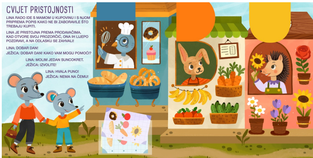
Slika 8. Cvijet pristojnosti - zatvoreni prozorčići trgovina