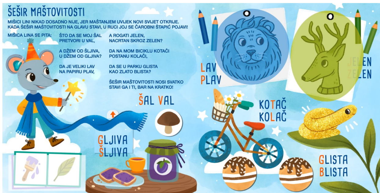
Slika 10. Šešir maštovitosti – prikaz prije pomicanja interaktivnih sastavnica

Pojmovi koji se spominju, napisani su uz pripadajuće ilustracije što će koristiti djeci koja čitaju ili tek započinju raditi na toj vještini. Crvenom bojom označava se glas koji je drugačiji u svakoj riječi.