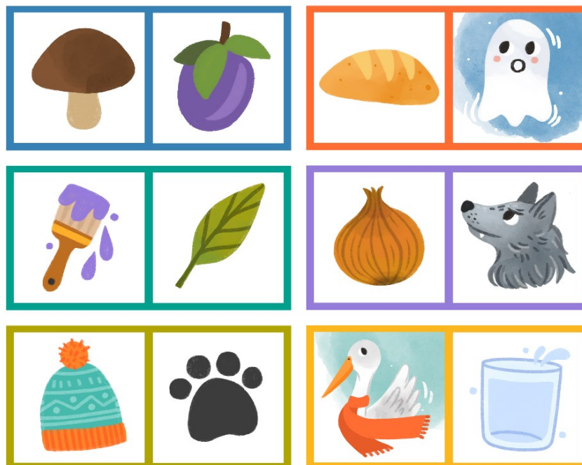
Slika 12. Kartice s parovima rime: gljiva/šljiva, kruh/duh, kist/list, luk/vuk, kapa/šapa, roda/voda