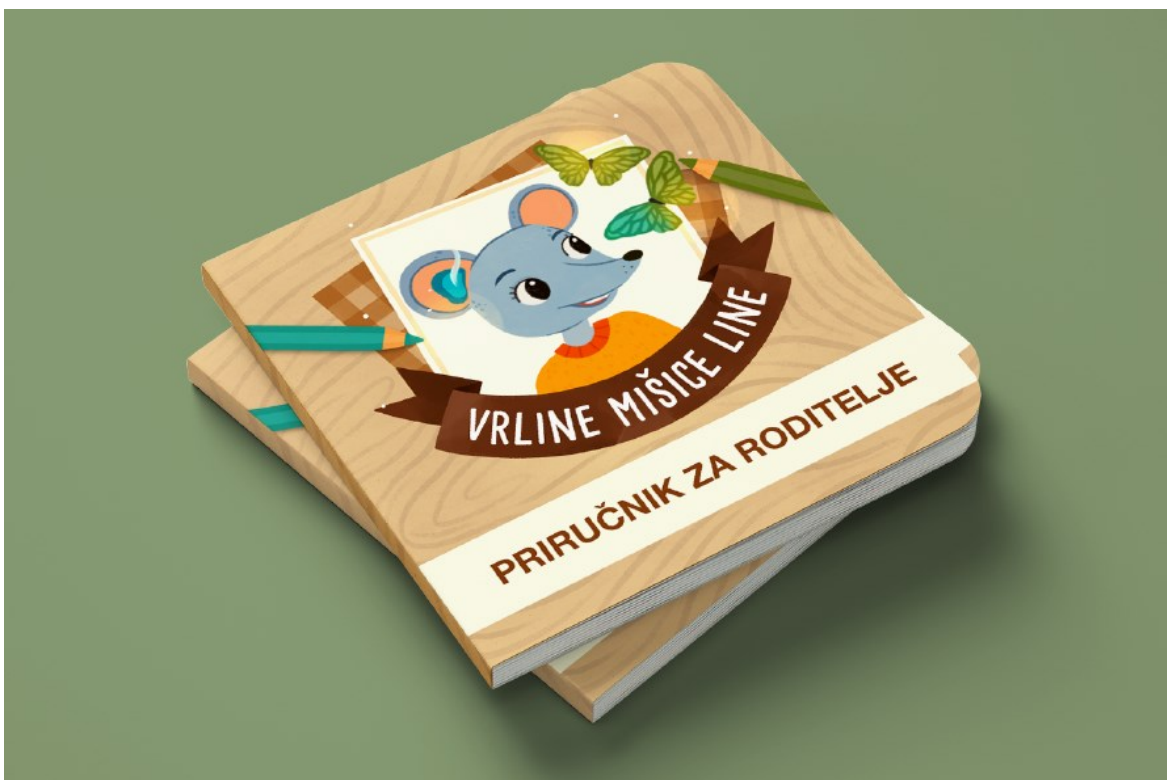
Slika 22. Priručnik za roditelje – naslovnica