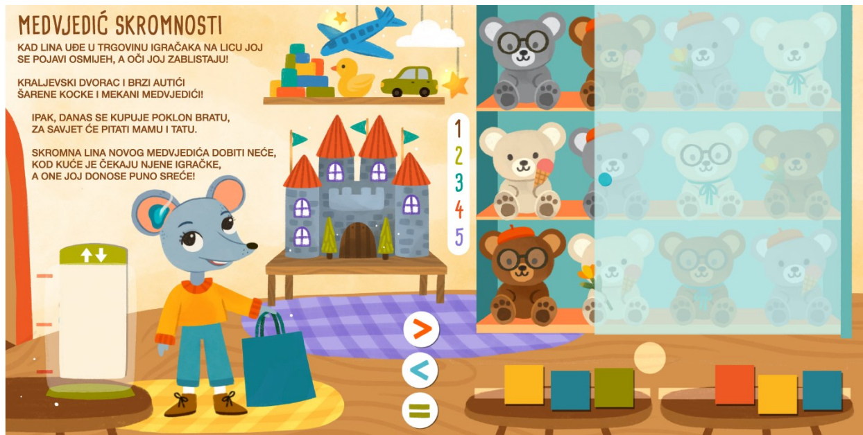
Slika 13. Medvjedić skromnosti –prije pomicanja interaktivnih sastavnica

Vrlina skromnosti prikazana je situacijom u kojoj djeca imaju težak zadatak biti skromna, u trgovini igračkaka. Pjesmica opisuje kako Lina promatra razne igračke u prostoru, ali u kupnju je došla s roditeljima kako bi kupili poklon mlađem bratu, pa neće dobiti igračku. Lina je skromna – zna da ju njene igračke čekaju kod kuće, prikazane u košari na uvodnim stranicama. Ovo dvostraniče primarno sadrži interaktivne sastavnice i zadatke vezane uz pojam broja.