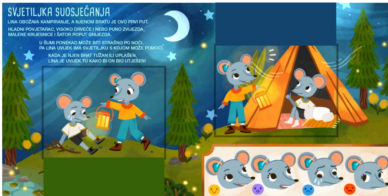
Slika 18. Svjetiljka suosjećanja – drugi prikaz