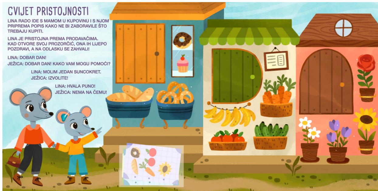
Slika 7. Cvijet pristojnosti - zatvoreni prozorčići trgovina

Ilustracija prikazuje livadu na kojoj se nalaze tri trgovine – pekara, štand voća i povrća te cvjećarnica. Prozorčići trgovina se otvaraju i tako otkrivaju likove prodavača. Priča opisuje Linin odlazak u nabavku s mamom, a spominje se i popis za kupovinu (u džepiću na lijevoj stranici nalaze se papirići različitih popisa). Uključen je i kratak dijalog između Line i Ježice, cvjećarke, koji uključuje važne riječi koje vežemo za pristojnost.