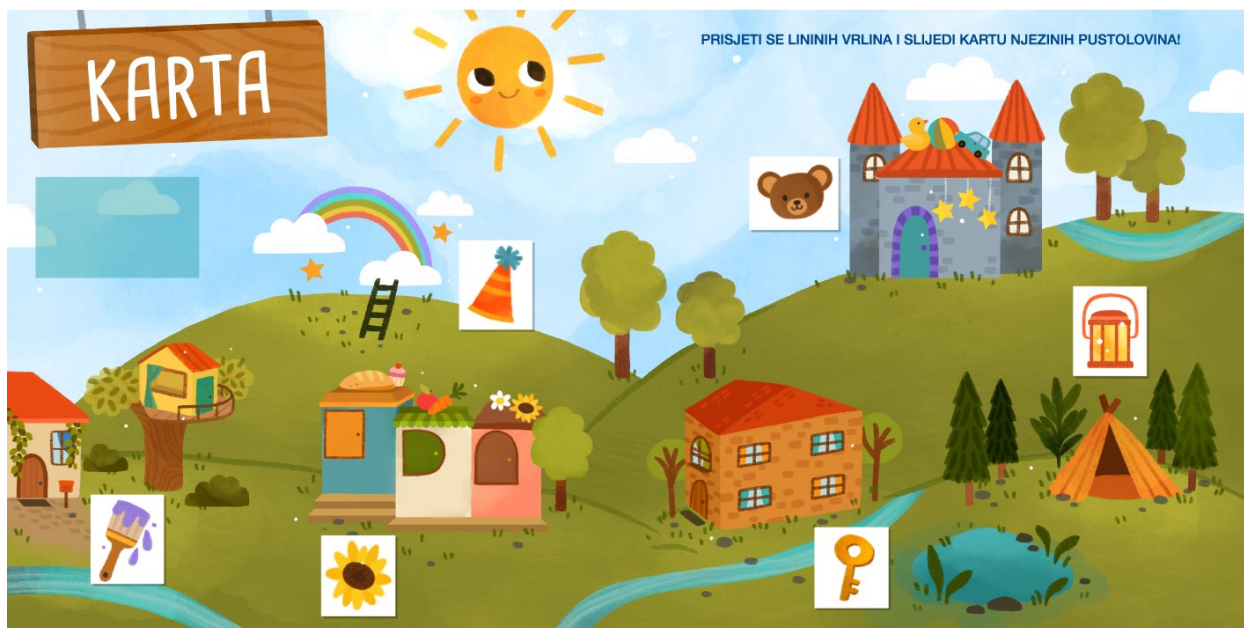
Slika 21. Karta – prikaz nakon spajanja kartica s pripadajućom lokacijom

Uz svaku lokaciju dodana je ilustracija određenog predmeta pripadajuće vrline. Kartice se nalaze u džepiću, gore lijevo. Roditelj potiče dijete na prepričavanje događaja kroz kratke crte. Od djeteta se ne očekuje imenovanje samih vrlina i pridruženih pojmova (npr. upornost – kist). U cilju je prisjetiti se konteksta i sadržaja, tako da se do pojmova može dolaziti opisno. Jasno je i kako će se djetetove vještine opisivanja poboljšavati kroz svako novo čitanje slikovnice, uključujući procese učenja i pamćenja. Dakle, završne stranice prikazuju kartu u cilju zaokruživanja procesa interaktivnog čitanja i rehabilitacijskog rada.