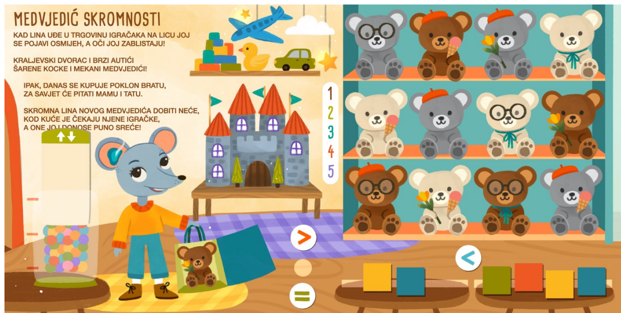
Slika 14. Medvjedić skromnosti – nakon pomicanja interaktivnih sastavnica