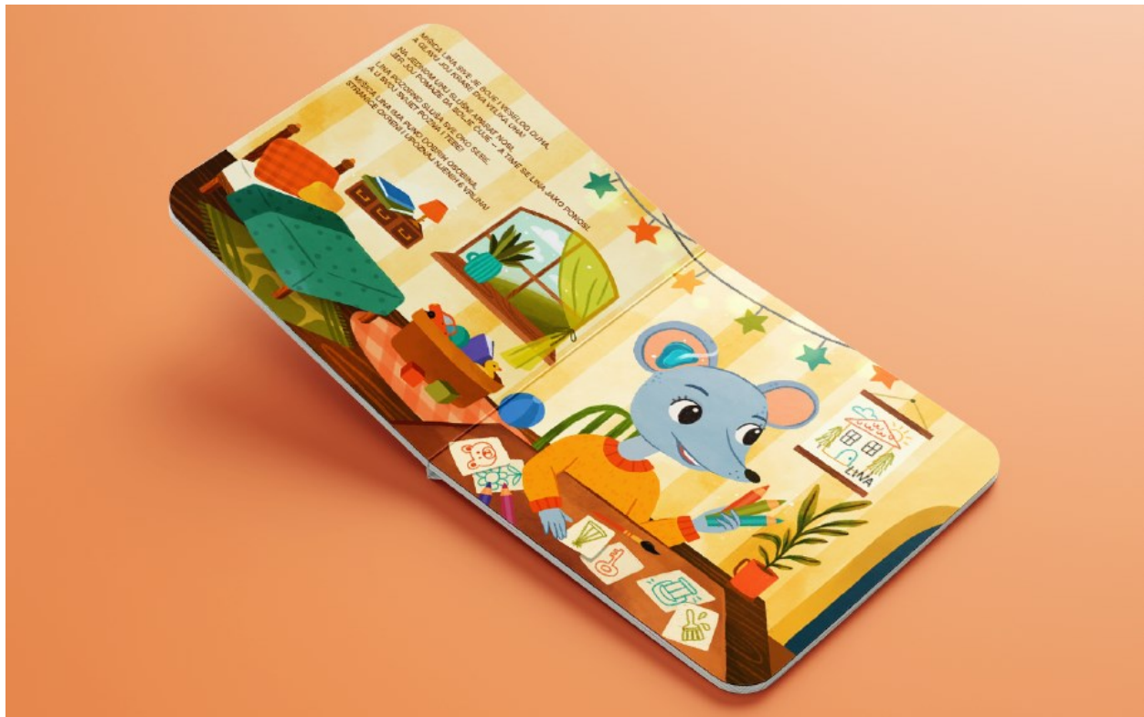
Slika 3. Prikaz otvorenog dvostraničja