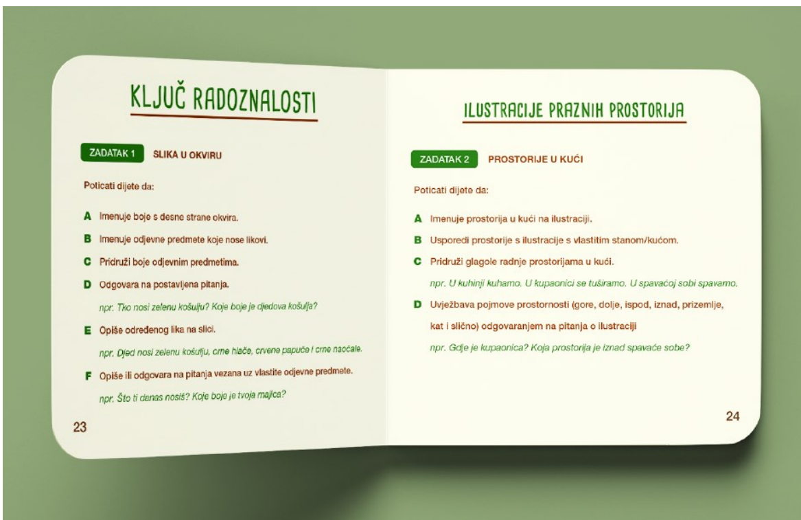
Slika 23. Priručnik za roditelje – primjer dvostraničja