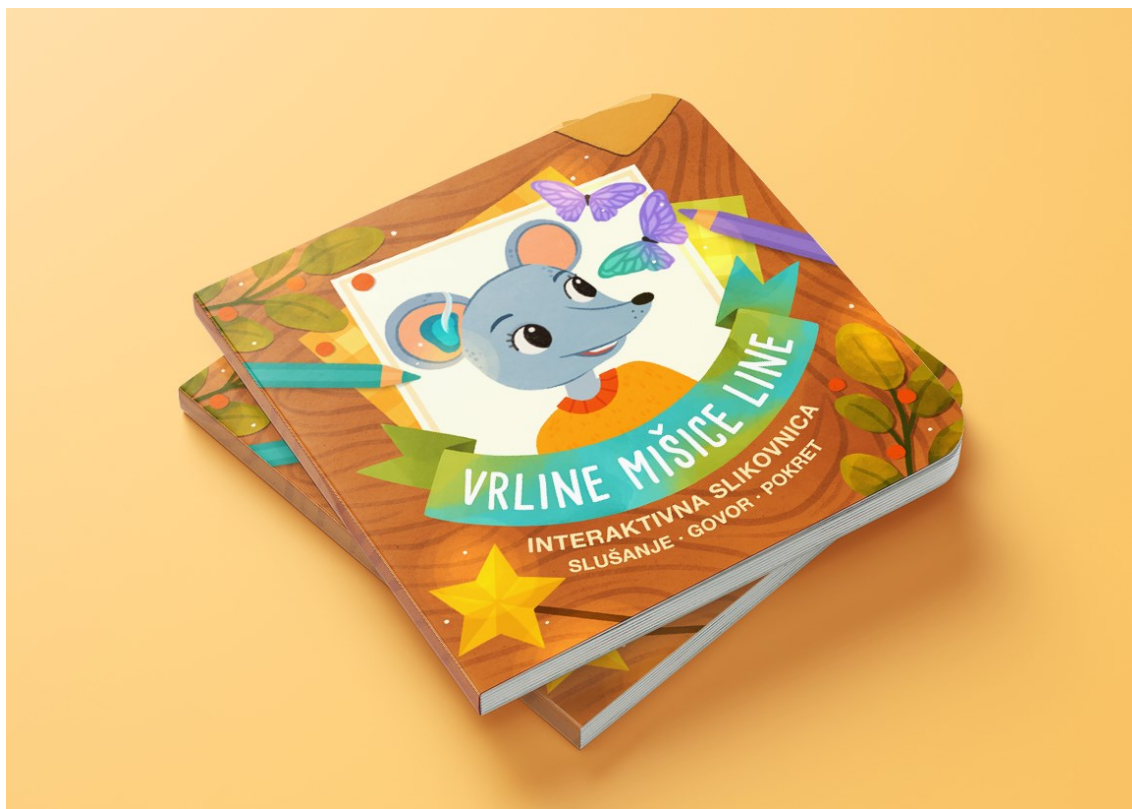
Slika 2. Naslovnica slikovnice

Dakle, radi se o dvije uvodne stranice koje predstavljaju Linu, dvanaest stranica radnog sadržaja i dvije zadnje stranice s kartom lokacija koja služi za zaključivanje procesa interaktivnog čitanja. Također, uz sve preglede dvostraničja uključeni su i popisi interaktivnih sastavnica te je objašnjeno kako se iste oblikuju u rehabilitacijske aktivnosti i zadatke. Svi tekstovi sadržani u slikovnici nalaze se u Prilogu A.