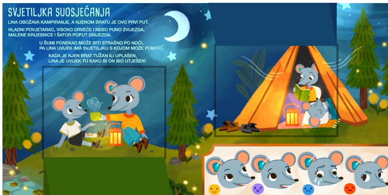
Slika 19. Svjetiljka suosjećanja – treći prikaz