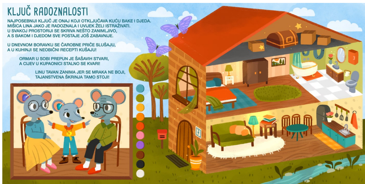
Slika 15. Ključ radoznalosti – ilustracije prostorija (prikaz prije otvaranja umetnute stranice)

U lijevom kutu nalazi se okvir sa slikom bake, djeda i Line, pored kojeg se nalaze krugovi u duginim bojama uz dodatak smeđe, crne i bijele boje. Boje i odjevni predmeti prikazani su na samoj ilustraciji, što upućuje na razne mogućnosti poticanja vještine opisivanja i njezine proširivosti. Ostali zadaci će se provoditi s obzirom na dva različita prikaza kuće,