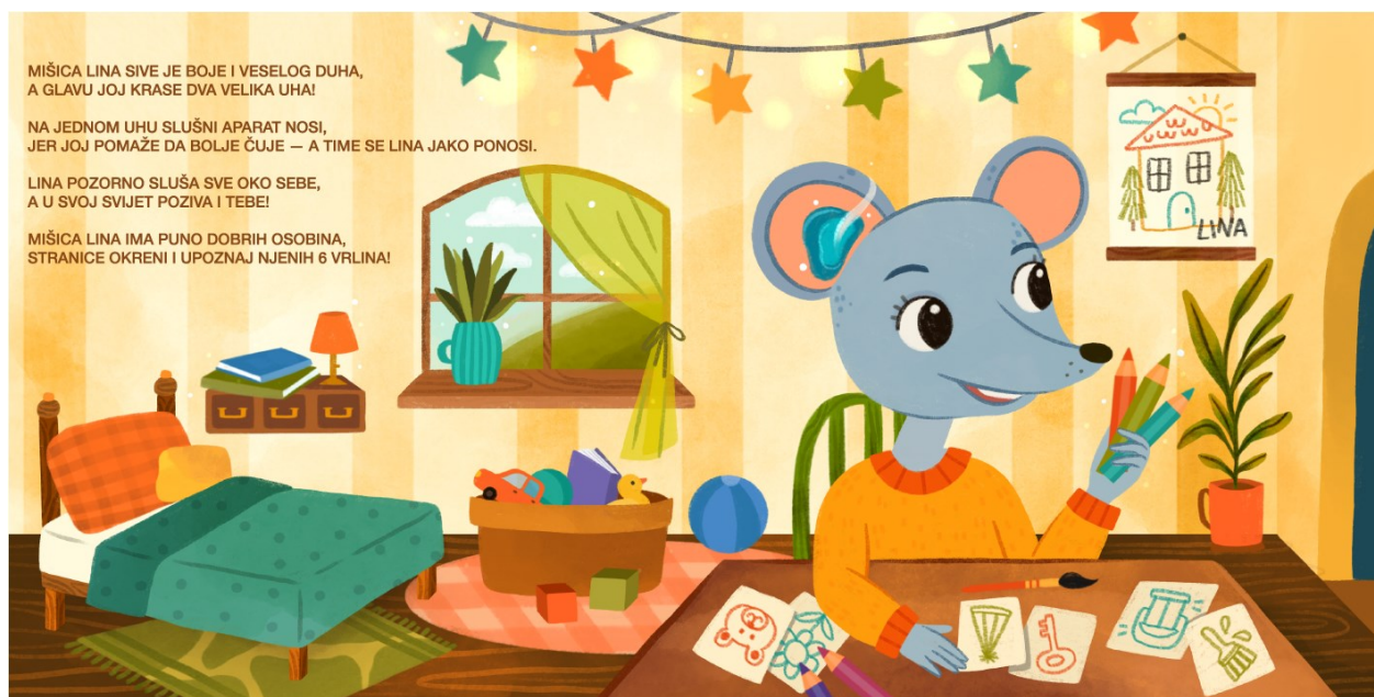
Slika 4. Uvodne stranice

Dakle, uvodne stranice nemaju usko definiran zadatak jer primarno služe za predstavljanje glavnog lika i nadolazećih stranica slikovnice. Roditelji mogu postavljati razna pitanja vezana za Linin izgled i sobu te skrenuti pažnju na pojam vrlina kao važnog dijela karaktera svake osobe, pa tako i djece. Primjerice, mogu započeti razgovor s djetetom i pitati ga kakav je njegov najbolji prijatelj/ica ili određeni član obitelji. Dijete će vjerojatno početi navoditi njihove dobre osobine i djela (npr. dobar, drag, sretan, nasmijava me, uvijek mi posudi igračku). Roditelj tako može objasniti da su vrline sve ono što nas čini dobrim osobama, prijateljima, učenicima i slično. Tu je moguće uvesti i oprečne pojmove, pa tako definirati vrline kao suprotnosti loših osobina.