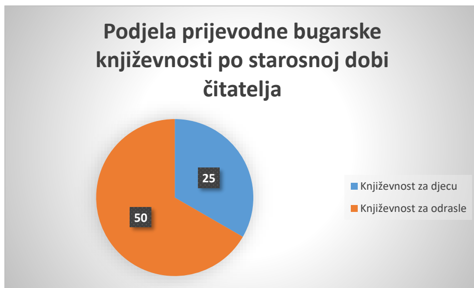
Grafikon 1. Podjela prijevodne bugarske književnosti po starosnoj dobi čitatelja

Podrobnijom analizom bibliografije može se ustvrditi da su u razdoblju od 1886. godine do 2021. godine obuhvaćeno devedeset osam bibliografskih jedinica, od čega se dvadeset tri bibliografske jedinice odnose na različite antologije poezije ili zbirke pripovijedaka u kojima je zastupljen po jedan ili više bugarskih autora. Izuzmemo li bibliografske jedinice koje se odnose na takve zbirke ili antologije i analiziramo li ovih 75 jedinica koje u cijelosti donose prijevode bugarskih autora, možemo ustvrditi da prijevodna književnost za djecu i mladež obuhvaća 25 bibliografskih jedinica; dok se 50 jedinica odnosi na književnost za odrasle.