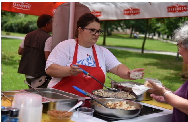
Slika 5: Podravski obed na Podravskim motivima. Objavljeno: 15.6.2019.