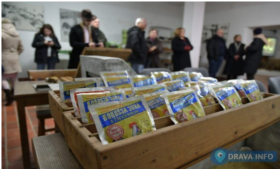
Slika 3: Izložba Muzeja prehrane. Objavljeno: 30.1.2021.

Muzej prehrane daje veliki doprinos istraživanju hrane i njene pripreme na podravskom području različitim terenskim istraživanjima i intervjuima sa domaćim stanovništvom, dok svojom zbirkom posjetiteljima pruža edukaciju o prehrani, ali i o počecima industrijalizacije tvornice Podravka. U novije vrijeme sustavno sudjeluje u istraživanjima hrane i organiziranju manifestacija te time pridonosi razvoju identiteta podravskog kraja.