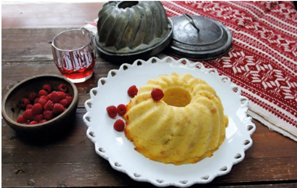
Slika 2: Za podravskim stolom – Kuglof. Objavljeno: 12.1.2015. Izvor: Podravkina web stranica recepata Coolinarika.hr. (preuzeto 15.9.2021.).