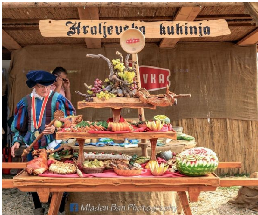
Slika 6: Kraljevska kuhinja na Renesansnom festivalu. Objavljeno: 26.7.2019.

„Renesansni festival“ povijesni je mega spektakl koji spaja kasnosrednjovjekovne povijesne činjenice i originalnost Koprivnice, Podravine i Hrvatske s baštinskim vrijednostima zapadnoeuropskog kulturnog civilizacijskog kruga koje se na Festivalu manifestiraju preko brojnih viteških, obrtničkih i glazbenih skupina iz desetak europskih zemalja. Četverodnevna manifestacija rekonstruira razdoblje kada je Koprivnica postala slobodnim kraljevskim gradom (1356.), a najviše se bavi razdobljem kraja 15. stoljeća te 16. stoljećem iz kojeg potječu ostaci renesansnih bedema na kojima se i odvija cjelokupni program. Mnogobrojni sadržaji četverodnevne manifestacije vraćaju posjetitelje u davno minulo vrijeme što dočaravaju „srednjovjekovni“ zanatlije (najveći sajam srednjovjekovnih obrta u ovom dijelu Europe), trgovci, vitezovi, dame, kralj i dvorjani, skitnice, prosjaci, kmetovi, alkemičari, muzičari, zabavljači i mnogi drugi. Kuhari na licu mjesta spremaju jela po srednjovjekovnim receptima, a piju se samo pića iz tog vremena poput medovine, vina i piva i to iz drvenih i lončarskih čaša i posuda (Renesansni festival 2021).