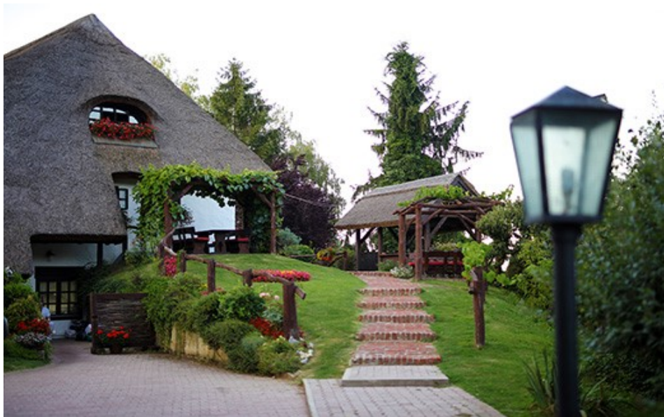
Slika 4: Restoran Podravska klet.