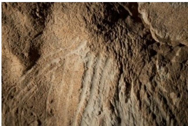
Slika 1. Žljebovi iz zone II pećine Las Chimeneas (prema Van Gelder 2015a, Figure 4)

Žljebljenje prstima oblik je stijenske umjetnosti koja ima potencijal za dugotrajno i dobro očuvanje, zahvaljujući povoljnim tafonomskim uvjetima. Nastaje povlačenjem prstiju preko mekane vapnenačke površine pećinskih zidova (slika 1) (Bednarik 1999: 49).