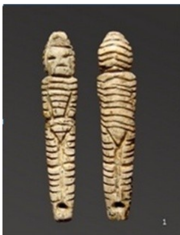
Slika. 2. Figurica iz Mal'te, s prikazom odjeće (modificirano prema Lbova 2021, Fig 3).

temelju morfologije, proporcije tijela, ornamentacije i prikaza odjeće identificirala 8 figurica djece i adolescenta, kao i 2 moguće figurice adolescenta. Te figurice nalaze se u sve tri prije spomenute kategorije. Sve figurice djece su ornamentirane. Mikroskopskom analizom mogu se utvrditi urezi koji prikazuju odjeću i obuću od različitog materijala (krzno, koža), kao i razne dodatke (slika 2). Korištenje crvene boje bila je tehnika kojom se obilježavala tranzicija iz djetinjstva u odraslu dob, posebice kod figurica ženskog spola (Lbova 2021: 5). Iako autorica ne nudi argumente kojima bi tu tvrdnju poduprla u svom radu, slično korištenje crvenog pigmenta je zabilježeno u etnografskim istraživanjima. Primjerice, žene Herero naroda, koji obitava u Namibiji, prekrivaju cijelo tijelo crvenom bojom, te tvrde da ne postoji Herero žena koja nije prekriveno crvenom bojom. Korištenje crvenog pigmenta u obredima prijelaza i inicijacije je također zabilježeno u etnografskim istraživanjima, primjerice u Himba narodu koji također obitava Namibiji (Rifkin 2015: 8).