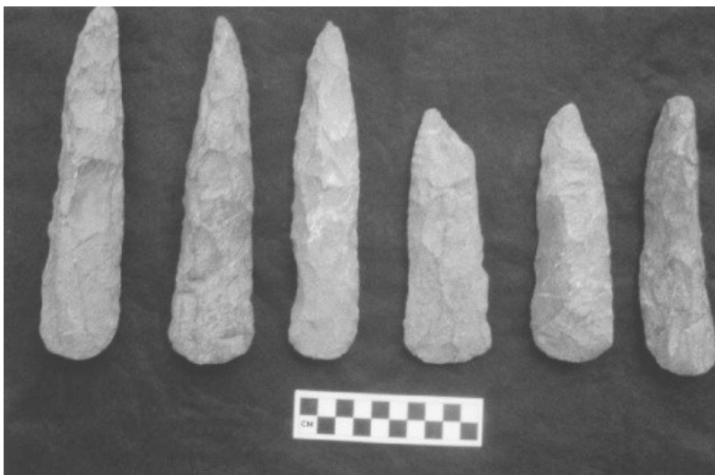
Slika. 4. Dopršene glave bradvi. Prve tri slijeva su proizveli iskusni majstori, dok su druge tri proizveli učenici (preuzeto iz Stout 2002, Fig. 12)

objasniti činjenicom da učenici imaju pristup isključivo materijalu ispod 200 milimetara dužine (Stout 2002: 706). Međutim, ako se uspoređi odnos duljine i širine, oruđa koja su izradili majstori su proporcionalnija, tj. majstori su sposobniji održati konstantan pravilan odnos između širine i dužine (slika 4). Svi učenici nadalje u potpunosti zanemaruju dorzalnu izbočinu, čija obrada zahtjeva veću razinu vještine za uspješnu obradu (ibid.). Učitelji u pravilu odlamaju duže, tanje i veće odbojke. Zamjetno je primijetiti da majstori imaju uhodan proces izrade, tj. prate iste korake prema ostvarenju cilja, što nije slučaj s učenicima (Stout 2002: 707-709).