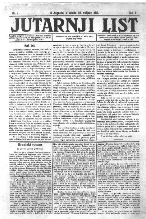
Slika 3 Naslovnica prvog broja Jutarnjeg lista, 28. veljače 1912.