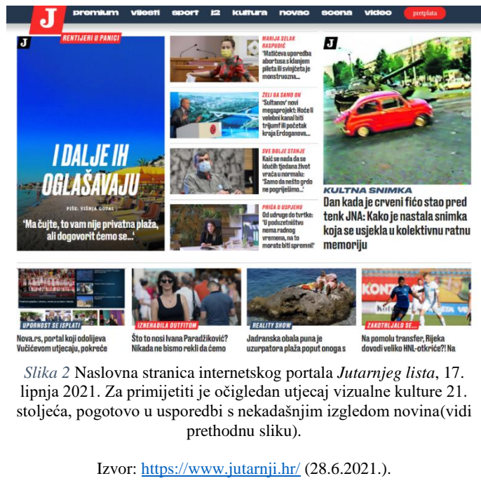
Slika 2 Naslovnica internetskog portala Jutarnjeg lista , 17. lipnja 2021. Za primijetiti je očigledan utjecaj vizualne kulture 21. stoljeća, pogotovo u usporedbi s nekadašnjim izgledom novina (vidi prethodnu sliku).