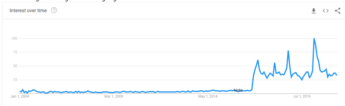
Slika 1: Traženost termina “fake news” (hrv. lažne vijesti) na tražilici Google. Prvi puta se ozbiljno pojavljuje krajem 2016. i početkom 2017., a vrhunac dostiže upravo u ožujku 2020. kada se službeno smatra da je počela pandemija koronavirusa.