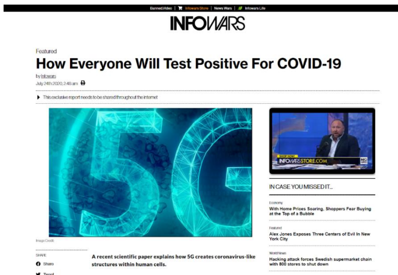
Slika 6 Članak o koronavirusu na stranici InfoWars .

No ako i sadržajno sagledamo 'vijesti' na takvim portalima, zanimljivo je primijetiti nekoliko stvari. Na primjer, već u prvoj rečenici članka „Tajna veza između koronavirusa 5G mreža“ za State of the Nation , stranicu poznatu po širenju teorija zavjere, autorica (pod pseudonimom?) izjavljuje: „Ja sam još na početku 2019. predvidjela da će postojati neka poveznica između 5G-a i lažnog virusa, abrakadabra!“ 74 Sama zamjenica „ja“ i započinjanje članka korištenjem iste sugeriraju da je cijeli članak opet temeljen dobrim dijelom na vlastitom mišljenju, a 'dokaz' koji slijedi odmah nakon uvodne izjave, onaj o 5G antenama u Wuhanu, evidentno je netočan. Ili, tu je tip vijesti poput one objavljene na stranici InfoWars , jednako notornoj po tipu sadržaja koji objavljuje kao i State of the Nation , čiji se sadržaj sastoji od velikog naslova „Kako će svi biti pozitivni na COVID-19“, podnaslova „Nedavni znanstveni članak objašnjava kako 5G stvara strukture slične koronavirusu u ljudskim stanicama“,