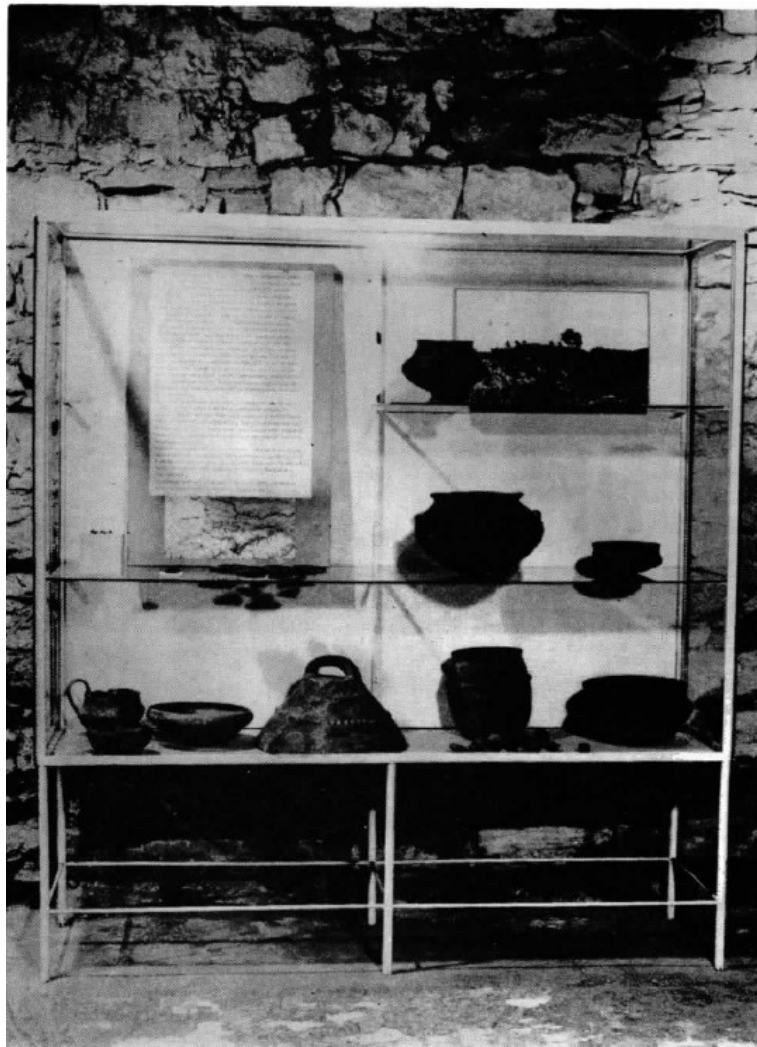
Slika 5 Detalj iz stalnog postava Arheološkog odjela smještenog u podrumu Staroga grada (Tomičić, 1985.b, 12)

Jedanaest godina kasnije, kao respektabilan istraživač i u ono vrijeme najbolji poznavatelj strukture terena i terenskog rada u varaždinskoj okolici, postaje prvim kustosom Prehistorijskog odjela, čime slijedno dolazi do uvođenja prvog stalnog postava arheološke građe u prizemlju palače Sermage ( Arheološki odjel , pristupano 03.04.2021.). U ulozi kustosa pretežno je posvećen terensko-istraživačkom radu, ali obavlja i post-terensku obradu materijala sa različitih lokaliteta, dopune arheološke topografije te paralelno kompletira muzejsku dokumentaciju arheološke i paleontološke građe uz ulogu odgovornosti prema stalnom postavu (ibid). Postav potom 1975. godine seli u podrumске prostorije tvrđave (slika 5), a nakon potresom uzrokovanih oštećenja 1982. godine, Gradski muzej Varaždin ostaje bez arheoloških, stalno eksponiranih predmeta (Tomičić, 1985.b, 10).