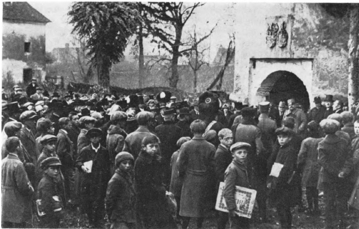
Slika 1 Svečano otvorenje Gradskog muzeja Varaždin 16. studenoga 1925. godine

Odlučeno je kako će se muzej nalaziti u dijelu gotičko-renesansne utvrde Stari grad, tada ekspropirane od plemićke obitelji Erdödy. Financiranjem poglavito iz donacija i vlastitih sredstava, uređen je interijer za prvi postav te je 16. studenoga 1925. godine svečano otvoren Gradski muzej Varaždin (slika 1) (Tomičić, 1985., 26). 3