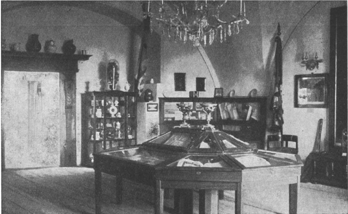
Slika 3 Renesansna soba

Po umirovljenju Krešimira Filića 1957. godine Gradski muzej Varaždin činilo je ukupno šest odjela; Kulturno-povijesni, Etnografski, Entomološki, Galerija, Odjel narodne revolucije i Prehistorijski odjel koji su raspodijeljeni u zgrade Staroga grada te palače Sermage i Herzer (Šimunić, 2005., 83).