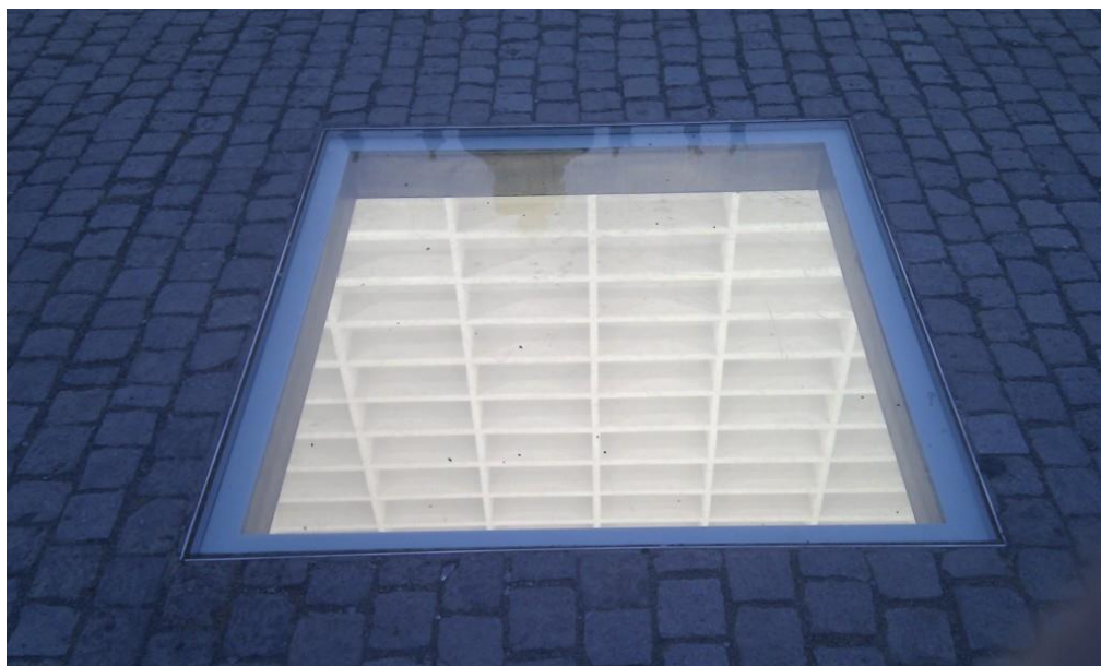
Slika 5. Spomenik na Opernplatzu u Berlinu

Spomenik je napravljen u dva dijela – nadzemni je dio kvadratna staklena ploča, u kojoj se reflektira nebo nad Berlinom, a podzemni dio je prostor koji se sastoji od četrnaest slojeva praznih, bijelih polica sa kapacitetom za 20000 knjiga. Taj broj je simboličan jer je toliko knjiga spaljeno 1933.godine na bivšem Opernplatzu. 81