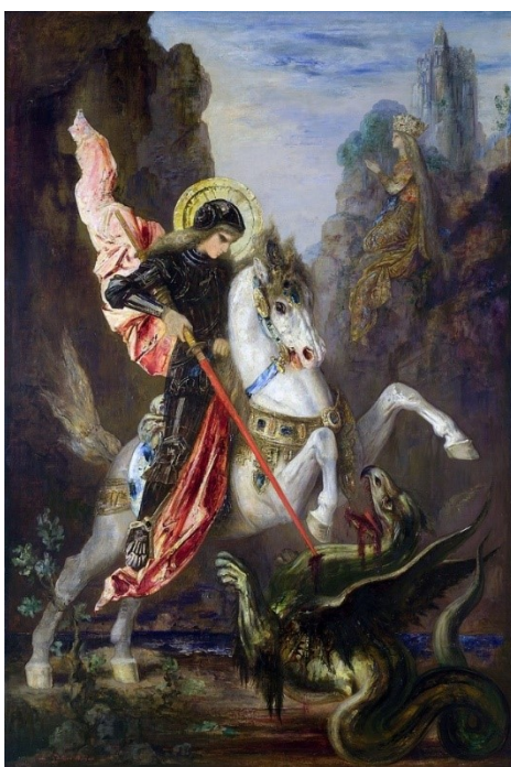
Slika 2. Sv. Juraj i zmaj, autor: Gustave Moreau

Brak se sklapa na Ivanje, trenutak u kojem Juraj postaje u narodnoj predaji Ivan kojeg ubijaju zbog bračne nevjere, a ljupka Mara postaje okrutna Morana koja umire pred kraj godine, kada priča ciklički počinje ispočetka. Dolaskom pred zlatna vrata Perunova dvora na Zemlji, prije nego će Juraj zaprositi Maru, predaje joj ključeve Velesovog mitskog svijeta Vireja „... kako bi se spajanjem dvaju principa – vlažnosti podzemlja i sunca gornjeg svijeta – dobio temelj plodnosti “ (Vukelić 2012:16).