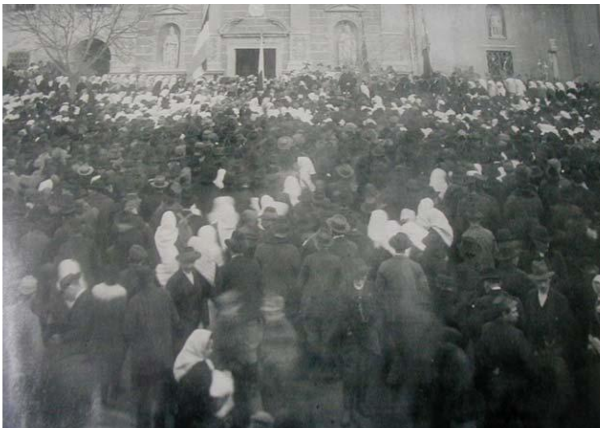
Slika 10. Međimurska narodna skupština 09.01.1919.