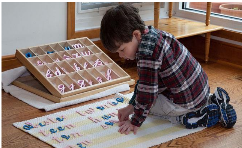
Slika 5.: Dječak koristi pokretnu abecedu ( https://forestbluffschool.org/the-montessori-approach-to-reading-and-writing/ ).

Pokretna abeceda služi za sastavljanje riječi od pojedinačnih slova koja su izrezana iz ružičastog i plavog kartona te odijeljena u posebne pretince unutar kutije pokretne abecede. Budući da prethodne vježbe za poticanje fonološke osjetljivosti i čitanja omogućuju djetetu da već poprilično raspoznaje glasove i njihove simbole – slova, u ovoj je vježbi, kako ističe Montessori, dovoljno polako i pravilno izgovoriti riječ kako bi dijete moglo prepoznati koje bi komponente, odnosno slova, trebalo koristiti iz pokretne abecede. Dijete promatra i traži odgovarajuće slovo unutar kutije pokretne abecede za glasove koje čuje te slova slaže jedno do drugoga pritom slažući čitavu riječ. S vremenom će dijete samo moći složiti bilo koju riječ koje se dosjeti. Kada dijete na ovaj način složiti riječ, ono je već može i pročitati. Prema tome, ovakva metoda uključuje procese koje dijete vode prema pisanju, ali istovremeno i prema