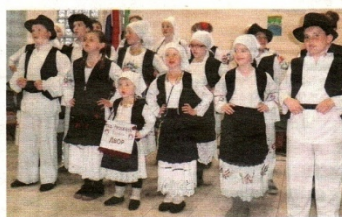
Djeca su predstavila običaje u društvenom domu

štava i udruga. Organizatori; Dječja igraonica Zvončica, Romski kulturni centar Sisak, Medžlisa Islamske zajednice Sisak, Srpsko kulturno društvo Prosvjeta pododbor Dvor i sisačka Parohija te župa Pohoda Blažene djevice Marije i MO Eugen Kvaternik vrlo su zadovoljni odazivom. Sišćana i najavljuju sličan program i iduće godine, koji će se možda proširiti i na neke druge županije i gradove. - Iz programa smo isključili