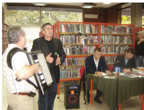
Slika 52. Dani bošnjačke kulture, 2010. (Iz arhiva Ogranka Caprag)