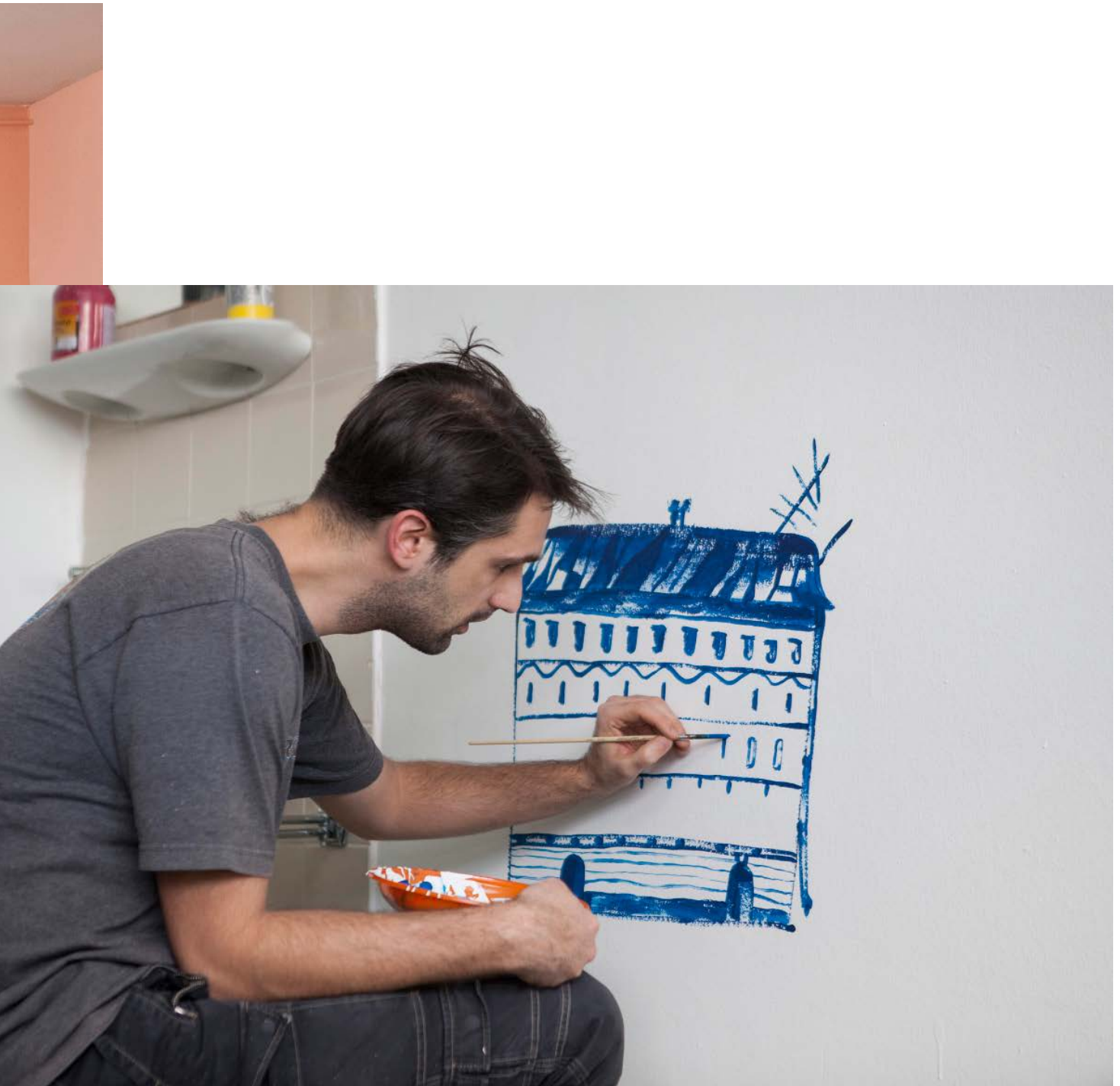
Oslikavanje terapijske sobe / The painting of the therapy room (Dominik Vuković, Pogled u bolje sutra [The View in the Better Tomorrow], 2019).