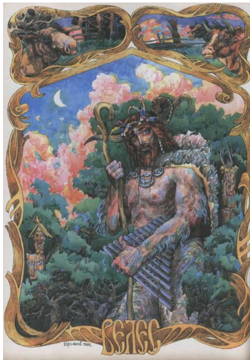
Slika 10. Veles

Dok smo proučavali Peruna, mogli smo već nešto saznati o Velesu. Kao što ranije navedeni prikaz oporbe pokazuje, uz Peruna se vežu vojnici, oružje, rat, a mjesto mu je na visini - na gori, planini, brdu. Suprotno njemu, uz Velesa se vežu seljaci, seljački imetak (stoka), bolesti i smrt, a Velesovo mjesto je dolje, u rijeci. U ranije spomenutom opisu, Veles se naziva „skotji bog“, što u prijevodu znači bog stoke: