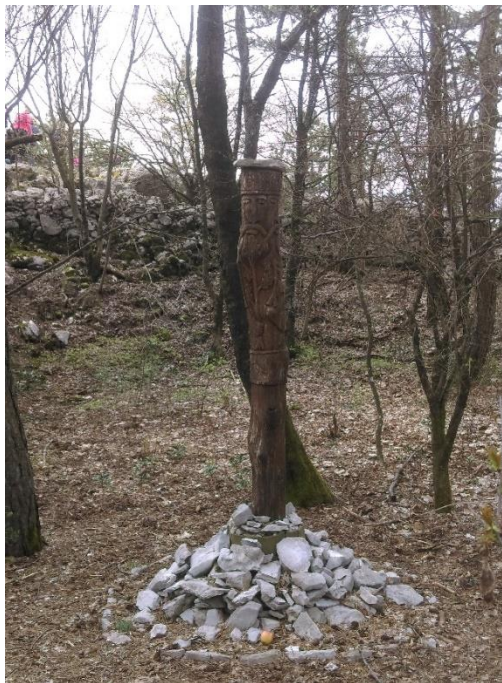
Slika 3. Kip Peruna