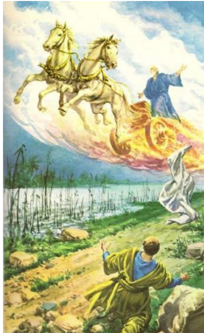
Slika 4. Sv. Ilija

dok su tako išli i razgovarali, gle: ognjena kola i ognjeni konji stadoše među njih, i Ilija u vihoru uzide na nebo“ (2. Kr 2,11).