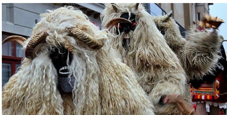
Slika 12. Đakovački bušari