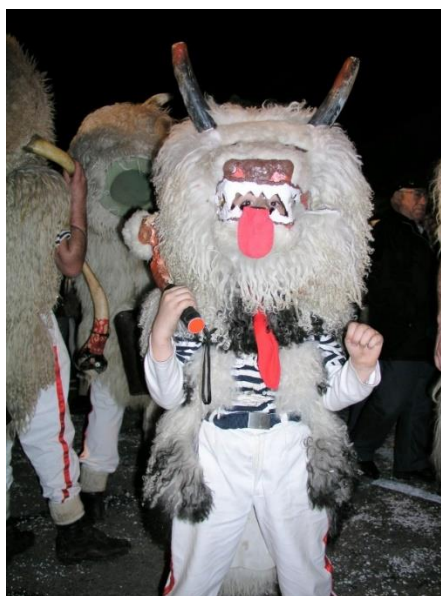
Slika 13. Zvončari iz Viškova