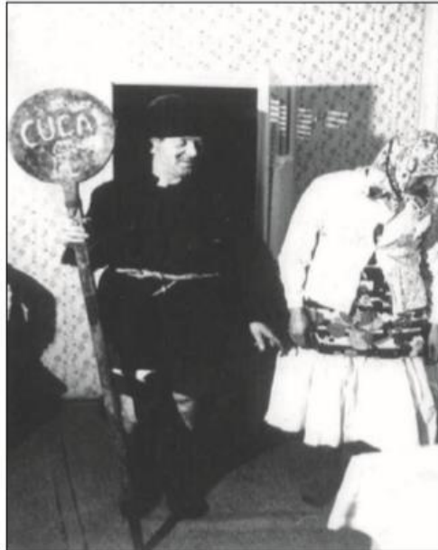
Slika 9. Baba i deda u svadbenoj dramskoj igri „Baba gljive brala“ (preuzeto iz Vince Pallua 2013: 233)

Dramsku igru „Baba gljive brala“ 12 nije moguće pronaći nigdje dalje osim u slovenskom Prekmurju, u Gornjem i Srednjem Međimurju u Podravini i kod prečkih Hrvata na mađarskoj strani (Vince Pallua 2013: 232). Ova dramska igra čvrsto je ukorijenjena u svatovskim običajima s inverzijom spola koja se očitovala kroz odjeću – babu uvijek igra muška osoba: „Muškarac se oblači u ženske haljine i maramom prekriva lice, a u rukama ima razne rekvizite: staro vjedro na kolcu kojim lupa, žarač ili tzv. lopar (široku lopatu za stavljanje kruha u krušnu peć), na kojem je najčešće kredom ili ugljenom nacrtan ženski spolni organ“ (Zvonar 2019: 35).