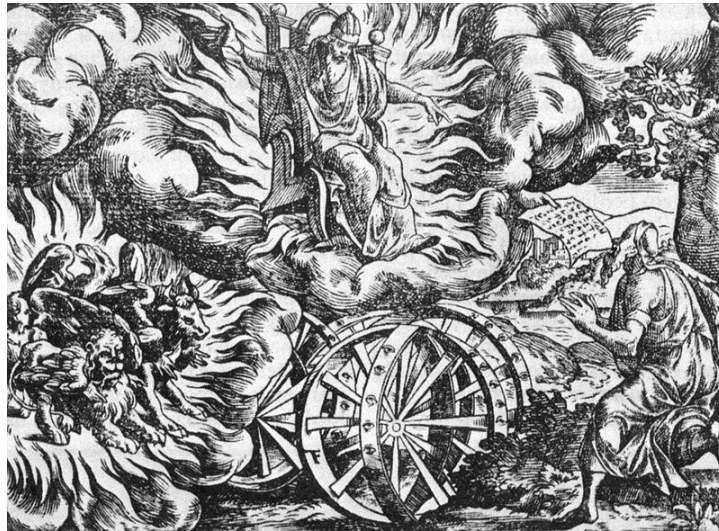
Slika 6. Gromovnik Perun

Bog gromovnik *Perun' u predodžbi je drevnih Slavena bio pokrovitelj vojne družine kao i njenog predvodnika, kneza. Njegovo je oružje kamen i strijela te sjekira, a drvo hrast. On živi na gori, povišenom mjestu, odakle gleda na sve četiri strane svijeta zbog čega se broj četiri smatra njegovim brojem: Polabljani su četvrtak nazivali Periunedan (no to može biti i prevedenica nj. Donnerstag). Nadalje, bračni se prsten stavlja na četvrti prst: to je simbol braka Peruna i njegove žene Mokoš. ( *Mokoš' je bila boginja plodnosti i kiše, kao i jedna od boginja u Rusiji kada je Vladimir došao na vlast) (Gluhak 1993: 475).