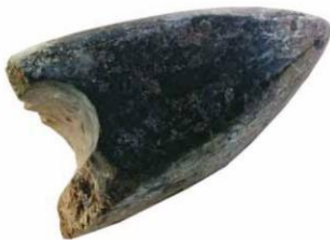
Slika 7. Kamena sjekirica (preuzeto iz Burić 2015)

Ovo vjerovanje nije isključivo slavensko. Slična vjerovanja možemo naći i kod Nijemaca koji su kamenu sjekiru zvali Donnerstein , Donnerkeil (gromov kamen, klin). Također i u Skandinaviji gdje se kamena sjekirica naziva Thorova strijela . Može se naći i od Mađara pa sve do finskih naroda, kod američkih Indijanaca, afričkih naroda, u Indoneziji, pa čak i Indiji i Kini što što ističe da su Slaveni ovo vjerovanje i običaj vjerojatno preuzeli iz praindoeuropske zajednice koja je ovo vjerovanje i običaj dijelila s drugim starim etničkim skupinama.