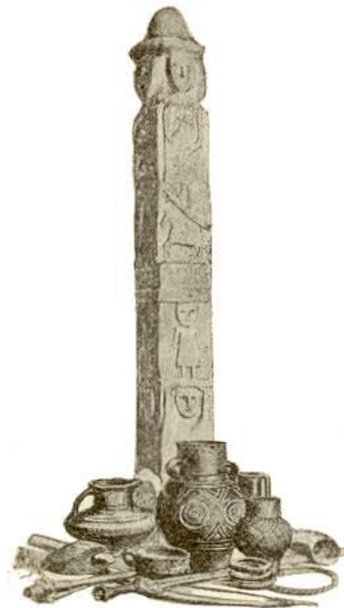
Slika 5. Svantevit prikazan kao bog s četiri lica

se Svantevit ne pronalazi nigdje dalje, nego samo kod Slavena na Rujani 10 , te nije nigdje dalje spomenut, a ne javlja se ni u kojem od primarnih izvora južnih Slavena. Nadalje, Belaj navodi kako se na opis o Svantevitu nailazi tek 1601. godine, i nakon toga ga se više ne spominje. Autor također uspoređuje Svantevitove značajke, kao što su činjenice da ima četiri lica od kojih je svako gledalo na svoju stranu, s obilježjem Peruna koji može biti višestruk: „Četvero je braće: istočni, zapadni, sjeverni i južni Perkun“ (Ivanov-Toporov 1974 u Belaj 2007: 190). Primjer svadbe koji Belaj navodi u svom članku govori o zdravici koja se izvodi, a govori o bogu koji sjedi visoko na vrhu i gleda u daljinu, te pokazuje vezu Peruna i sv. Vida. Svantevit kao bog postaje poznat tek preko pola tisućljeća nakon razilaženja praslavenske skupine, što znači, kako Belaj (2009: 191-192) navodi, da je imao dosta vremena da prilagodi svoje značajke novijim društvenim uvjetima, kao što je dodir s kršćanstvom, te se odmaknuo od Peruna i od istih ili sličnih svojstava napravio je svoje ime.