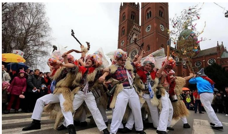
Slika 11. Đakovački bušari