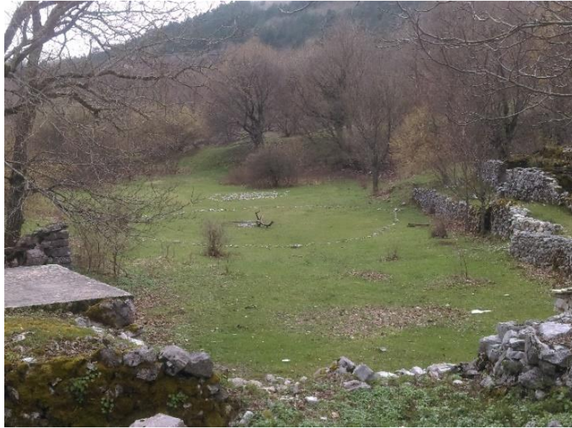
Slika 2. Rekonstrukcija slavenskog obreda