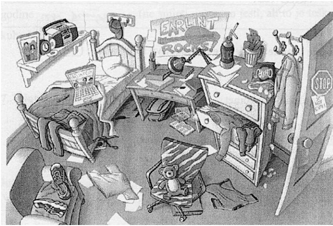
Slika 6. Učenci u eseju opisuju sobu sa slike