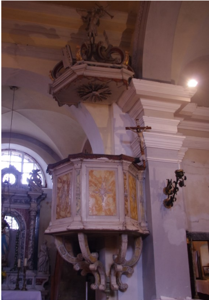
Slika 6: Veprinac, crkva sv. Marka, propovjedaonica, XVIII. st.

dva kanelirana stupa s kapitelima koju uokviruju vrata na kojima je izrađen motiv kaleža s hostijom. Zabat je izveden u florealnim i motivima školjke s pozlatom.