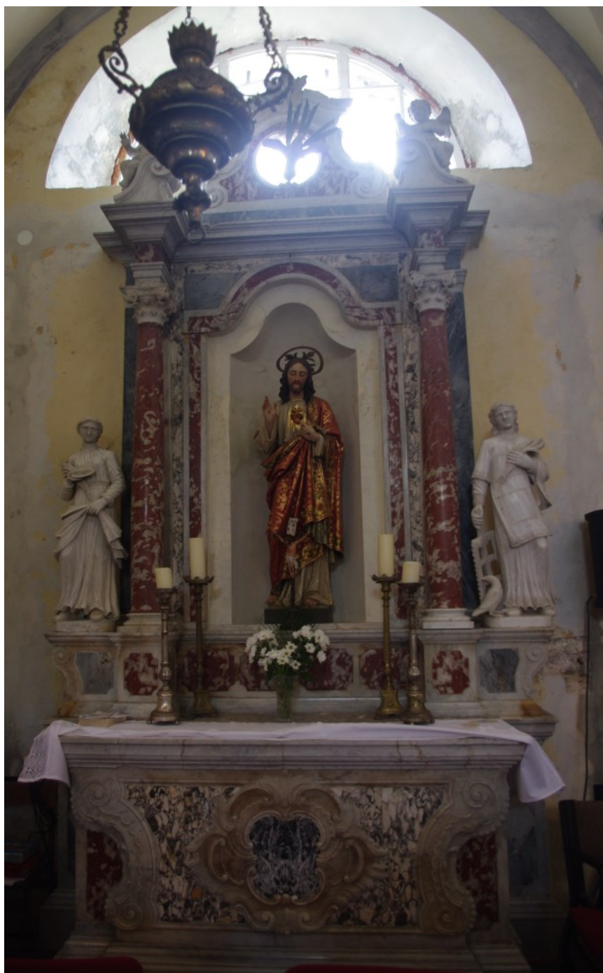
Slika 8: Veprinac, crkva sv. Marka, Oltar Srca Isusova , XVIII. st.

mramora. Cjelina gređa (tj. arhitrav i friz) prekinuta je duž cijeloga središnjega dijela oltarnoga nastavka (između stupova), dok neprekinuto teče samo snažno istaknuti vijenac. Zonu atike oltara naglašavaju, bočno, dva putta posjednuta na volutne odsječke zabata koji se nalaze direktno iznad stupova glavnine oltarnog nastavka te središnji dio s okruglim otvorom kroz koji izlazi golubica Duha Svetog. On je dodatno zaključen još jednim puttom koji to sve promatra odozgora.