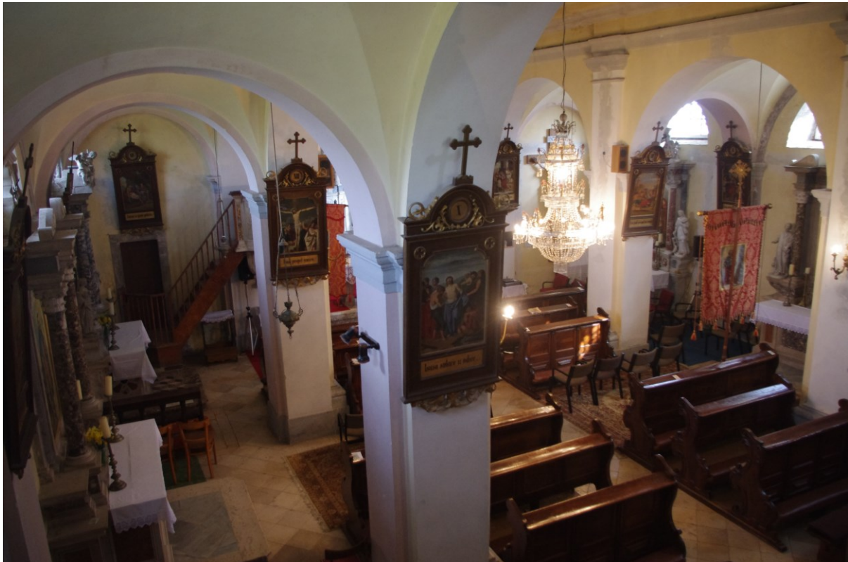
Slika 3: Veprinac, crkva sv. Marka, pogled s pjevališta.

Ziđe crkve je plošne obrade, a pod je popločan glatkim masivnim kamenim pločama između kojih se smjestilo i osam nadgrobnih ploča. Nadgrobnje ploče su danas uglavnom prekrivene sagovima: po jedna ploča nalazi se na podu svetišta, na podu ispred samog svetišta, dvije u desnom te četiri u lijevom bočnom brodu. Ploče potječu iz XVIII. stoljeća, uz iznimku jedne iz XVII., a nekolicina ih je bez napisa. Među kamenim nadgrobnim pločama ističe se ona kanonika Ivana Martinačića te njegovih roditelja Jurja i Uršule iz 1708. godine, smještena ispred svetišta. Njezino polje, uokvireno viticama i krilatim anđeoskim glavicama, krasi grb okružen akantovim listovima i napis: »RDVS D. PRESBYTER / IOANES MARTINACHICH / CANICVS SVIS GENTIBVS / GEORGIO OLIM SVPANO / ET CANCRIO ET VRSULÆ / IVGALLVM [...] HEREDIBUS / FIERI CVRAVIT / ANNO DOMINI 1708.«