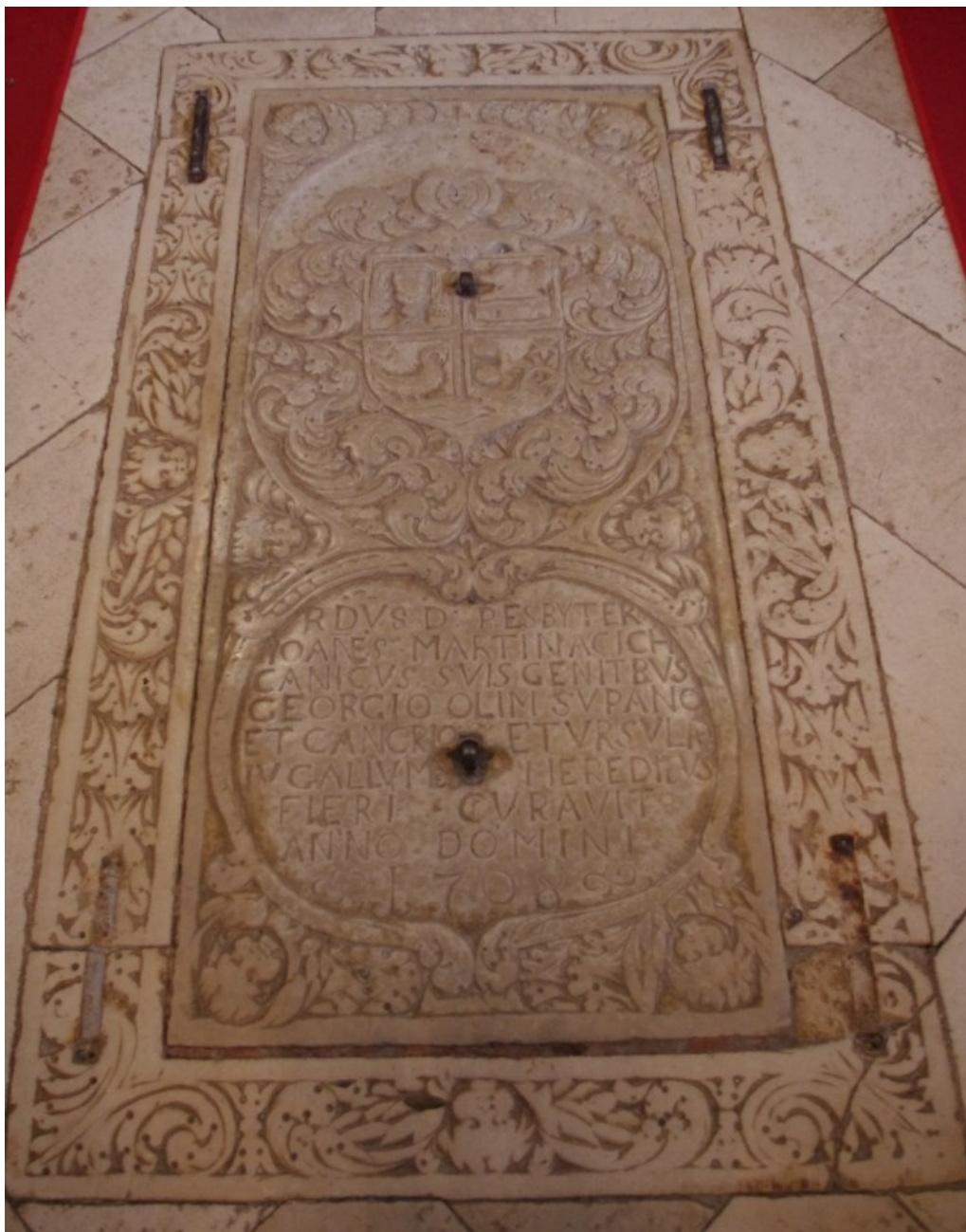
Slika 4: Veprinac, crkva sv. Marka, Nadgrobna ploča kanonika Martinačića, 1708.

Sjeverno od svetišta, u nastavku sjevernoga bočnoga broda, smjestila se sakristija. Zide crkve prekriveno je žbukom, a na njemu se nalazi četrnaest slika Križnog puta. Sedam slika je izvorno i izvedeno tehnikom ulja na platnu, dok je preostalih sedam reprodukcija.