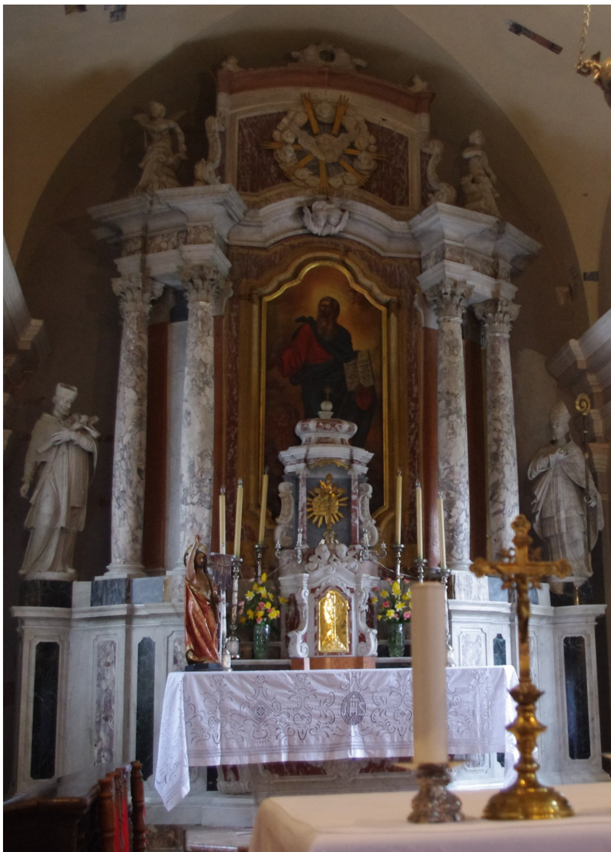
Slika 20: Veprinac, crkva sv. Marka, Glavni oltar , druga polovica XVIII. st.