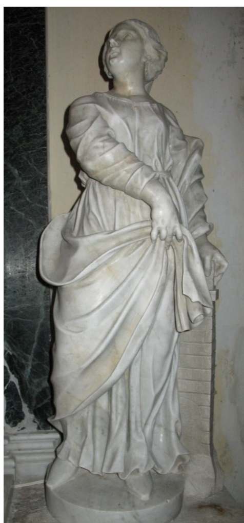
Slike 15 i 16: Neznani kipar, Sv. Katarina Aleksandrijska i Sv. Barbara, sredina XVIII. st., Veprinac, crkva sv. Marka, oltar Gospe Lurdske.