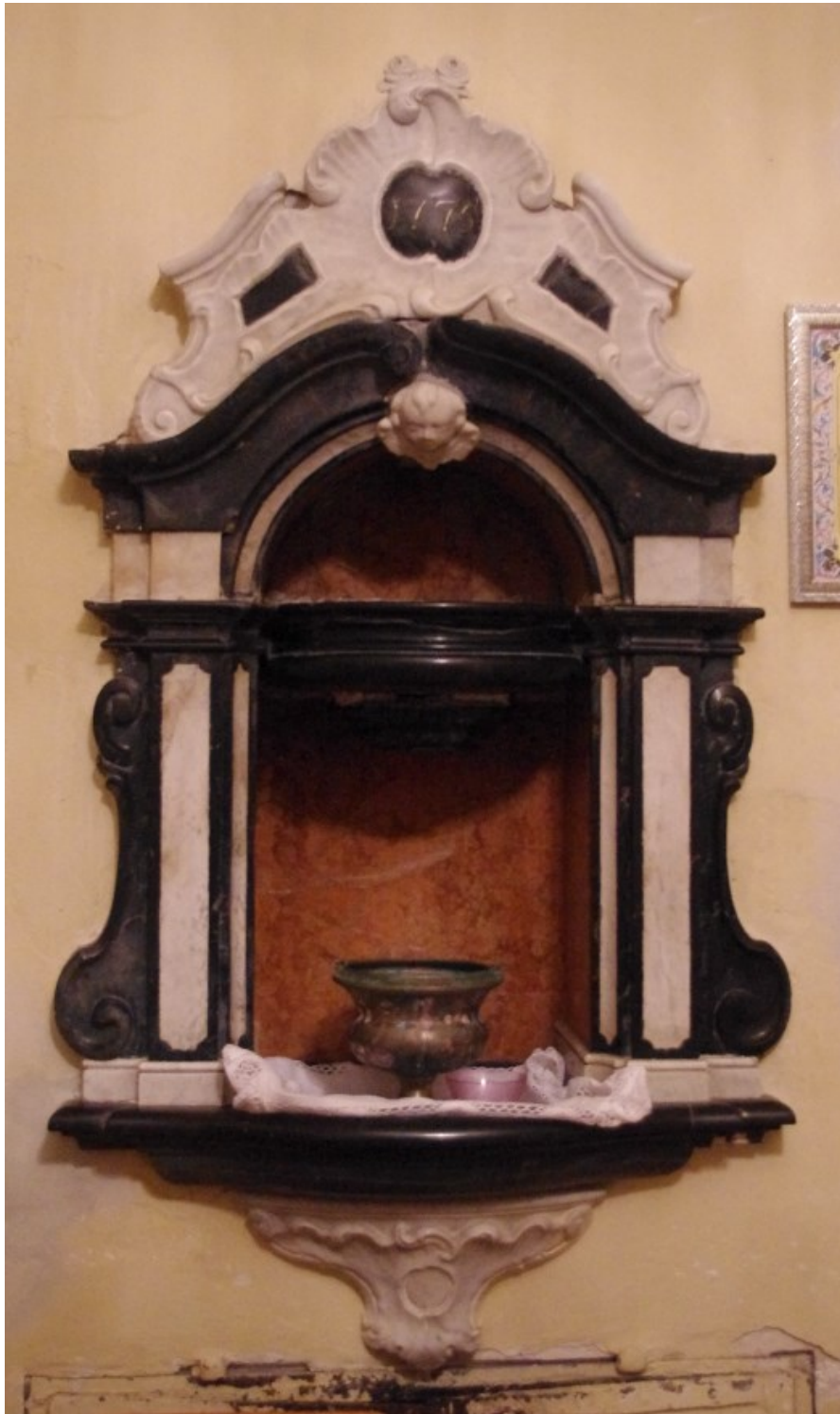
Slika 28: Veprinac, crkva sv. Marka (sakristija), Umivaonik , 1775.