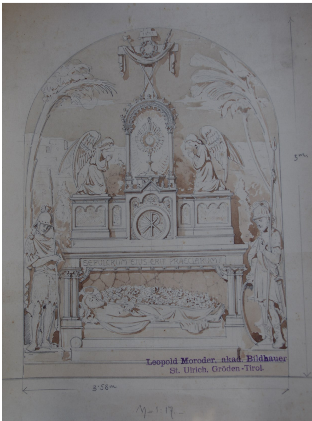
Slika 33: Leopold Moroder, Božji grob , oko 1899., tinta na papiru, Veprinac, Arhiv Župe sv. Marka Evandelista.

vidi: Irena Kraševac, »Tirolska sakralna skulptura«, 2006., str. 20–21. S Aloisom Moroderom autorica povezuje i kipove u crkvi sv. Marije pod Okićem.