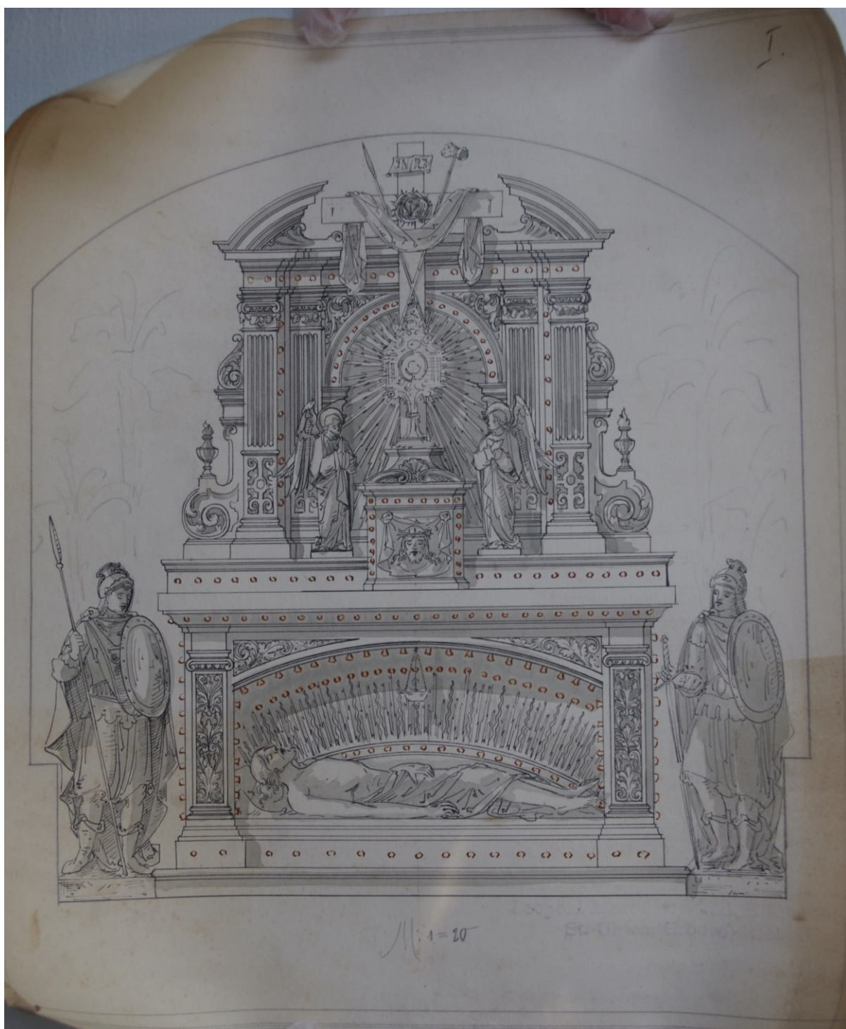
Slika 35: Leopold Moroder, Božji grob , oko 1899., tinta na papiru, Veprinac, Arhiv Župe sv. Marka Evangelista.