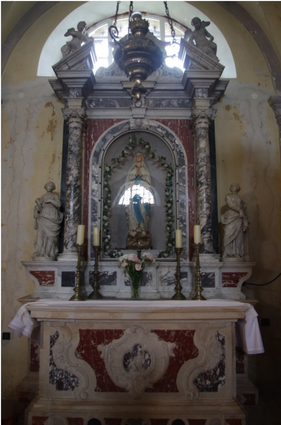
Slika 14: Veprinac, crkva sv. Marka, Oltar Gospe Lurdske , XVIII. st.