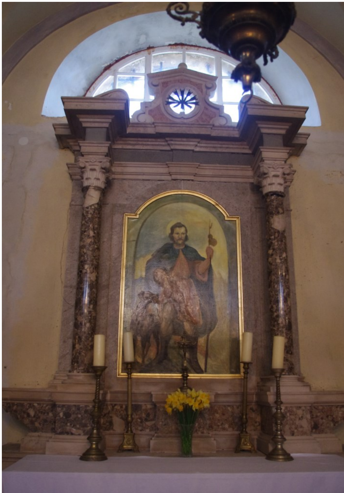
Slika 19: Veprinac, crkva sv. Marka, Oltar sv. Roka , XVIII. st.

draperiju. Pala je danas u znatnoj mjeri prekrivena slojem patine, stoga se boje čine još tamnije nego što uistinu jesu.