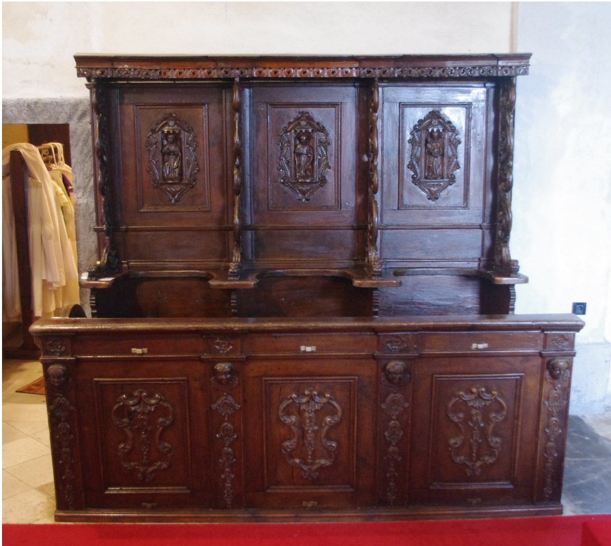
Slika 26: Radionica Mihovila Zierera, Korske klupe (sjeverna strana svetišta), XVII./XVIII. st., Veprinac, crkva sv. Marka.