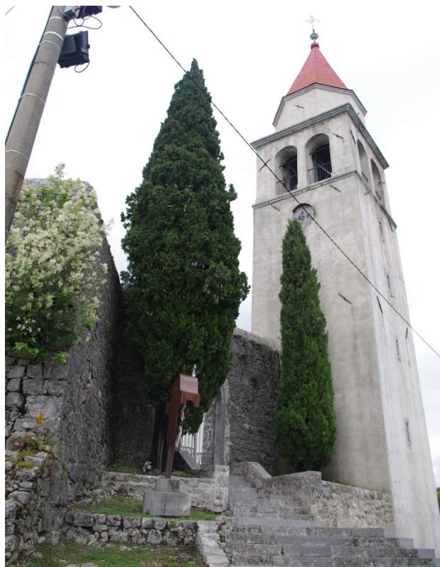
Slika 1: Veprinac, crkva sv. Marka, zvonik.

Sve navedene veprinačke crkve su male, jednostavne, pravokutne i jednobrodne pa je takva bila i ona romanička na mjestu današnje crkve sv. Marka, dok joj je kasnije, u doba gotike, produljen prezbiterij. Za vrijeme baroka, dok je bila pod patronatom riječkih isusovaca, crkva, sada posvećena sv. Marku Evanđelistu, postaje trobrodna građevina, kada se uz glavni brod nadograđuju dva bočna – niža i uža. Moguće je potvrditi i godinu 1689. kao terminus ante quem non za ovu pregradnju, jer je te godine u knjizi Janeza Vajkarda Valvasora, Die Ehre dess Hertzogthums Crain objavljena Valvasoreova grafika Veprinca koja prikazuje još jednobrodnu crkvu. 68