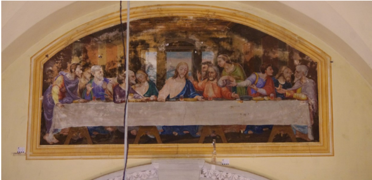
Slika 5: Neznani slikar, Posljednja večera , prva polovica XX. st. (?), Veprinac, crkva sv. Marka.

Na zidu trijumfalnoga luka naslikana je kompozicija Posljednje večere , nastala prema uzoru Da Vincijeve zidne slike iz refektorija dominikanskoga samostana Santa Maria delle Grazie u Milanu. Slika je vjerojatno nastala u XX. stoljeću, u secco tehnici te je dosta izbljedjela.