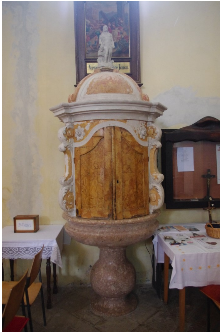
Slika 7: Veprinac, crkva sv. Marka, Krstionica.

ispovjedaonice, djelo XXI. stoljeća. Smještene su uz sam ulaz u crkvu, jedna, manja, u južnom brodu, i jedna, veća, u sjevernom brodu. Svojim oblikom imitiraju izgled orgulja – element kaneliranih ležena, a uokvirene su zabatom s ikonografskim motivom Oka Božjeg. Vidimo prikaz oka u trokutu sa čije se tri strane granaju zrake. Prikladan simbol za ispovjedaonicu, jer se interpretira stihom: »Božje oko svuda gleda, sakrit mu se ništa ne da.« 75