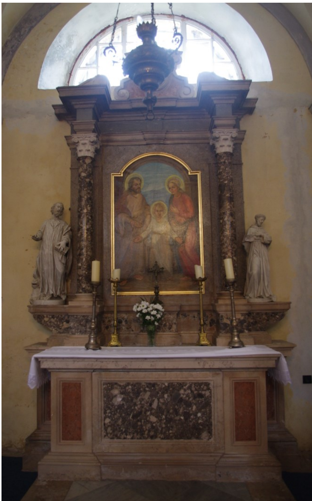
Slika 11: Veprinac, crkva sv. Marka, Oltar Svete Obitelji , XVIII. st.