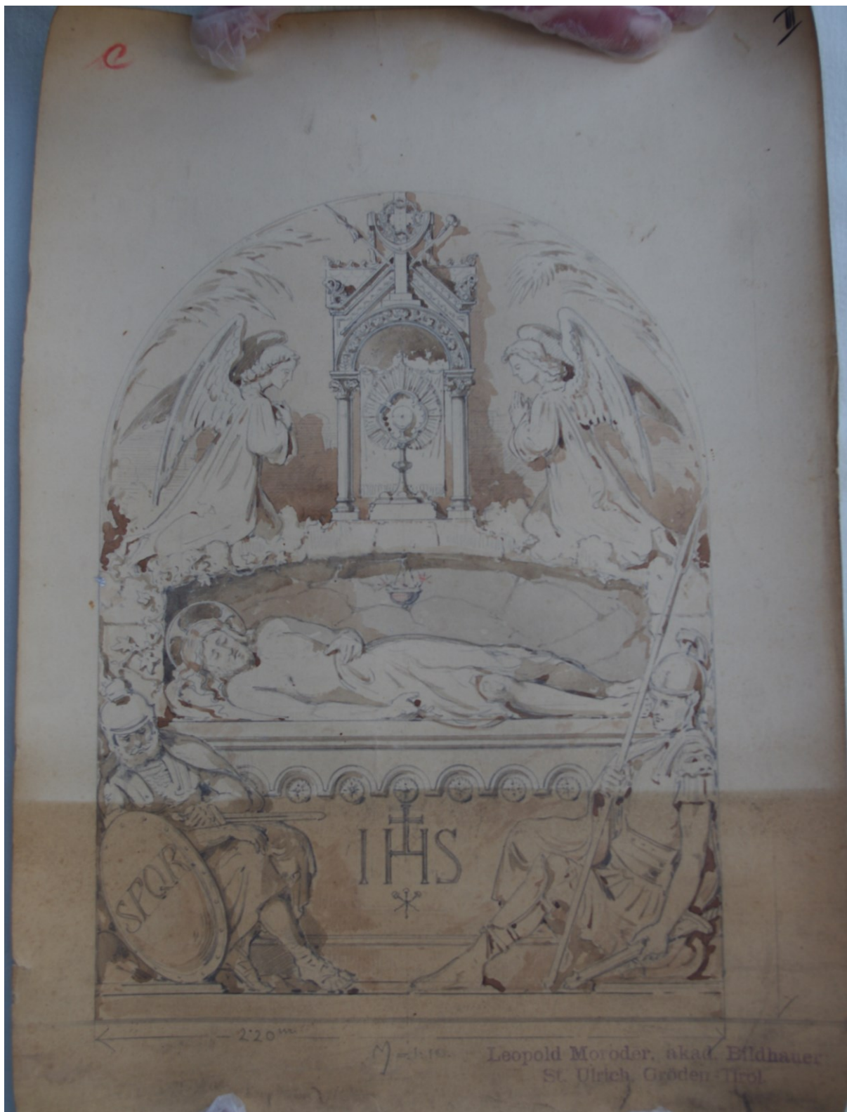
Slika 34: Leopold Moroder, Božji grob , oko 1899., olovka na papiru, Veprinac, Arhiv Župe sv. Marka Evandelista.