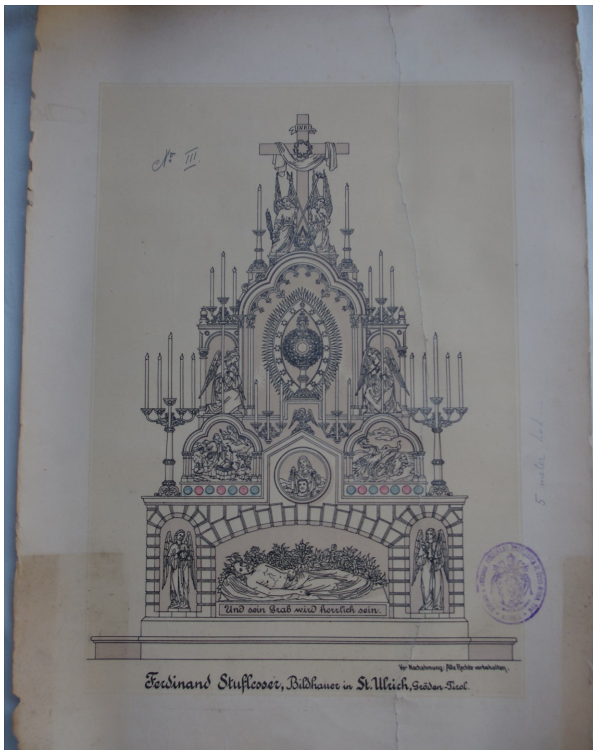
Slika 31: Ferdinand Stuflesser, Božji grob , oko 1899., tinta na papiru, Veprinac, Arhiv Župe sv. Marka Evandelista.

Duž donjega ruba, malo večim slovima, ispisano je sljedeće: »Ferdinand Stuflesser, Bildhauer in St. Ulrich, Gröden-Tirol.« Uz navedeni napis i ovaj crtež nosi spomenuti pečat Stuflesserove radionice.