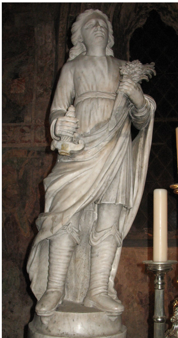
Slika 9: Neznani kipar, Sv. Lovro, druga polovica XVIII. st., Veprinac, crkva sv. Marka, oltra Srca Isusova