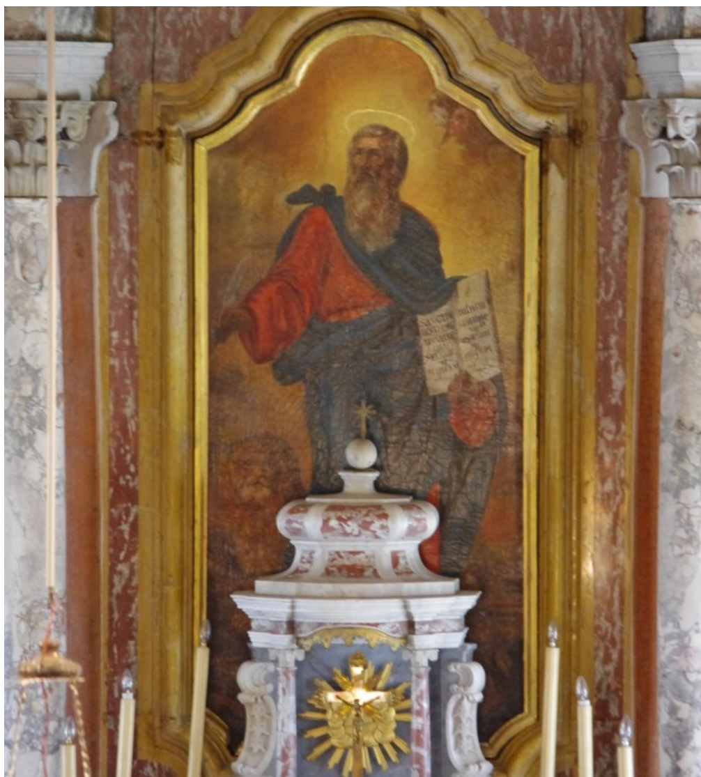
Slika 25: Neznani slikar, Sv. Marko Evanđelist , druga polovica XVIII. st., ulje na platnu, Veprinac, crkva sv. Marka, glavni oltar.