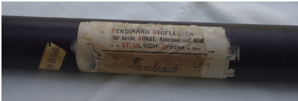
Slika 29: Spremnik s nacrtima Ferdinanda Stuflessera, Veprinac, Arhiv Župe sv. Marka Evandelista.

Briefe ). Na njemu je i naljepnica s oštećenim napisom: »FERDINAND STUFLESSER / [...] für kirchl. KUNST, Altarbau und Bildh[...] / [...] * ST. ULRICH –Gröden * Tirol«. Ispod je rukom zapisano: »Drucksache / Ferdinand Stuflesser / St. [...]«.