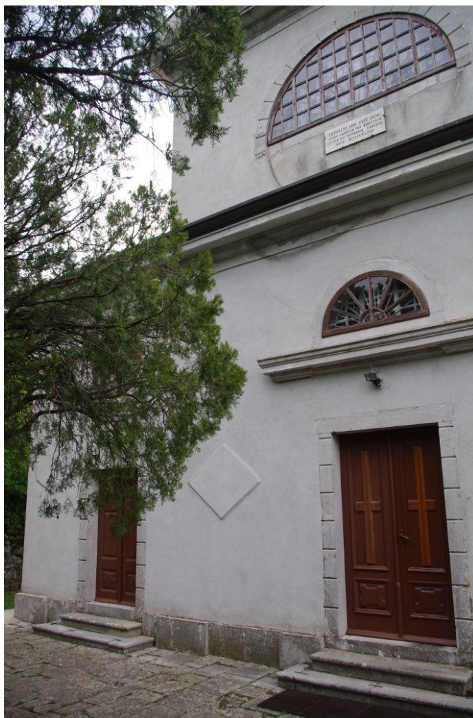
Slika 2: Veprinac, crkva sv. Marka, pročelje.

Pročelje crkve danas je jednoliko ožbukano, tako da se ne vidi nekadašnja imitacija grubo obrađenih kleasanaca, vidljiva na starijim fotografijama. Na njima se vidi i jasna horizontalna i vertikalna podjela pročelja. Vertikalna podjela bila je ostvarena lijepo obrađenim pilastrima – bili su ukrašeni uzdužnim pravokutnicima u čijem se središtu nalazio krug. Pilastri su dijelili pročelje na tri jednaka dijela. Danas se njihovo postojanje daje naslutiti samo u najdonjoj zoni zida po nekoliko isturenih kamena. Njih su zamijenila jednaka, u žbuci plitko istaknuta romboidna oblika koji odvajaju glavni portal od dva bočna portala. Poput pilastra i glavni se portal isticao lijepom obradom kamena i bogatom profilacijom motiva na dovratnicima i na nadvratniku, a bio je i viši i širi od ostalih. Iznad nadvratnika je stršao horizontalni vijenac nad kojim se smjestila luneta. Premda dovratnika i nadvratnika danas više nema, sva tri portala su izdvojena iz zidne mase ostatkom kamenog obruba, a dodatno su istaknuta i dvjema stubama. Horizontalni vijenac i dalje stoji nad nepostojećim nadvratnikom, kao i luneta iznad