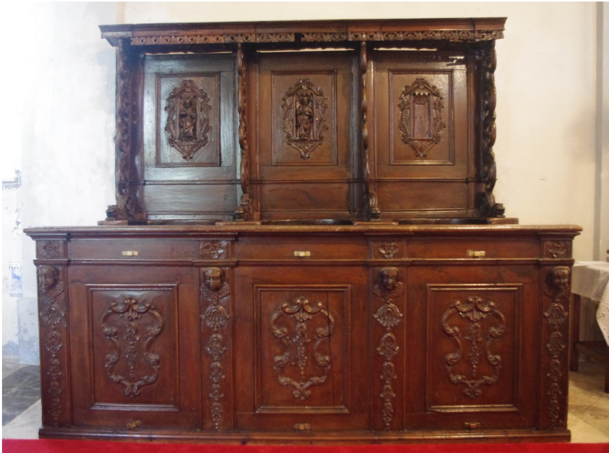
Slika 27: Radionica Mihovila Zierera, Korske klupe (južna strana svetišta), XVII./XVIII. st., Veprinac, crkva sv. Marka.

Usmjerimo li pozornost na ikonografski program naslona klupa vidjet ćemo kako svaku nišu krasi drugačiji lik. Korske klupe uz sjeverni zid svetišta sadrže tri svetačka lika, dok u nišama naslona klupa postavljenih uz južni zid svetišta, nedostaje jedna figura. U nišama na naslonima klupa na strani Evanđenja (sjeverno) prikazana su dva golobrada sveca odjevena u duge halje, s knjigama u rukama i sv. Antun Padovanski (prepoznatljiv po karakterističnom franjevačkom habitu i djetetu Isusu koje drži u rukama). Na naslonima klupa sa suprotne strane svetišta (strana Poslanice) prikazanu su dva bradata sveca, od kojih je prvi, temeljem ikonografskog atributa lava sklopčanog do nogu, prepoznatljiv kao sv. Marko. Moguće je stoga pretpostaviti kako je ikonografski program izvorno uključivao prikaze četvorice evanđelista (jedan od golobradih likova s naslona sjevernih klupa, zacjelo je sv. Ivan) te dva zasebna sveca. Od potonjih se u niši naslona na strani Evanđelja sačuvao lik sv. Antuna Padovanskoga, dok svetački lik u trećoj niši na strani Poslanice nedostaje.