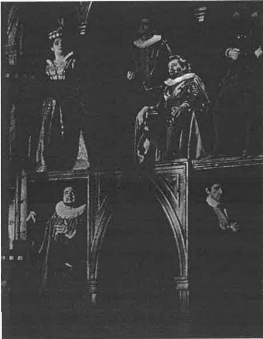
Der Häretiker von Ivan Supek (Schauspielhaus Gavella , Zagreb, 1969)