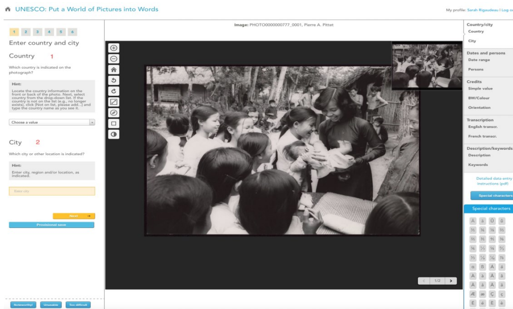
Slika 1. Sučelje za unos opisa slika UNESCO-ova projekta

U previđena polja unose se podaci o slici, kao što su lokacija i datum. Osim toga, obavlja se i prijepis teksta s pozadine slike, pri čemu se volontere potiče da isprave očite greške u tekstu. Uz sliku se postavljaju i ključne riječi. Osim toga, kreira se i opis slike koji sudionici projekta smišljaju sami prateći neka od ključnih pitanja o onome što vide na slici, a potiče se i prevođenje na druge jezike (slika 1). Nakon što se obavi prijepis, sve što je dodano se u sljedećemu koraku validira.