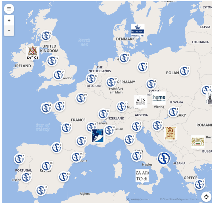
Slika 5. Karta projekta Arhivi su dostupni (Izvor: Archives are Accessible)

Pretraživanjem karte tako se može doći do informacija o trenutnome radu određene arhivske ustanove, ali i ono što je u ovome kontekstu još korisnije, pristup njenim digitalnim zbirkama koje su svima dostupne. Osim digitalnih kataloga i zbirki, prikazuju se i dostupne online izložbe i arhivske aktivnosti, kao i projekti nabave iz mnoštva. U ovaj su se projekt uključile i četiri ustanove iz Hrvatske, gotovo jedine iz cijele regije, a to su: Državni arhiv u Bjelovaru, Hrvatski državni arhiv, ICARUS Hrvatska te Hrvatska akademija znanosti i umjetnosti. Sve četiri ustanove nude pristup svojim digitalnim zbirkama.