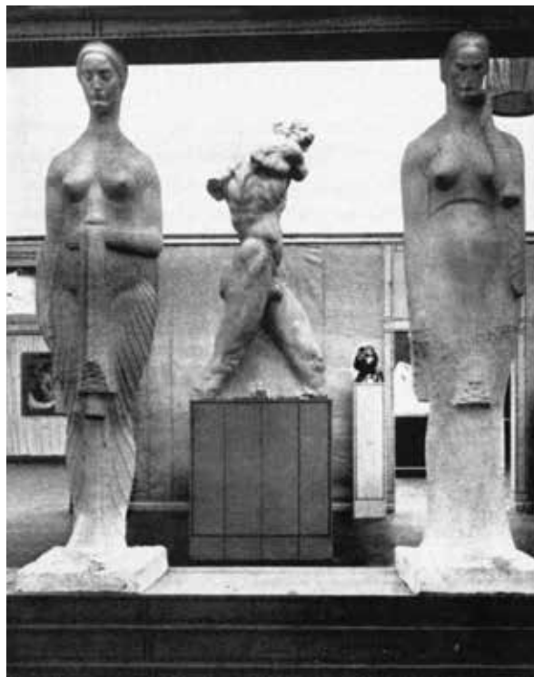
Ivan Meštrović, S izložbe Secesije u Beču, 1910. Ivan Meštrović, From the Secession Exhibition in Vienna, 1910

nik Neznamom junaku na Avali u Beogradu, Dom HDLU u Zagrebu, Njegošev mauzolej na Lovčenu), a i trajna zadivljenost Michelangelovim djelom 22 govori u prilog neprestanog i trajnog »osvrtnja«.