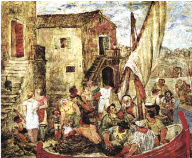
Juraj Plančić, Povratak s ribolova I (Mornari) , 1929., Moderna galerija, Zagreb

Juraj Plančić, Fishermen Returning I (Sailors) , 1929, Modern Gallery Zagreb