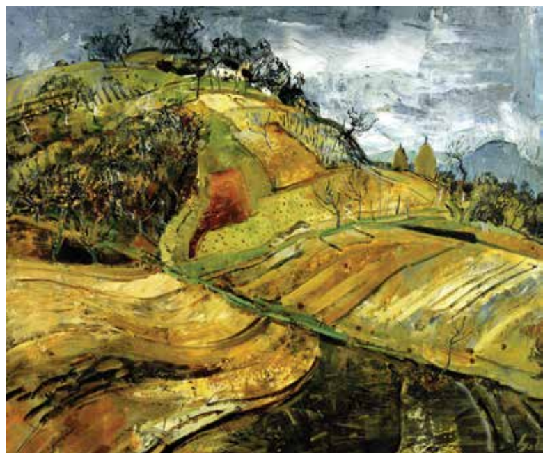
Ljubo Babić, Njiva (Proljetni pejzaž) , 1936., Galerija umjetnina, Split Ljubo Babić, Fields (Spring Landscape) , 1936, Art Gallery Split

Sodomu i Gomoru: »Berlin koji sve prodaje, koji bjesomučno egoistički špekulira, koji se utapa u bludu i luksuzu (...) Boga mi užasni su mi ovi velegradovi. Sada dobro razumijem onu perverznost raznih likovnih i književnih struja. Pa da, oni