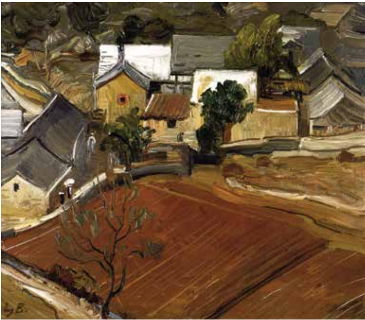
Ljubo Babić, Zagorski pejzaž (Novembar) , 1937., Moderna galerija, Zagreb Ljubo Babić, Zagorje Landscape (November), 1937, Modern Gallery Zagreb

utvrditi, da je taj naš osebujni izraz pri svom svršetku (...). Imajući u vidu te dvije suprotnosti, ta dva likovna svijeta, jedan potpuno primitivan i rustički, a drugi u svojim početnim fazama već urbanistički, razumjet ćemo i duboki jaz, koji ih dijeli. Jedan skroz na skroz vezan o potrebe i o tlo, izrastao iz rase, a drugi, da tako kažem, u zraku, nepovezan o svoju sredinu, u mnogo slučajeva i protivnik te sredine. Taj je drugi izraz pod stranim utjecajem izrastao zbunjen, ekonomski neuslovljen. 38