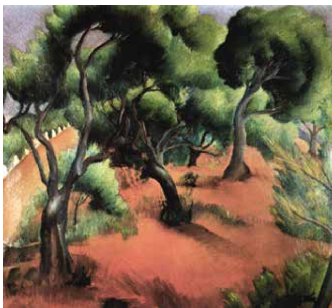
Jerolim Miše, Borovi u Supetru (Dalmatinski pejzaž) , 1928., Zbirka Flögel, Beograd Jerolim Miše, Pine Trees in Supetar (Dalmatian Landscape) , 1928, Flögel Collection, Belgrade

Sodomu i Gomoru: »Berlin koji sve prodaje, koji bjesomučno egoistički špekulira, koji se utapa u bludu i luksuzu (...) Boga mi užasni su mi ovi velegradovi. Sada dobro razumijem onu perverznost raznih likovnih i književnih struja. Pa da, oni