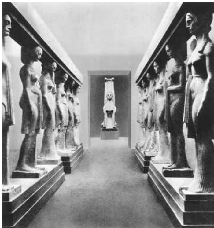
Ivan Meštrović, S izložbe Secesije u Beču, 1909. Ivan Meštrović, From the Secession Exhibition in Vienna, 1909