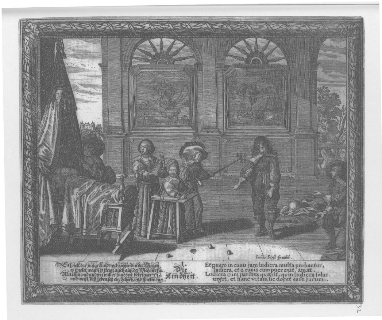
Slika 12. Anonimni autor, Die Kindheit , nakon 1636., Iconotheca Valvasoriana, V. svezak

Grafika Die Jungheit 114 (Mladost) (Slika 13) prikaz je raskošno odjevena mladog para u trenutku izmjenjivanja ljubavnih nježnosti. Kadar je širok i obuhvaća krajolik čija se dubina može podijeliti na tri prostorna pojasa. Figure mladića, djevojke i Kupida pored njih prikazane su u punoj visini, a mladić i djevojka ispunjavaju nešto više od polovice visine kadra. Par je smješten blago na desno od polovice kompozicije, a desno od njih je barokna fontana u sjeni. Na lijevoj strani smještena su dva stabla koja rastu isprepleteno ovijajući se jedno oko drugoga, što simbolizira bliskost i stapanje dviju jedinki. Odmah iza mladića i djevojke na desnoj polovici kompozicije nalazi se raskošna palača koja omeđuje prvi prostorni pojas te zatvara pogled na krajolik iza nje. Na istom pravcu kao i palača proteže se ograda s balustradama iza koje se prostire geometrijski organiziran vrt, tipičan za krajobraznu arhitekturu kasnog XVI. stoljeća. Vrt čini drugi prostorni pojas te je ograđen visokom ogradom, a iza njega u trećem prostornom pojasu u daljini prikazana