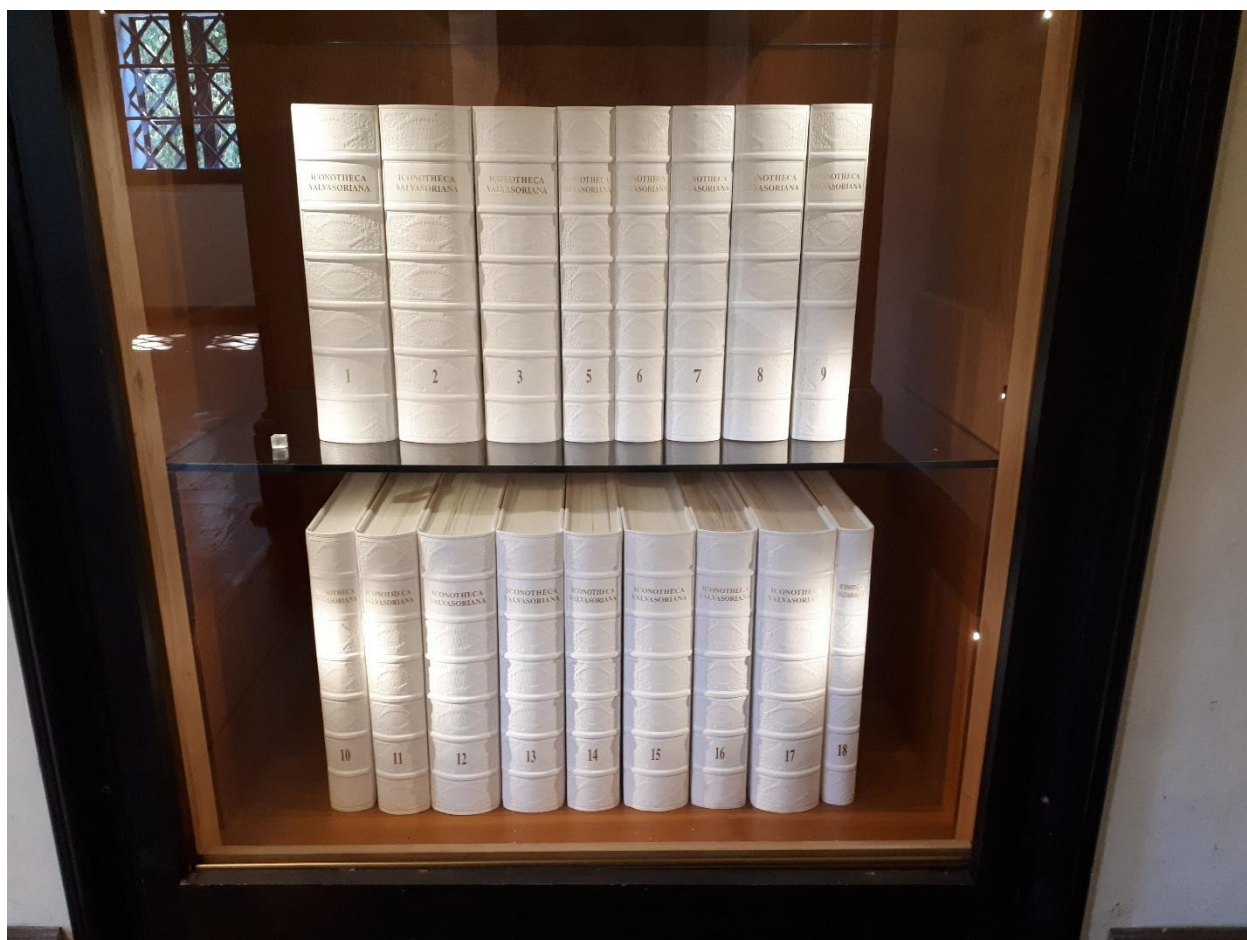
Slika 17. Izdanje Iconothece Valvasoriana u dvorcu Bogenšperk

Melbournea, Austrijska nacionalna knjižnica u Beču, Nacionalna knjižnica Crne Gore, Akademija nauka i umjetnosti BiH, Predsjednička knjižnica Makedonije, Austrijska nacionalna knjižnica, Bavarska državna knjižnica, Nacionalna i studijska knjižnica u Trstu, Koroški regionalni arhiv, Ured predsjednika Republike Slovenije i najvažnije slovenske knjižnice i muzeji. 132