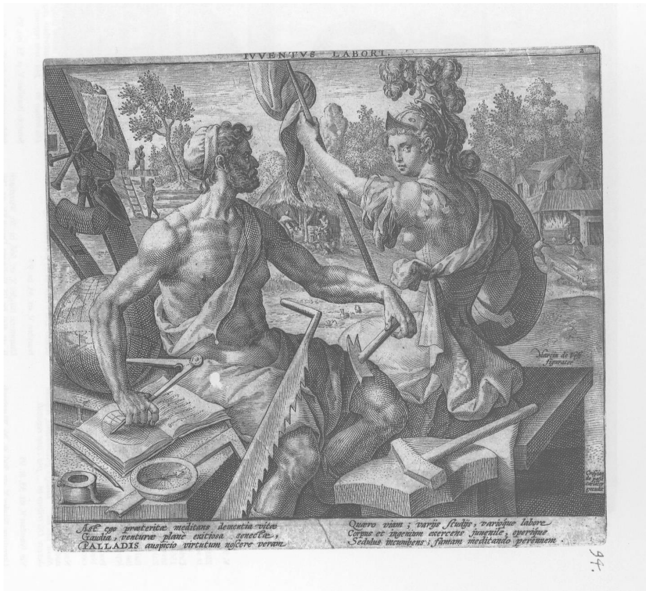
Slika 9. Crispijn de Passe I., Iuventus Labori , 1596., Iconotheca Valvasoriana, V. svezak

je tekst: Ast ego praeteritae meditans dementia vitae / Gaudia, venturae planè exitiosa senectae, / PALLADIS auspicio virtutum noscere veram / Quaero viam; varijs studijs, varioque labore / Corpus et ingenium exercens juuenile, operique / Sedulus incumbens; famam meditando perennem. Inventor ciklusa opet je naveden na sredini grafike s desne strane: Martin de Voss / figurator , dok je ime autora ispisanu u donjem desnom kutu grafike: Crispian de / passē / caelator / excudit.