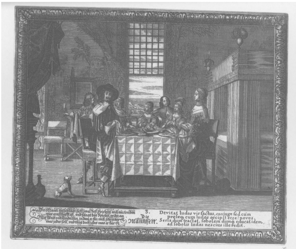
Slika 14. Anonimni autor, Die Mannheit , nakon 1636., Iconotheca Valvasoriana, V. svezak

vremena za objedom. U seriji anonimnog autora zrela dob predstavljena je drukčije nego u prethodnim serijama. Ovdje se ne naglašava rad kao glavno obilježje života srednjih godina, već osnivanje vlastite obitelji. Protagonist koji predstavlja zrelu dob sjedi na lijevoj strani stola te je jedina figura pogleda uprtog u promatrača, a nasuprot njemu sjedi njegova trudna supruga. Za stolom sjede još četvero djece, a jedan dječak prikazan je kako se ustaje i istovremeno razgovara sa sestrom. S lijeve i desne strane stola prikazani su i pas i mačka, čime se još više naglašava obiteljska bliskost i toplina. Na margini grafike naveden je naslov Die Mannheit uz redni broj 3. Kao i dosad, s lijeve strane napisan je tekst na njemačkom jeziku: Der Mann entschtagt sich zwar deß Spielens will nur treiben / was ernsthaft ist, und fängt das Spielen wider an / Mit Weib und Kinder sein in dem er für will schreiben / was jedes soll, und thut doch jedes was es far. Desno od naslova napisan je tekst na latinskom jeziku: Devitat ludos vir factus, conjuge fed cum / proleque cum ludos occipit ecce! novos. / Seria dum tractat, sobolem dumque educat idem, / ad sobolis ludos nescius ille redit.