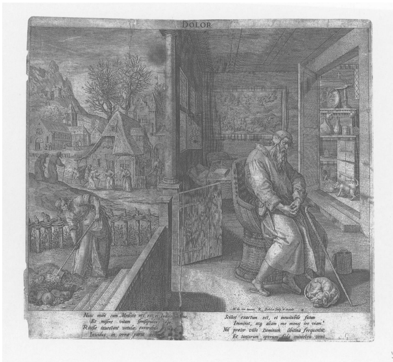
Slika 7. Raphael Sadeler I., Dolor , 1591., Iconotheca Valvasoriana, V. svezak

Serijs Crispijna de Passea I. nastala je kao varijanta invencije Maartena de Vosa pet godina nakon serije Raphaela Sadelera I., 1596. godine, a nakladnik je sam Crispijn De Passe, što je također razvidno iz potpisa na grafikama. Sastoji se od grafika Adolescentia Amori , Iuventus Labori , Virilitas Honori i Senectus Dolori .