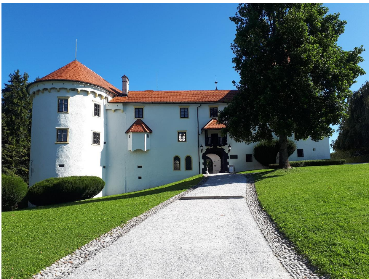
Slika 3. Dvorac Bogenšperk, Šmartno pri Litiji, Slovenija

Nakon ženidbe s Anom Rosinom Groffenbegerin von Graffenhau 1672. godine, Valvasor od baruna Franca Alberta Kheysella kupuje dvorce Bogenšperk (Slika 3), Črni Potok i Lichtenberg. Neće ih moći potpuno otplatiti do kraja života, što je već tada zapečatilo nadolazeće financijske probleme. 55 U sljedećih nekoliko godina Valvasor je predano izučavao povijest i geografiju Kranjske i posvetio se tome da je kroz publikacije i grafike predstavi svijetu. Ta nastojanja dovela su do osnutka grafičke radionice u Bogenšperku 12. travnja 1678. godine. Glavna djelatnost radionice bila je izrada topografskih slika grofovije Kranjske. Slične grafike već su bile vrlo popularne u njemačkim zemljama, a Valvasor je bio prvi koji je pokrenuo izradu bakroreza u Kranjskoj. Neki od grafičara koji su djelovali u Valvasorovoj radionici u Bogenšperku su Andreas Trost, Janez Koch, Matija Greischer, Peter Mungerstorff, Johann Wirriex, Jernej Ramschuess, a za nas je najvažniji Pavao Ritter Vitezović. 56