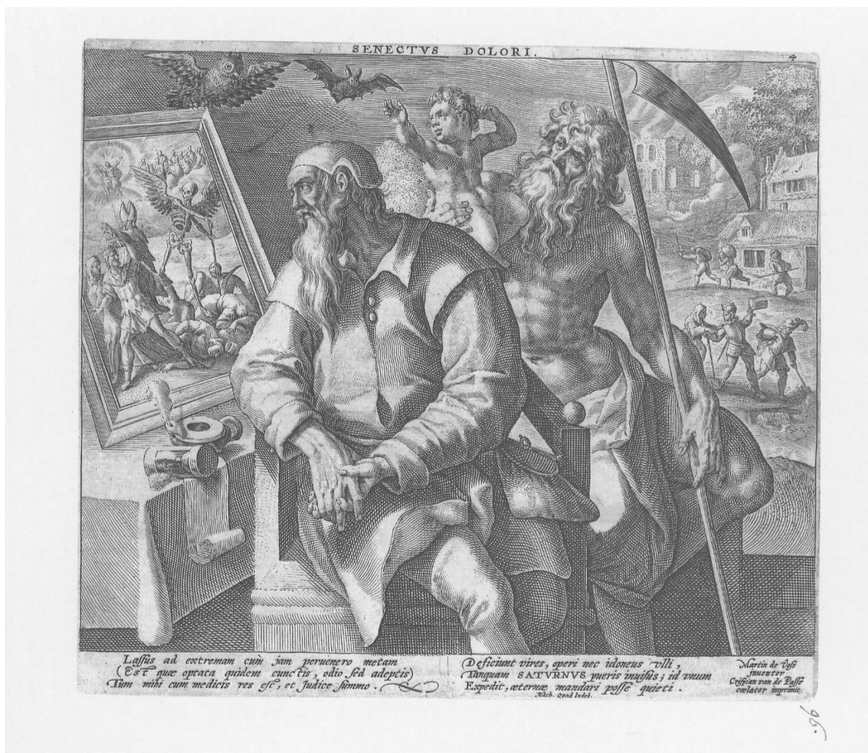
Slika 11. Crispijn de Passe I., Senectus Dolore , 1596., Iconotheca Valvasoriana, V. svezak

Serijsa anonimnog autora nastala je prema invenciji Abrahama Bossea (1604., Tours – 1676., Pariz) 110 , a nakladnik je Paulus Fürst (1608., Nürnberg – 1666., Nürnberg) 111 , koji se potpisao samo na prvoj od grafika: „Paulus Fürst Excudit.“ Serijsa se sastoji se od grafika Die Kindheit , Die Jungheit , Die Mannheit i Das Alter . Točna datacija grafika nije poznata, ali istovjetan Bosseov ciklus nastao je 1636. godine 112 , tako da je serijsa anonimnog autora sigurno nastala nakon te godine.