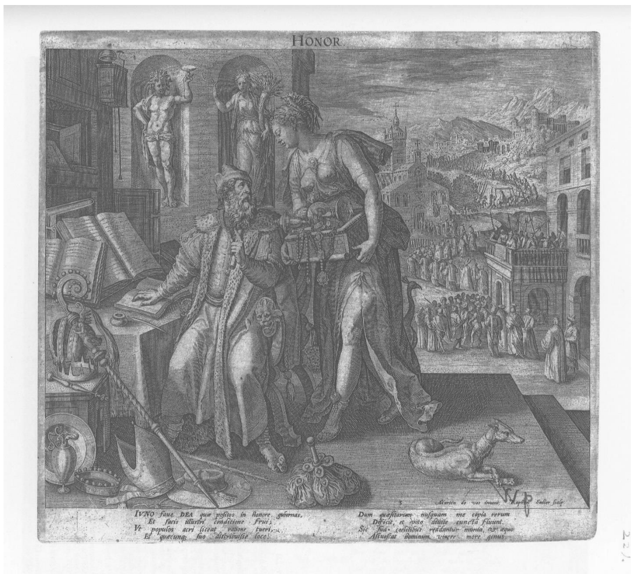
Slika 6. Raphael Sadeler I., Honor , 1591., Iconotheca Valvasoriana, V. svezak

vojna povorka, sve do gradskih zidina iza kojih su u četvrtom prostornom pojasu prikazani obrisi grada i planina. Riječ koja stoji na vrhu ove grafike je Honor , jer u zreloj dobi čovjek uživa povlastice časti i obilja stečenih zbog napornog rada iz ranijih razdoblja života. Procesija i vojna povorka odabrane su upravo kao simboli časti. U donjem desnom kutu grafike napisan je broj 3 (redni broj grafike u seriji) te Martin de vos inuent: i Raphael Sadler scalp:. Na donjoj margini grafike u dva stupca od četiri retka ispisan je tekst: IVNO faue DEA quae positas in honore gubernas, / Et facis illustri conditione frui ; / Vt populos acri liceat ratione tueri, / Et quaecunque suo distribuisse loco. / Dum quaesitarum nusquam me copia rerum / Deficit, et voto diuite cuncta fluunt. / Sic sua coelitis reddantur munia, et aequo / Assuescat hominum viuere more genus.