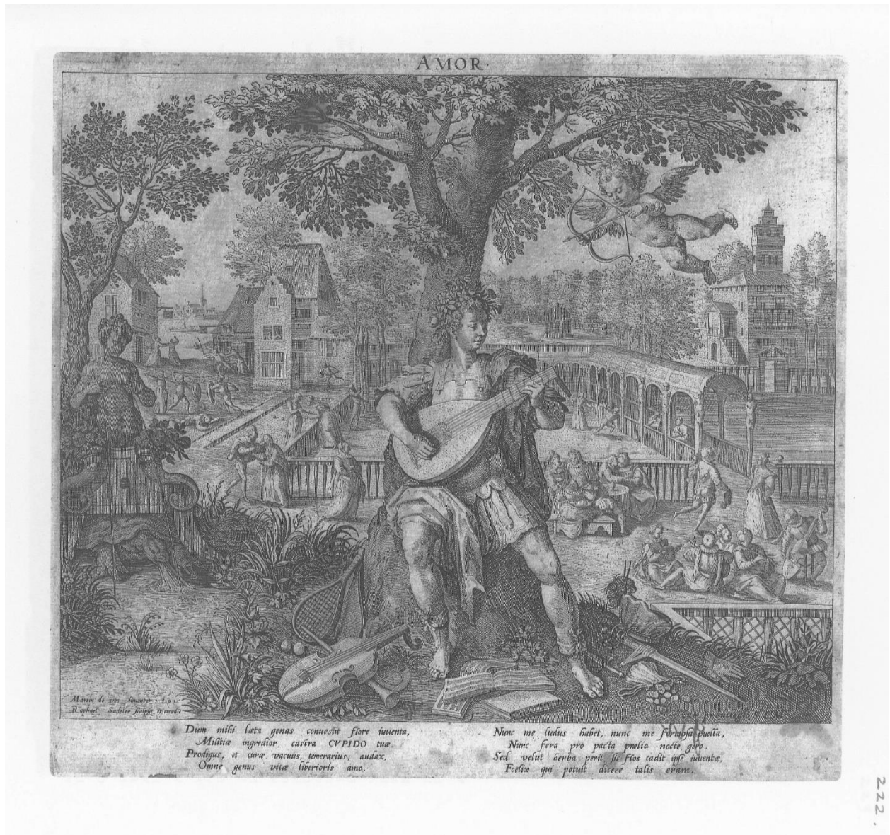
Slika 4. Raphael Sadeler I., Amor , 1591., Iconotheca Valvasoriana, V. svezak

mačuju se i sl. Točno iza mladića s lutnjom iz prvog prostornog pojasa prostire se pravokutni ograđeni prostor, s dvije strane omeđen ogradom, a s druge dvije lučno nadsvođenim arkadama. U trećem prostornom pojasu s lijeve strane od središta kompozicije prikazan je grad s lukom, a s desne strane nalazi se šuma ispred koje dominira paviljon. Na gornjem okviru grafike napisana je riječ Amor , što sugerira na ljubav kao dominantni osjećaj razdoblja mladosti. U donjem lijevom kutu grafike ispisan je Martin de vos inventor 1591 / Raphael Sadeler scalpsit et excudit . Na donjoj margini grafike u dva stupca od četiri retka ispisan je tekst: Dum mihi laeta genas conuestit flore iuuenta, / Militiae ingredior castra CVPIDO tuae. / Prodigus, et curae vacuus, temerarius, audax, / Omne genus vitae liberioris amo. / Nunc me ludus habet, nunc me formosa puella, / Nunc fera pro pacta pnelia nocte gero. / Sed velut herba perit, sic flos cadit ipse iuuentae, / Foelix qui potuit dicere talis eram.