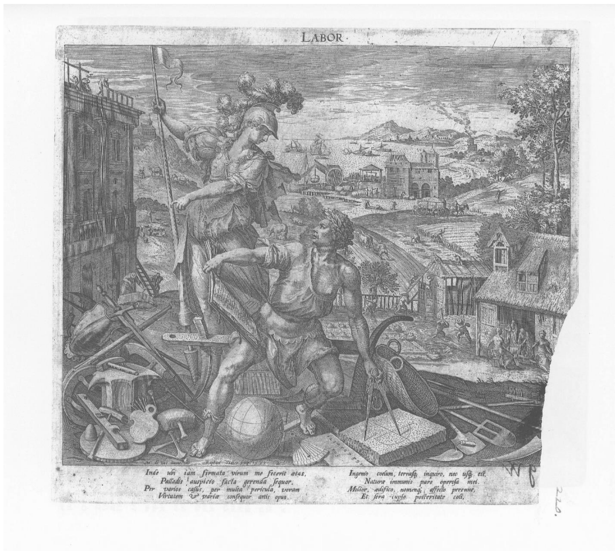
Slika 5. Raphael Sadeler I., Labor , 1591., Iconotheca Valvasoriana, V. svezak

I kod grafike Honor 104 (Slika 6) kadar je širok te obuhvaća glavne figure i prostor iza njih. Kompozicija je podijeljena na tri prostorna pojasa. U prvom prostornom pojasu prikazan je povišeni plato imaginarne otvorene arhitekture na kojem je u središtu kompozicije prikazan muškarac zrele dobi kako razgovara s božicom Junonom. Zrelost je predstavljena kao doba uživanja plodova svoga rada stečenih u ranijem životnom razdoblju. Božica Junona prinosi kovčeg pun dragocjenosti raskošno odjevenom muškarcu koji sjedi za radnim pisacim stolom, a pred njim su položeni predmeti koji simboliziraju čast (krune kraljevske i crkvene vlasti, žezla i sl.). Na lijevoj polovici kompozicije prvi prostorni pojas omeđen je zidom s dvije niše u koje su smještene skulpture Bacchusa i Cerere, dok se na desnoj polovici proteže otvoren prostor. U drugom prostornom pojasu prikazana je procesija plemića i klera koja vodi do crkve, a iza se nastavlja