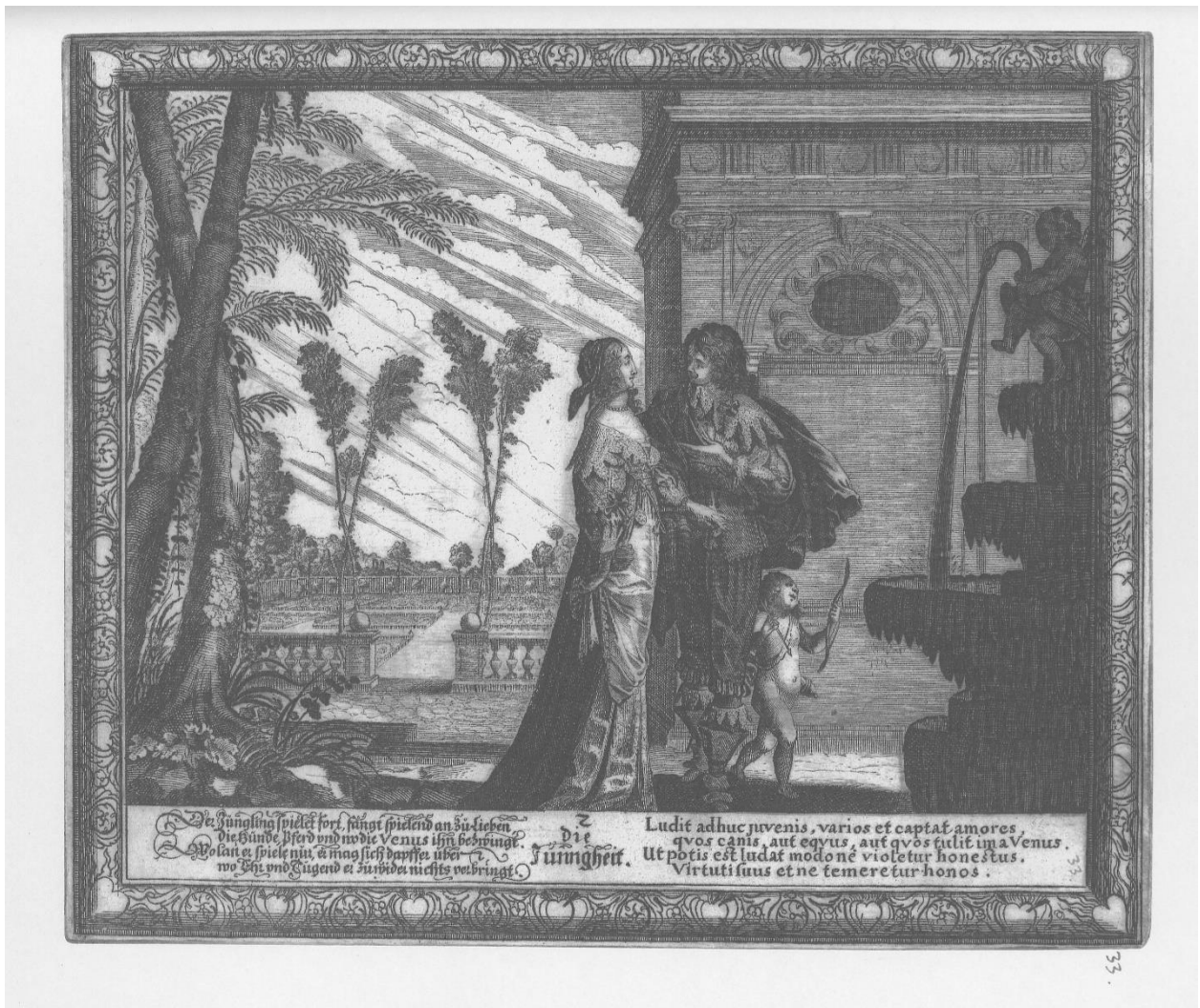
Slika 13. Anonimni autor, Die Jungheit , nakon 1636., Iconotheca Valvasoriana , V. svezak

je šuma. Na margini grafike naveden je naslov Die Jungheit uz redni broj 2. S lijeve strane opet slijedi tekst na njemačkom jeziku: Der Jüngling spielet fort, fängt spielend an zu Lieben, / die Bünde, ßferd und wo die Venus ihn bezivingt. / Wo kan er spiele nur, er mag sich dapffer über, / wo Ehr und gugend er zu wider nichts verbringt. S desne strane ponovno se nalazi latinski tekst: Ludit adhuc juvenis, varios et captat amores, qvos canis, aut qvos tulit ima Venus. / Ut potis est ludat modone violetur honestus. / Virtuti suus etne temere tur honos.