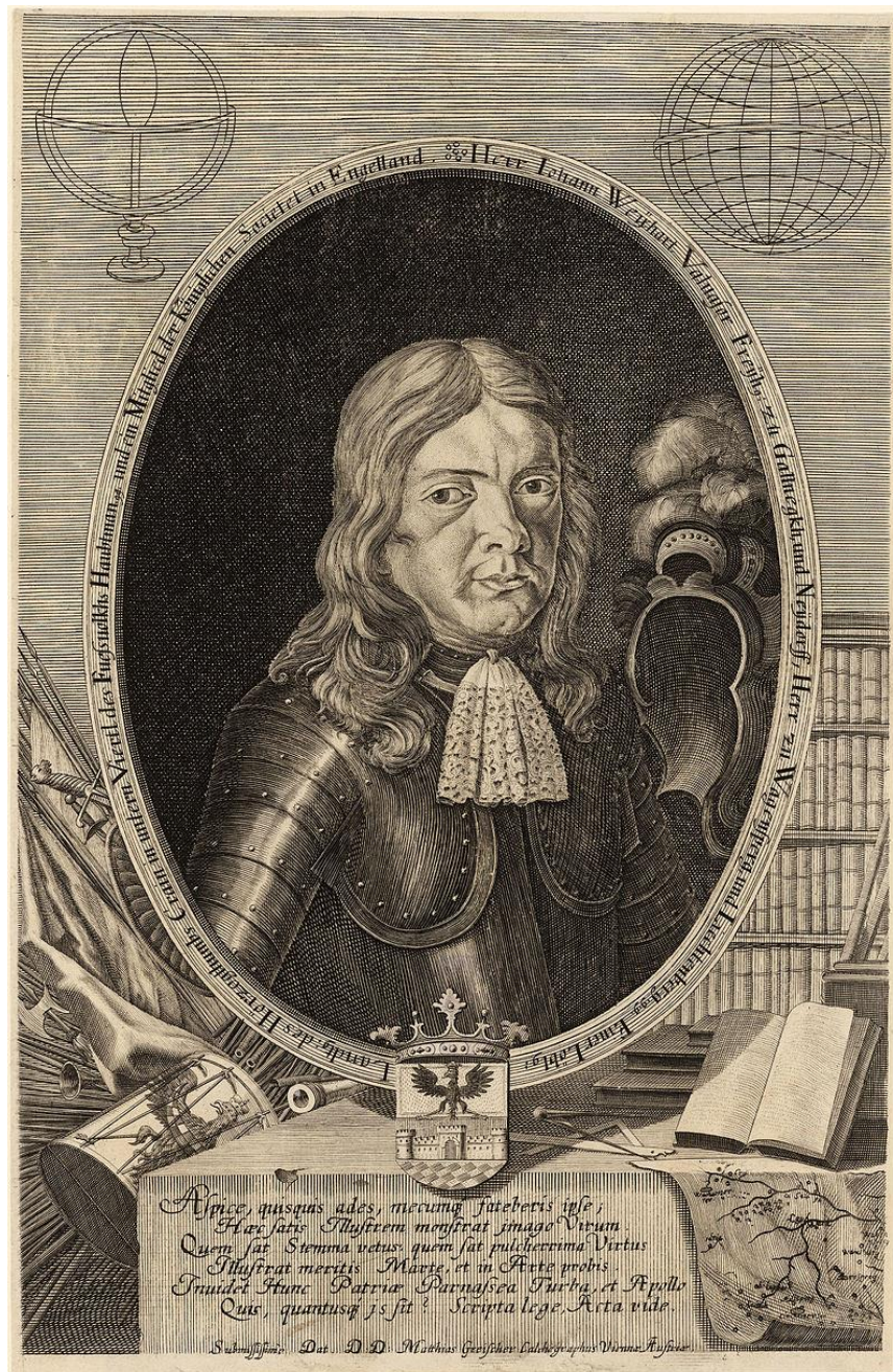
Slika 1. Johann Weichard Valvasor, slovenski plemić i polihistor, autoportret, 1689., bakrorez, 29.8 × 19.3 cm

Johann Weichard Valvasor (Slika 1) bio je slovenski polihistor, historiograf, grafičar, kolekcionar i izdavač. 52 Njegova svestranost rezultat je velikog životnog i znanstvenog iskustva koje je stekao na brojnim putovanjima i kroz poznanstva s intelektualnom elitom XVII. stoljeća.