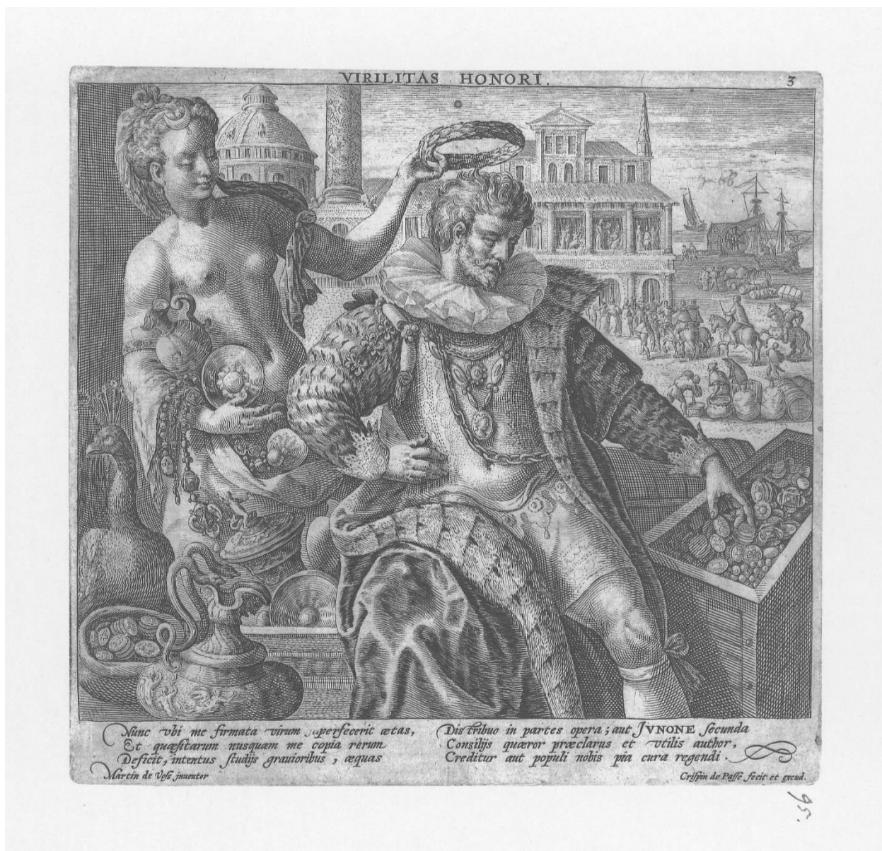
Slika 10. Crispijn de Passe I., Virilitas Honori , 1596., Iconotheca Valvasoriana , V. svezak

I kod grafike Senectus Dolori 109 (Slika 11) kadar reže sjedeće figure u području potkoljenice te obuhvaća širok krajolik iza njih. Središtem kompozicije dominiraju figura starca koji sjedi na stolici i bog smrti i vremena Kronos, tj. Saturn. Prisutnost Saturna ovu grafiku razlikuje od one Raphaela Sadelera, na kojoj se božanstvo nije pojavljivalo. Saturn u desnoj ruci nosi dječaka, a u lijevoj svoj atribut kosu, koja simbolizira smrt. Ovdje se prvi put pojavljuje kompozicija u kompoziciji . I starac i bog Saturn sjetno promatraju sliku koja je smještena na stolić lijevo od starca. Slika prikazuje krilatog kostura s kosom koji se nalazi na skupini mrtvih tijela, a pred njime stoje biskup, kralj i običan čovjek. Simbolika prizora je već dobro znana pouka da su