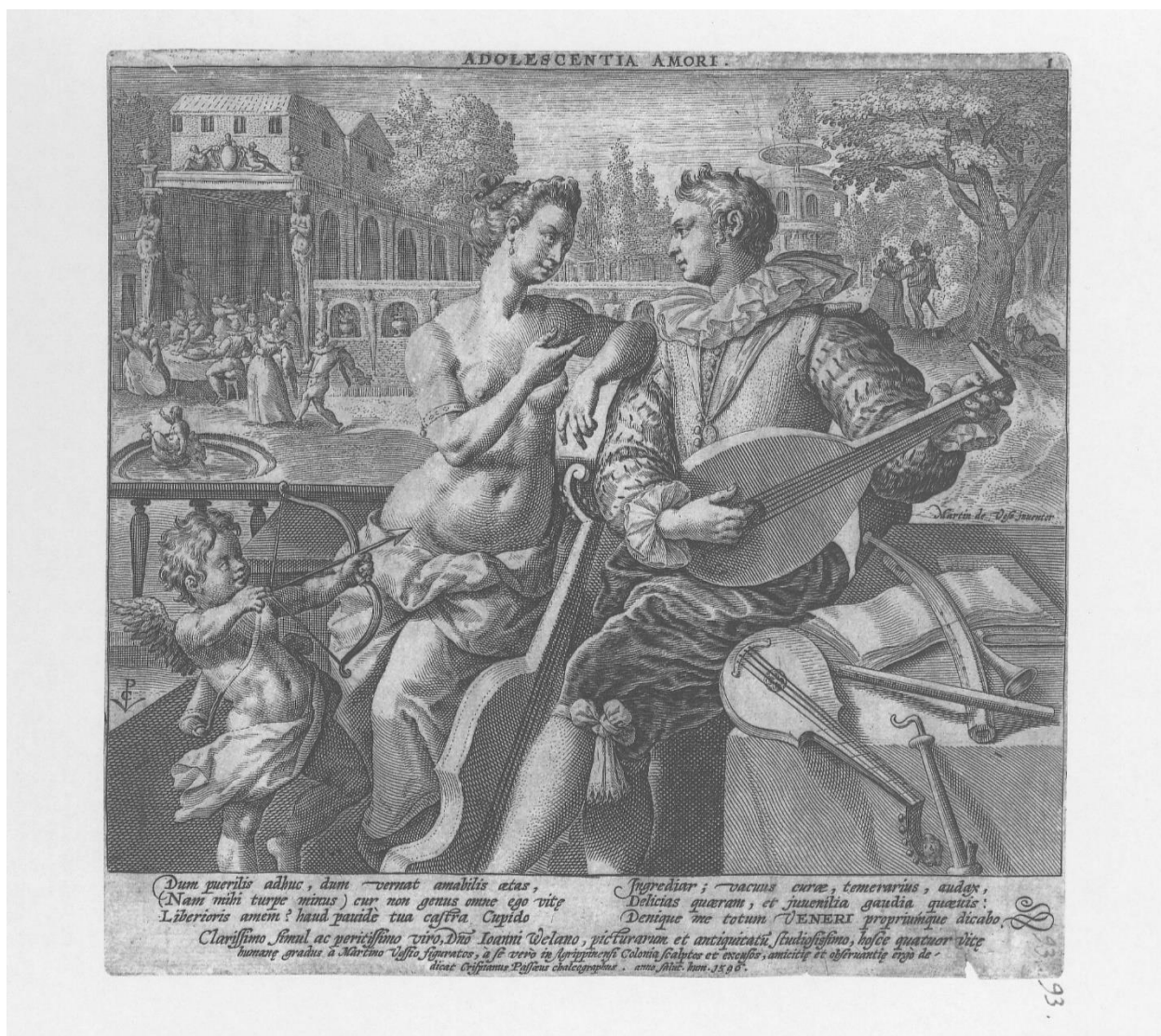
Slika 8. Crispijn de Passe I., Adolescentia Amori , 1596., Iconotheca Valvasoriana , V. svezak

Kod grafike Iuventus Labori 107 (Slika 9) kadar je širok, ali nešto uži nego na prethodnom primjeru. Figure protagonista prikazane su u sjedećem položaju i ne ispunjavaju cijeli kadar, već on reže figuru u području potkoljenice. Glavne figure su mladi muškarac i božica Minerva, opremljena atributima kopljem, štitom i šljemom, a postavljeni su jedan nasuprot drugome sjedeći na klupi. Muškarac promatra boginju dok ona upućuje pogled prema promatraču. Na klupama su položeni predmeti povezani s radom graditelja arhitekta. Prostor ove grafike plići je nego na svim dosadašnjim primjerima. Iza protagonista proteže se samo jedan prostorni pojas. U njemu su prikazane tri kuće i figure kako sudjeluju u njihovoj izgradnji, a drveće iza ima ulogu kulise. Na gornjem rubu ispisane su riječi Iuventus Labori , to jest mladenački rad. Na gornjoj margini s desne strane napisan je broj 2, što označava da je grafika druga u seriji. Na donjoj margini grafike ispisan