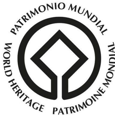
Slika 1. Grb svjetske baštine 1

Na stranicama UNESCO 2 -a o svjetskoj baštini stoji „baština je naše nasljeđe iz prošlosti, ono s čime danas živimo i što prenosimo na buduće generacije. Naša kulturna i prirodna baština istovremeno su nezamjenjivi izvori života i nadahnuća.“ 3 O baštini se govorilo i govori se mnogo. Toliko je širok pojam da je gotovo nemoguće navesti univerzalnu definiciju. Od samih je početaka i pokušaja definiranja vezana uz problematiku definiranja pojmova, ali i uz problematiku onog što ona općenito obuhvaća.