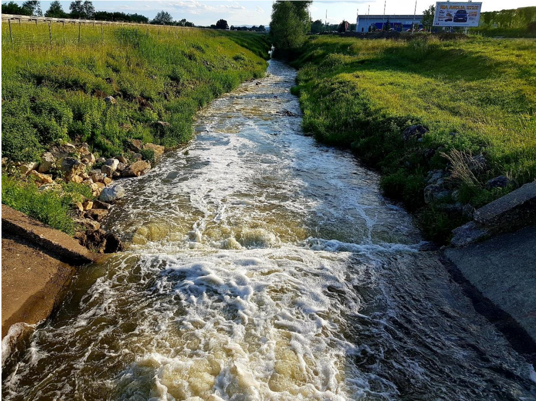
Slika 8. Dolina rijeke Krapinice

Tri opća cilja strategije održivog razvitka Republike Hrvatske su: stabilni gospodarski razvitak, pravedna raspodjela socijalnih mogućnosti te zaštita okoliša. Prilikom planiranja, uređenja nekog prostora ili korištenja prirodnih dobara nužno je osigurati očuvanje značajnih i karakterističnih obilježja krajobraza te održavanje bioloških, geoloških i kulturnih vrijednosti. 98