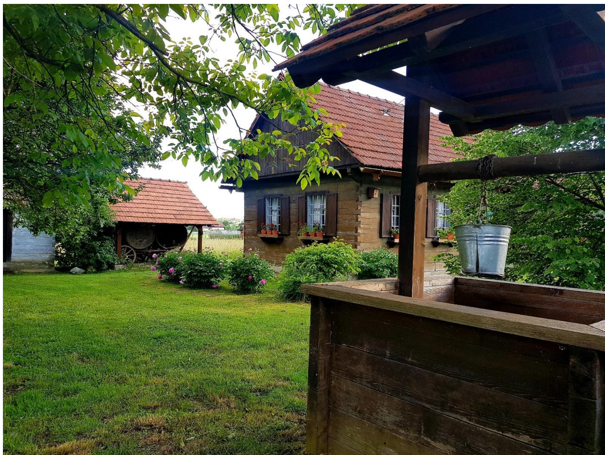
Slika 5. Etnolokalitet Zagorska hiža

Etnolokalitet Zagorska hiža u Dubravi Zabočkoj predstavlja još jedan element kulturne baštine grada. Prepoznata je njezina vrijednost kao kulturno-povijesne tradicije te se ulaže u njezino održavanje.