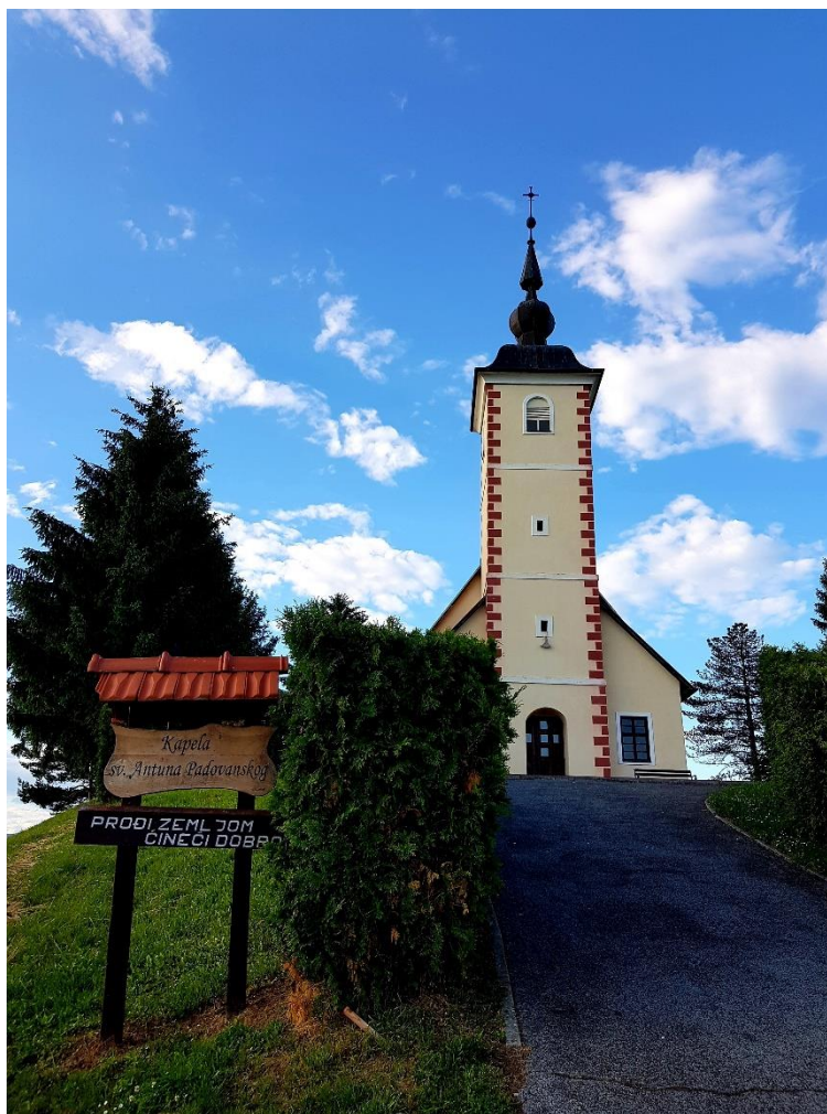
Slika 3. Kapela sv. Antuna Padovanskog

Posebno interesantan dio Strategije je onaj koji govori o zaštićenim kulturnim dobrima. Prostornim planom u skupini Zaštićeni krajolik pod zakonskom su zaštitom dolina Krapinice ispod naselja Grabrovec i ispod kapele Sv. Antuna, s njegovim pripadajućim brežuljkom.