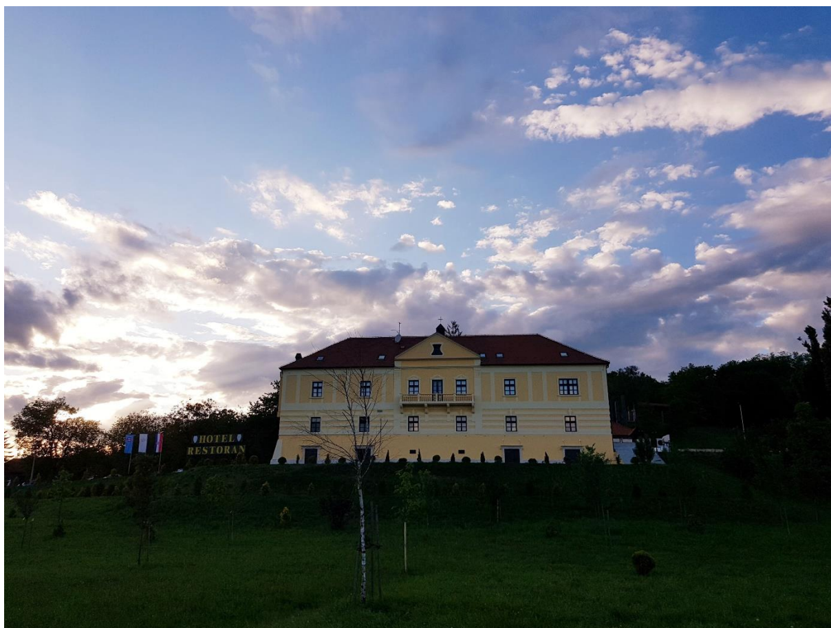
Slika 15. Dvorac Gredice

sastavljan od predstavnika udruga i stručnjaka iz pojedinih područja. Na radnim sastancima Odbora, projekt je proširen s nekoliko potprojekata. I dalje je kao centralni dio projekt Muzej Gjalski , no cjelina je zaokružena s potprojektom Ksaverova staza , radi se o uređenju šetnice od dvorca Gredice, gdje je nekada živio Gjalski, do planinarske kuće Picelj. I kao dodatna dva potprojekta navode se informacijski punktovi kao sustav putokaza i tematskih ploča, te provođenje edukacijskih radionica posvećenih liku i djelu K.Š. Gjalskog, čime bi se dodatno obogatilo sadržaj već postojeće manifestacije Dana Gjalskog .