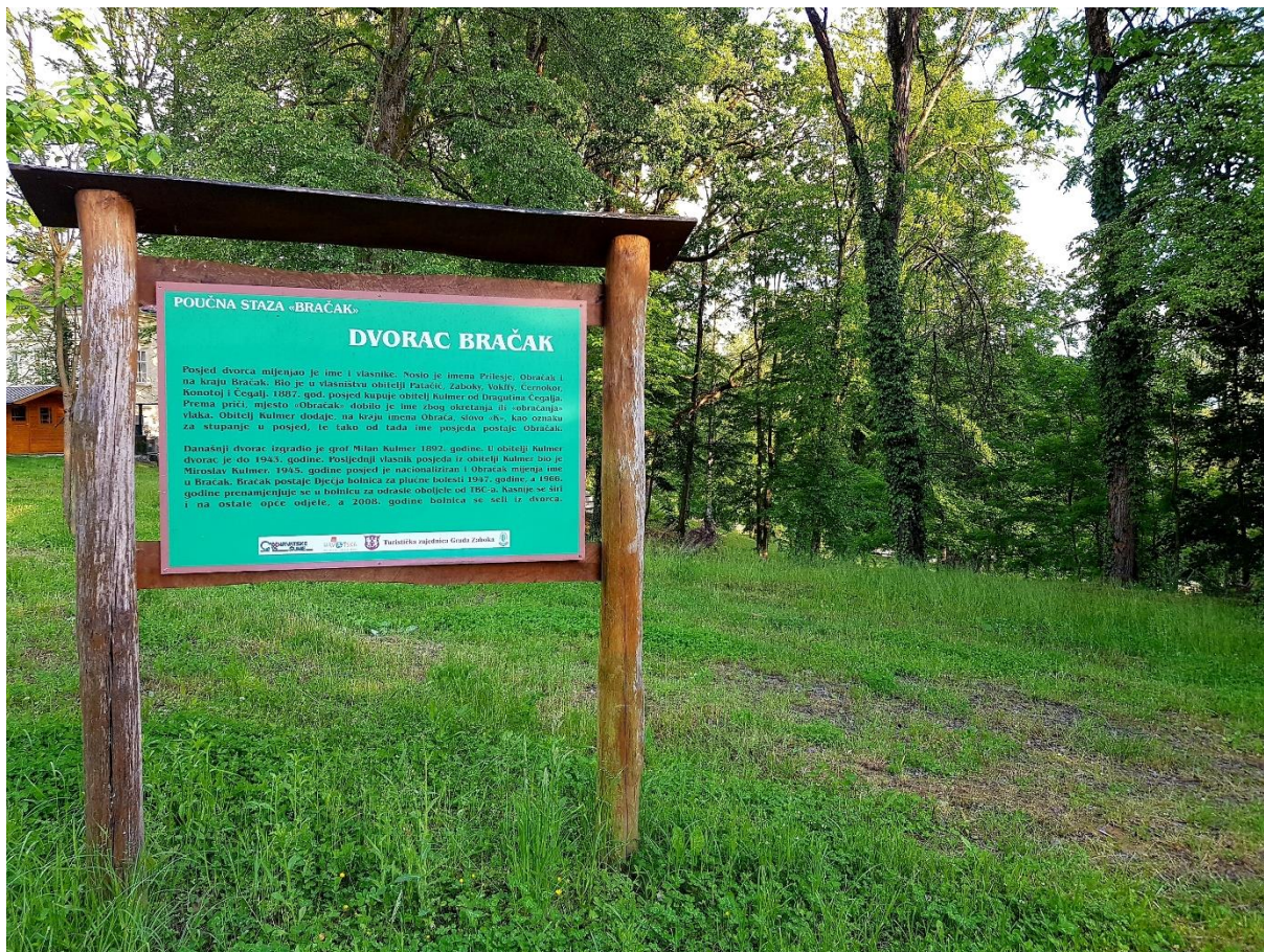
Slika 11. Poučna staza Bračak

U šumi Bračak u neposrednoj blizini kulturno-povijesnog dobra dvorca Bračak te u blizini Opće bolnice Zabok koja predstavlja glavno lječilište čitave regije, 2015. godine otvorena je Poučna staza dužine 700 metara. Radi se o zajedničkom projektu Hrvatskih šuma, Turističke zajednice grada Zaboka i Hrvatskoga šumarskog društva Ogranka Zagreb. Tim se projektom željelo zaštititi prirodu na način da se izradi šetnica