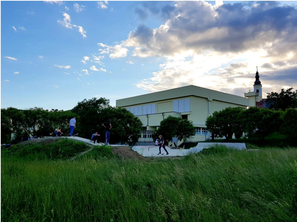
Slika 14. Sportsko igralište Skate park

Skate park nalazi se u blizini Osnovne škole Ksavera Šandora Gjalskog u Zaboku, ukupne površine 302 metra kvadratna, a sastoji se od osam rampi (Big transition x2, speed bump, funbox, rooftop, manual pad, small transition) i vozne površine koja povezuje rampe. Ideja o ovom projektu postoji od 2011. godine, a sam projekt realiziran je 2019. godine. Na inicijativu Dječjeg gradskog vijeća Zabok, ovaj je projekt prijavljen na natječaj LAG-a Zagorje-Sutla , a zadovoljava uvjete Strateškog cilja 3 Lokalne razvojne strategije LAG-a Zagorje – Sutla, Podrška održivom razvoju prostora kao temelj života budućih generacija . 112 S obzirom da je projekt sportskog karaktera, prvenstveno je namijenjen sportašima, ali i svim rekreativcima i ostalom stanovništvu. Cilj ovog projekta je stvaranje novog i adekvatnog prostora za rekreativno i aktivno bavljenje skateboardingom. Svrha je podizanje kvalitete