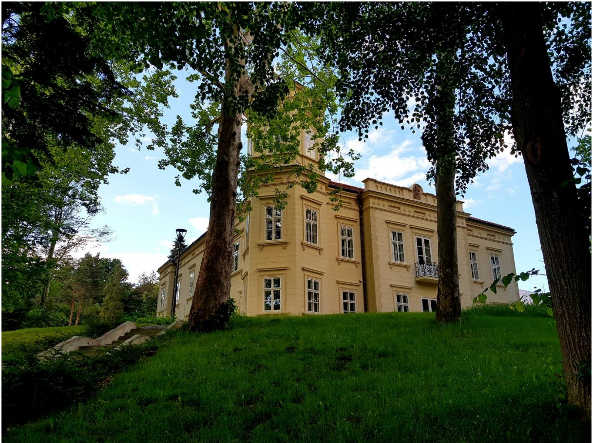
Slika 10. Dvorac Bračak