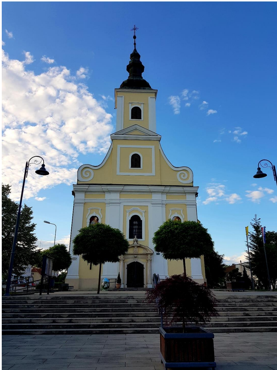
Slika 6. Crkva sv. Jelene Križarice

U Registar kulturnih dobara Republike Hrvatske pri Ministarstvu kulture uvršteni su Crkva sv. Antuna u Grabrovcu, Crkva sv. Jelene Križarice u Zaboku, Dvorac u Bračku te Dvorac Gjalski u naselju Gubaševo.