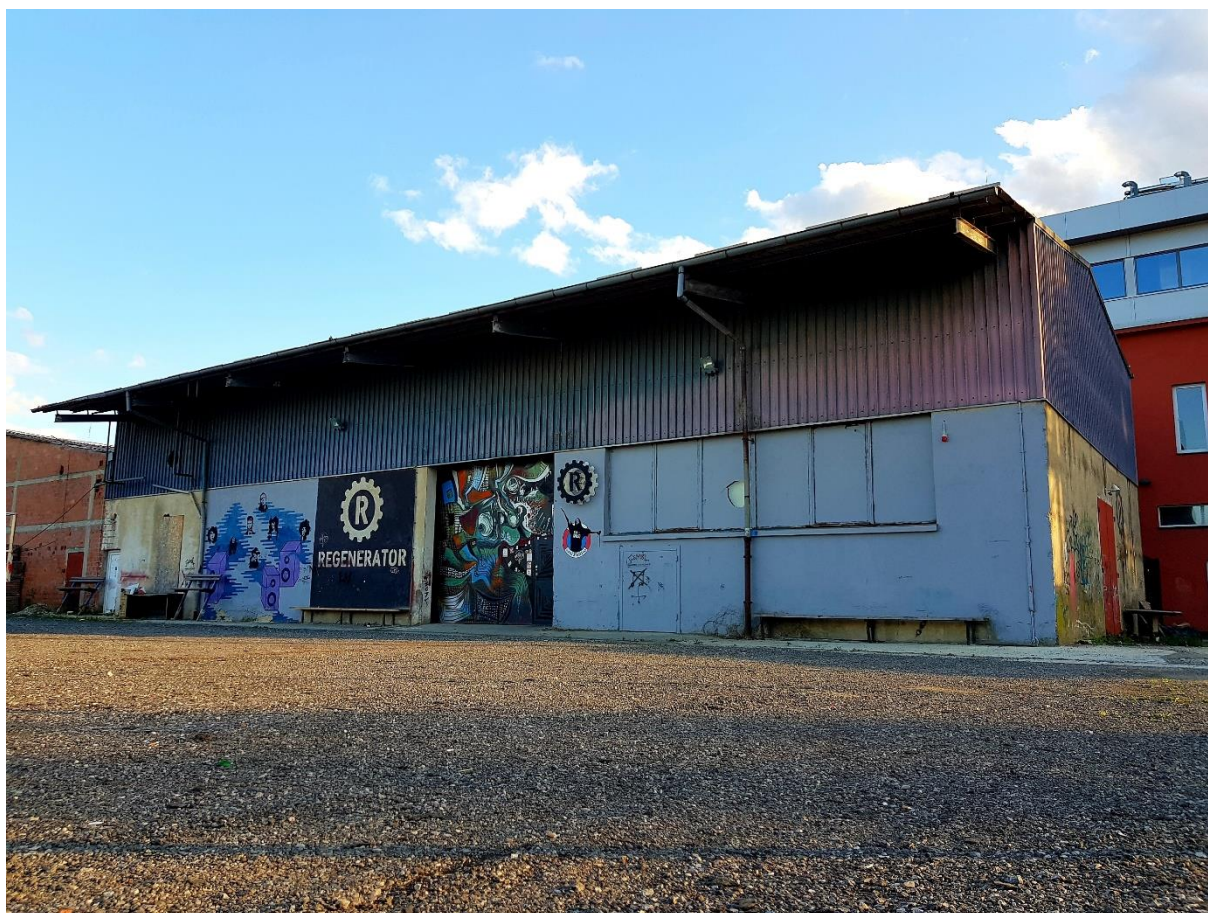
Slika 12. Društveno kulturni centar re-GENERATOR