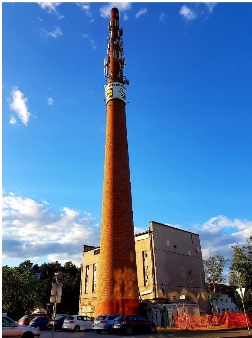
Slika 16. ZIVT – kotlovnica i dimnjak

Današnju jezgru nekadašnjeg industrijskog sklopa, smještenog između pruge i industrijske ceste, čine najstarije očuvani, kotlovnica i dimnjak. Njih okružuju ostale zgrade i radničke kuće. U Odluci o donošenju izmjena i dopuna urbanističkog plana uređenja iz 2017. godine stoji kako „preostali neizgrađeni prostor, nastao rušenjem najstarijih zgrada industrijskog sklopa oko kotlovnice, planiran kao budući trg i novi gradski centar, treba urediti i urbanistički oblikovati na način koji će afirmirati i očuvati duh prostora povijesne zabočke industrije. Dimnjak kao simbol modernog Zaboka poželjno je konzervirati u njegovim izvornim strukturama, a gradnja ugostiteljskog sadržaja na njemu treba biti bez opterećenja s novom konstrukcijom (...) treba predvidjeti mogućnost postavljanja muzejske zbirke i predmeta vezanih uz proizvodni