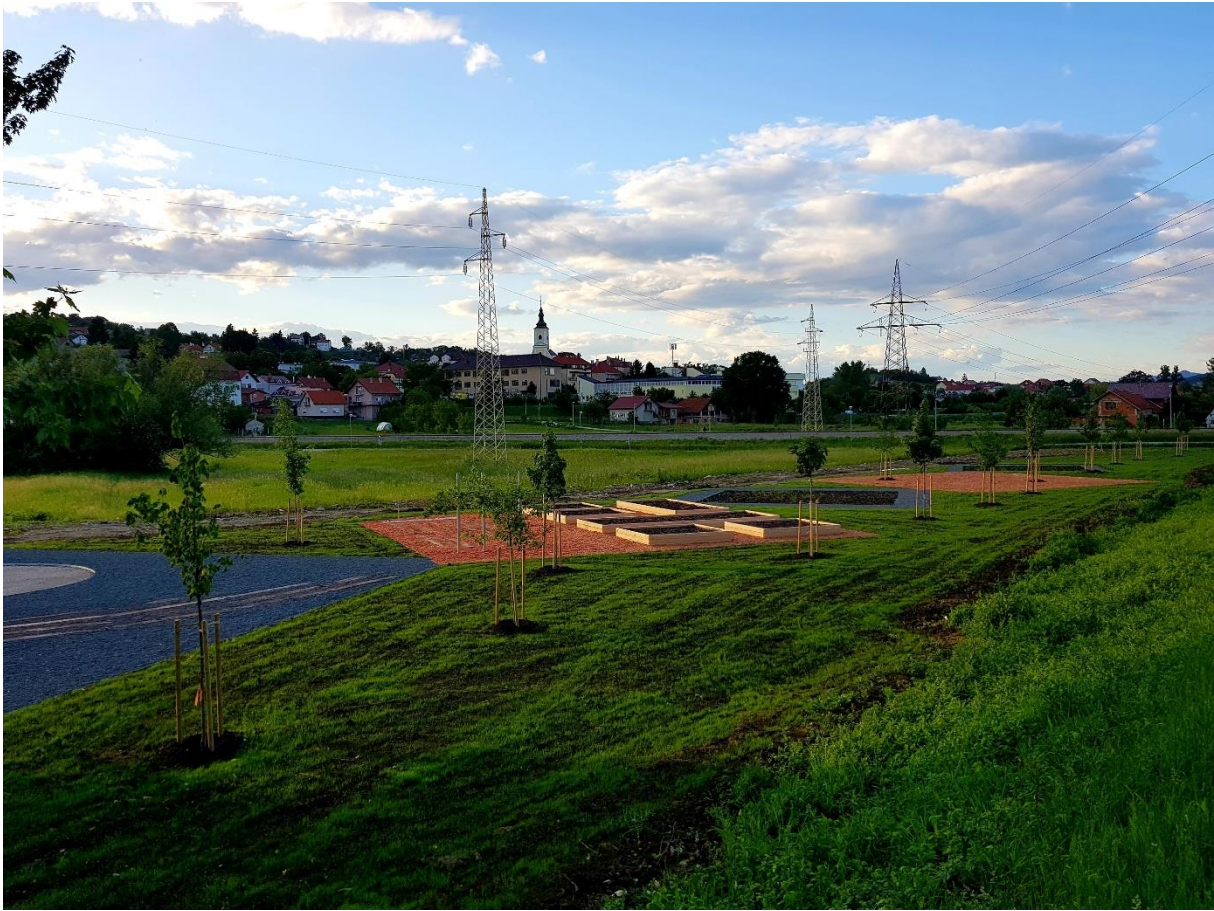
Slika 13. Javni park za pješake – reGarden

Još jedan projekt u fazi izrade, također drugačijeg sadržaja koji će doprinijeti razvoju turizma, javni je park za pješake. Cilj ovog projekta je aktiviranje neaktivnog područja i stvaranje novih, drugačijih sadržaja. Planira se uređenje parternih kvadratnih polja s različitim sadržajima, polje s tribinom i pozornicom, polje za edukativne radionice, polje voćnjaka, polje za sjedenje, polje za sadnju i potencijalna polja za proširenje. Interesantno nam je to što polja predstavljaju svojevrsnu asocijaciju na tepih. Utjecaj je došao iz neposredne blizine, tvornice Regeneracija koja se bavi proizvodnjom tepiha preko 50 godina, po čemu je Zabok bio poznat i izvan granica države. Potencijal leži u spomenutoj poveznici „tepih“. Postoje temelji za razvijanjem dobre priče koja povezuje sadašnjost i povijest, baštinu i održivi razvoj.