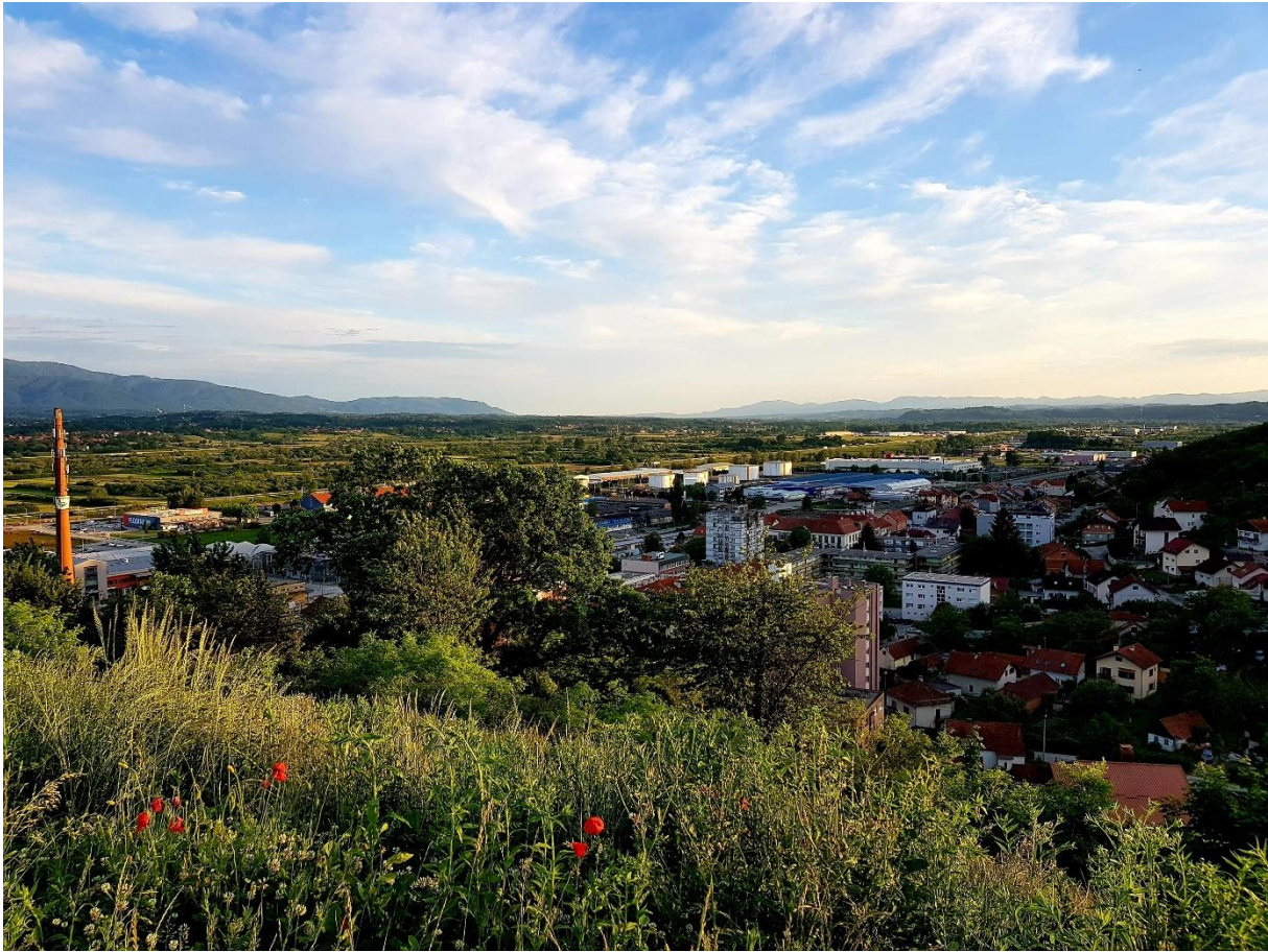
Slika 2. Pogled na Zabok s vidikovca Vodosprema Zabok

Iako „povijest Zaboka nije toliko duga i bogata događajima kao povijest nekih susjednih naselja“ 94 on ima dovoljno baštine i mnoštvo potencijala na čemu se može razvijati kulturni turizam i turistička ponuda, što, naravno, utječe na razvoj cijele regije. Kao neka osnova pristupu izradi strategije postavljanje je pitanja kako zamišljamo svoj grad u budućnosti, koja je naša idealna slika grada te što je to što ga čini drugačijim od drugih gradova? Kako smo već spominjali ranije u tekstu, osnova za izradu i provedbu ciljeva iz Strategije suradnja je između svih dionika uključenih u proces, a ključnu ulogu igra lokalna samouprava te politika koju ona provodi. Prilikom izrade u obzir moraju se uzeti svi raspoloživi resursi, položaj grada, kulturna i socioekonomska situacija u našoj sredini, mora se napraviti detaljna analiza stanja na području grada, a na temelju toga postavljati ciljeve.