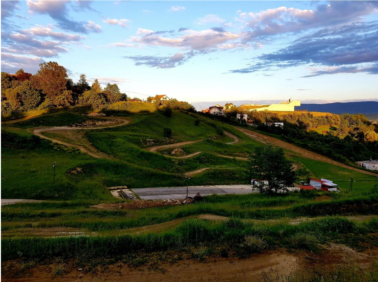
Slika 7. Motocross staza, Vučak

U Strategiji se navodi kako Zabok nema klasičnih turističkih sadržaja, no ima vinske ceste, planinarski dom sa arboretumom, lovačke domove, moto-cross stazu koja je izgrađena još davne 1961. godine i čija je posebnost u činjenici da je jedina na svijetu na kojoj se s jedne točke vidi cijela staza. S obzirom na to kako Grad nema klasični turistički sadržaj, veliki potencijal leži u kulturi i kulturnom sadržaju.