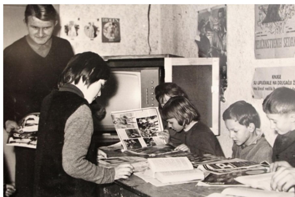
Slika 3. Prostor Osnovne škole u Pleternici