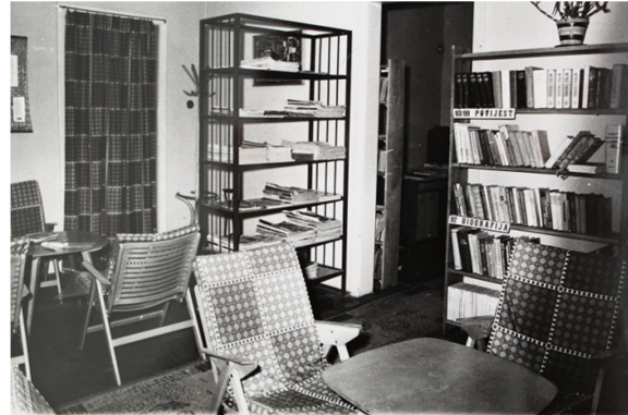
Slika 6. Prostor knjižnice u Mjesnom uredu