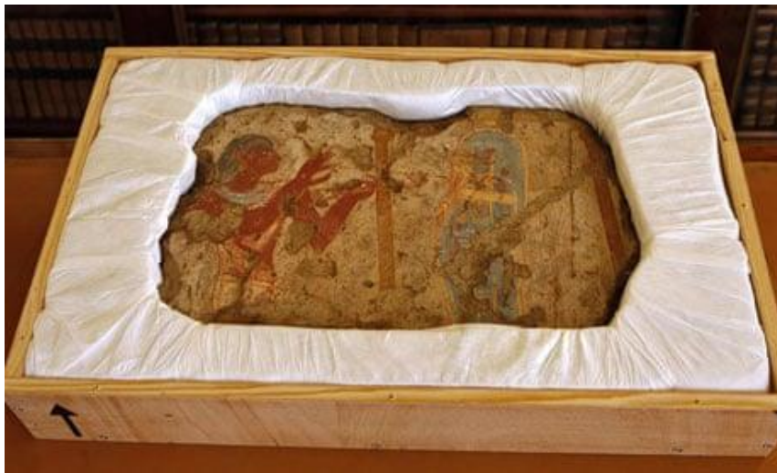
Slika 4: Jedan od fragmenata oslikanog zida kojeg je Louvre vratio Egiptu

Pod kritikama se našao i Louvre muzej nakon što je otkriveno da su fragmenti oslikanog zida iz egipatske grobnice koje je Muzej nabavio 2000. i 2003. godine zapravo ukradeni 1980. godine. Prema izjavama tadašnjeg francuskog ministra kulture Frédéric Mitterranda, sumnja u podrijetlo predmeta se javila tek 2008. godine kad su arheolozi ponovno istražili grobnicu iz koje su navedeni fragmenti ukradeni što je dovelo do pitanja zašto istraga o podrijetlu predmeta nije ranije obavljena. Odlučeno je kako će fragmenti biti vraćeni Egiptu, ali ovaj je događaj ipak naveo Egipatski odjel za antikvitete da zabrani bilo kakva arheološka istraživanja Louvreu na terenu Egipta. 67 Na stranicama Muzeja inače nije moguće naći njihovu politiku sabiranja.