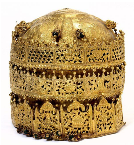
Slika 3: Kraljevska kruna, najvjerojatnije izrađena u Gondoru, Etiopiji

Još jedan primjer iz Velike Britanije je i skupina predmeta iz Etiopije koje je britanska vojska uzela 1868. godine za vrijeme Abesinkse ekspedicije, odnosno tijekom bitke Maqdala u kojoj je cilj bio osloboditi britanske vojnike koji su bili zarobljeni od strane etiopijskog vladara Tewodrosa II koji je tijekom napada počinio samoubojstvo. Britanska je vojska, oslobodivši zarobljenike, uzela mnoge vrijedne predmete koji su raspoređeni po mnogim britanskim muzejima, a najvredniji su završili u Victoria and Albert muzeju među kojima se posebno izdvaja kruna (Slika 3) koja je najvjerojatnije izrađena u Gondaru i dana kao dar etiopijskoj pravoslavnoj crkvi. 64 Victoria and Albert muzej je na svojem blogu objavio cijeli članak vezan uz povijest tih predmeta i njihovu nabavu naglašivši kako su svjesni činjenice da su predmeti stigli u Veliku Britaniju i muzeje na izrazito kontroverzan način. 65 Etiopija je još 2007. godine podnijela zahtjev za vraćanjem predmeta koji su ukradeni tijekom bitke Maqdala, a nalaze se u britanskim muzejima, a ravnatelj Victoria and Albert muzeja je kao najbolje moguće rješenje za to predložio dugoročnu posudbu. Danas se predmeti i dalje nalaze u V&A muzeju. 66