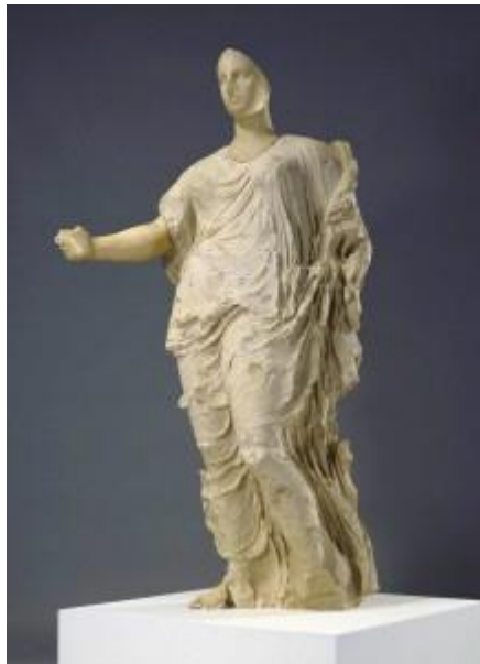
Slika 5: Cult Statue of a Goddess, Morgantina Venus ili Getty Aphrodita

Metropolitan muzej u razdoblju između 1966. godine i 1970. u tri navrata je nabavio tzv. Lydian Hoard , vrijedne predmete iz grobnica sela Güre, nekadašnjeg teritorija Lidije, a danas dijela Turske. Godine 1984. dio je tih predmeta stavio u stalni postav, ali s netočnim informacijama, kako bi se, pretpostavlja se, pokušalo prikriti nezakonito podrijetlo. No, istragom se nakon nekog vremena ustvrdilo da je dio muzejskog osoblja Metropolitan muzeja znao pravo podrijetlo predmeta. Muzej je ubrzo od turskih vlasti, koje su utvrdile da se radi o grupi predmeta koja je ilegalno iskopana od strane lovaca na blago i izvezena iz države protivno njezinim zakonima, dobio zahtjev za povratom predmeta. Zahtjev je Metropolitan muzej odbio, nakon čega je Turska pokrenula tužbu koja je povučena tek šest godina kasnije, odnosno 1993. godine nakon što je Metropolitan muzej napokon odlučio vratiti predmete. Danas se ti predmeti nalaze u Uşak muzeju u istoimenom turskom gradu. 72