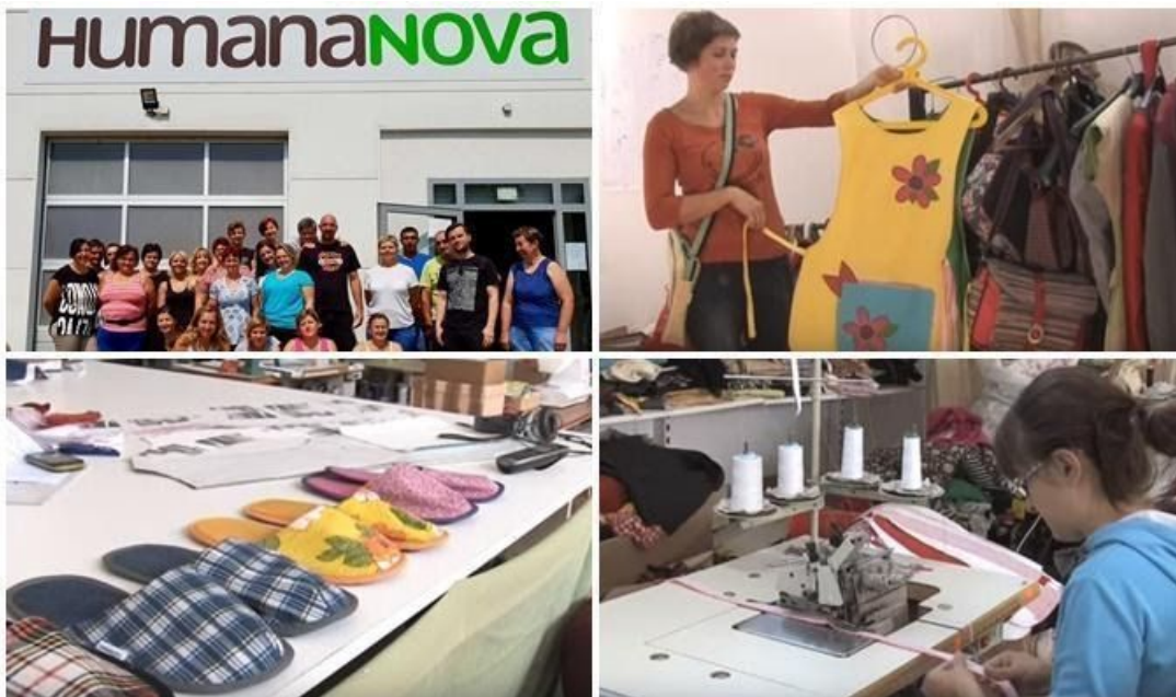
Slika 12. Proizvodni pogon i dućan Humane nove u Čakovcu

problem se javlja to što često uopće ne dobivaju priliku za zaposlenje, a socijalna pomoć je često nedostatna za dostojanstven život. Drugi je problem uključivanja u sam proces rada koji iziskuje određeno utrošeno vrijeme. Za njih to može predstavljati sustav bez ikakve perspektive. Stoga je fokus zadruge na radnoj integraciji – uključivanje marginaliziranih skupina u radni odnos. Danas zadruga broji 19 zaposlenih osoba s invaliditetom od ukupno 28 zaposlenih. Humana Nova je sama opstala na tržištu, uz to da zadrugom upravljaju njezini zaposlenici. Dakle, zaposlenici su ti koji su ujedno i vlasnici. Što to znači? S obzirom na to da Zadruga nije u sustavu oporezivanja, oni ne dobivaju dividende i isplate, ali ključan je motivacijski faktor. Zaposlenici rade za sebe i svoje kolegice/kolege. Svatko tko se zaposli u zadrugi ima priliku postati suvlasnik zadruge (postoje određeni uvjeti: probni rad, trud, vidljiv napredak). Sam ulazak u suvlasništvo započinje plaćanjem članskog upisa u iznosu od 2000 kuna, što ostaje novac člana, ukoliko i nakon što odluči napustiti zadrugu. Time ravnopravni član ima pravo glasa u upravljanju zadrugom. Upravitelj zadruge opisuje kako takav sustav djeluje na članove zadruge: "Ono što mi je najdraže danas vidjeti je to da ljudi koji te na početku nisu ni mogli pogledati u oči, prozboriti koju riječ, bez samopouzdanja, danas su ravnopravni članovi naše zadruge". (Ivan Božić, 27. 12. 2018.)