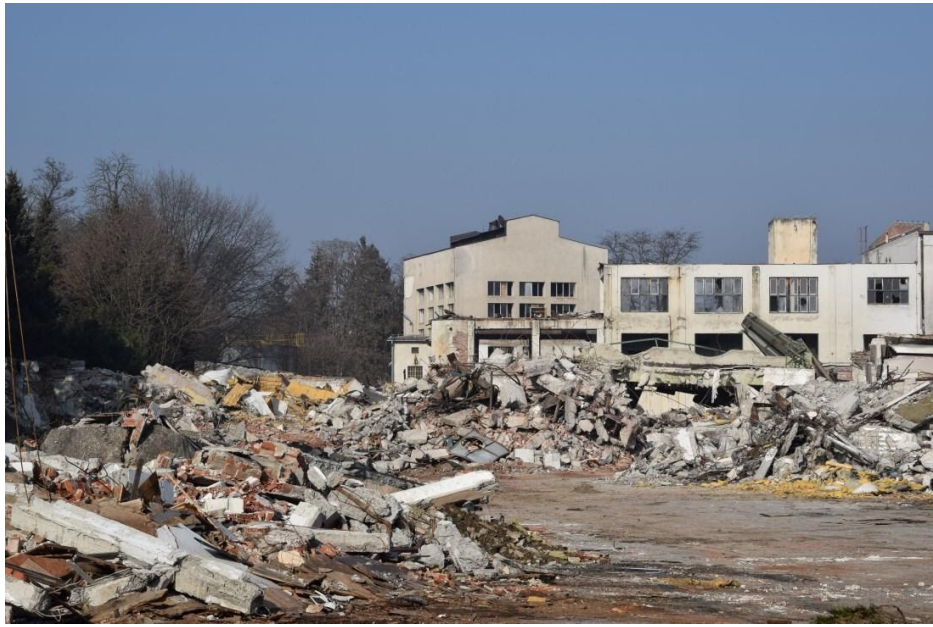
Slika 3. Ruševine stare tvornice u centru grada Čakovca. 2017.

https://medjimurje.hr/aktualno/politika/moze-li-se-nekad-slavna-tvornica-mtc-ponovo-podici-iz-pepela-27923/