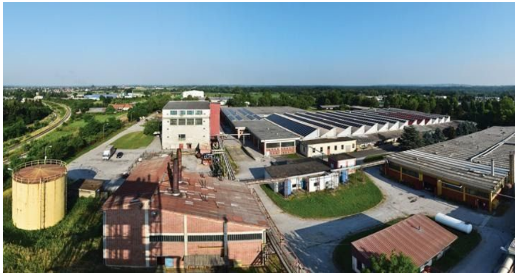
Slika 4. Proizvodni kompleks Čateks -a u Čakovcu

nosila ime Samuel Neumann i nasljednici (Ibid). Proizvodnja je velikim dijelom prestala tijekom rata. (Ibid. 32) Godine 1944. vlasnici su odvedeni u logore, a tvornicom je počeo upravljati Desze 24 , porijeklom Mađar, pod kojim su radnici bili u vrlo teškom položaju. (Ibid) Odmah po završetku Drugog svjetskog rata tvornica je stavljena pod državnu upravu te se 1948. godina spojila s Tkaonicom mariborske tekstilne tvornice Varaždin i čakovečkom Prvom međimurskom tkaonicom Josipa Brumera te je time utemeljena Međimurska tkaonica Čakovec koja je iste godine preimenovana u Čateks – čakovečka tekstilna industrija. 25 Zbog zastarjelih i dotrajalih proizvodnih pogona, godine 1954. godine izgrađena je nova tvornica na današnjoj lokaciji 26 , gdje Čateks radi u restrukturiranom i umanjenom obimu do danas.