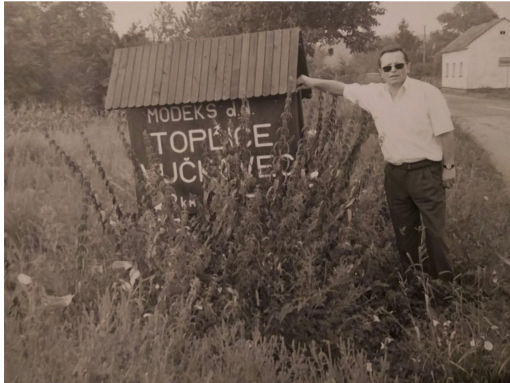
Slika 8. Simbol neuspješnog Modeks -ovog projekta kupnje Toplica Vučkovec, 1997. godine