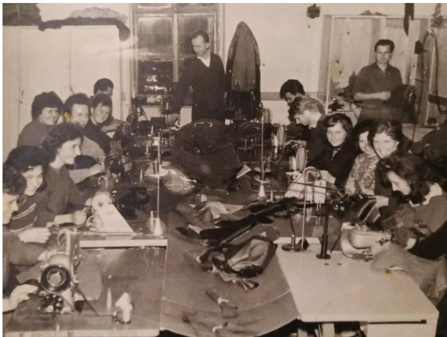
Slika 5. Prve šivaće mašine na električni pogon, Mursko Središće, 1963. godine, privatna fotografija (Stjepan Mesarić)

svoje male privatne krojačke radnje, spojili u zadrugu. Otišli su u obližnje veće selo (danas grad) Mursko Središće koje je tada brojilo oko 600 stanovnika. Iako tadašnja država (SFR Jugoslavija) nije osobito podržavala privatne obrtnike, Gornje Međimurje 27 je imalo brojne obrtnike raznih zanimanja, a među njima i krojače (Ibid). Zadruga je bila smještena u Vatrogasnom domu, da bi potom iznajmili prostor u centru sela. Trojica osnivača iz svojih su bivših obrta u novu zadrugu donijeli potrebne strojeve, kako to navodi Mesarić “...singerice na nožni pogon i pegle na žerjavku” (Stjepan Mesarić, 28. 10. 2019.). Zadruga je kao prvi veći posao obavljala šivanje i popravljanje radne odjeće rudarima Međimurskih ugljenokopa Mursko Središće . Šivali su i muška odijela, kapute, hlače, sakoe, ženske kostime i suknje. Sistem rada je u početku bio takav da je svaki šnajder radio komad odjeće od početka do kraja, što se promijenilo s porastom narudžbi te su se podijelili u grupe (posebno džepovi, posebno rukavi,...). Postupno se uvode šivaći strojevi na električni pogon, a množe se i prostorije, te uskoro cijela građevina postaje šnajderaj , a podrum postaje skladište. Obrtnička zadruga dobila je ime Krojačka zadruga Mursko Središće .