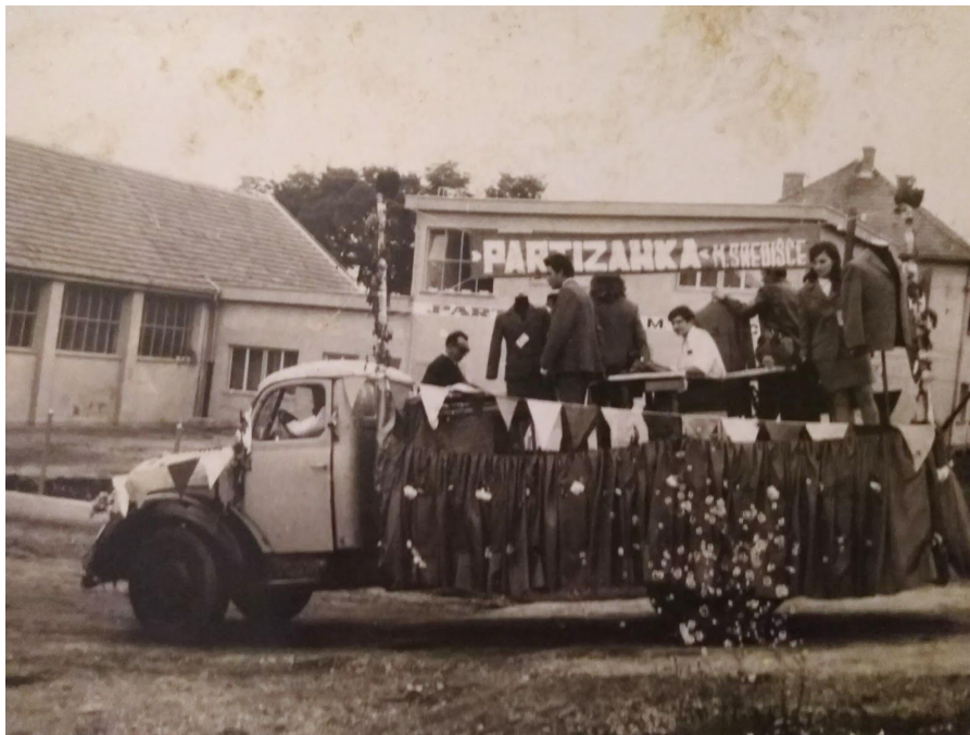
Slika 11. Sudjelovanje u povorci ulicama Murskog Središća (Berba grožđa), 1971. godine

A recimo već mi Modeksove imamo za 8. mart saki put zabavu. Samo Modeksove . Ja sam lani ne bila, ali bila sam predlani i bilo je puno se. Se puno! Jer mi imamo nekaj ka nas skupa drži. Stvarno imamo lepa prijateljstva. Se žene oču iti. Ka se vide, ka se spominaju malo de je ko, kak je i tak. Ka se zmislimo kak nam je lepo bilo, a ovo kaj nam je hudo bilo to očemo pozabiti. Znaš kak veliju: bole je pamtiti lepo, a hudo pozabiti pa onda moremo dale. (Latica, 2. 10. 2019.)