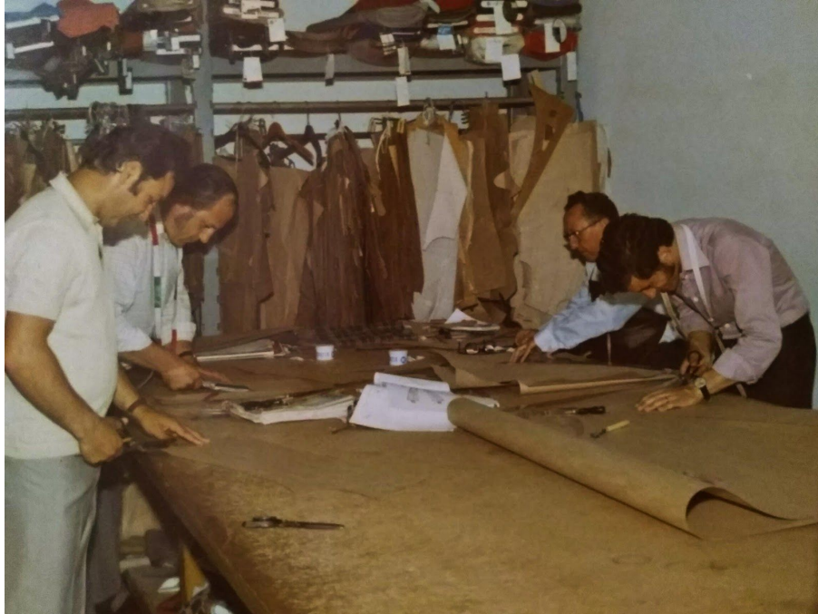
Slika 6. Početak izrade krojnih slika (prvi puta se kroj ne nanosi direktno na tkaninu), Mursko Središće, 1971. godine

Osnivanje Krojačke zadruge Mursko Središće , promijenilo je svakodnevnicu tog područja. Stanovnici su počeli napuštati bavljenje poljoprivrednom djelatnošću i sve su više tražili formalno zaposlenje za plaću, zbog čega su morali putovati u gradove ili se ondje trajno preseliti. Potražnja za zaposlenjem je rasla, tim više što su i žene u velikoj mjeri počele raditi u tvornicama (usp. Rubić 2017:134) te ih se za te poslove i dodatno pripremalo i educiralo. Tadašnja politika posebno je poticala zapošljavanje žena jer se smatralo kako je to dokaz modernizacije, posebno kad se radi o ruralnim područjima. (Bonfiglioli 2014:130, prema Vodopivec) Kako opisuje jedan od sugovornika: “u prostorijama Stare škole u Murskom Središću, u suradnji s Tekstilnom školom Varaždin , održavali su se tečajevi za osposobljavanje mladih ljudi, uglavnom za poslove šivanja, glačanja, servisera i slično.” Osim u sjedištu zadruge, ljudi su radili i od kuće - to nije bio uobičajeni način radnog odnosa, ali je doprinosa povećanju novčanih prihoda za brojna kućanstva: “I ja tada dolazim preko svojeg oca Ivana u vezu s poslom jer sam kod kuće rubio stolnjake i slično. I mnogi drugi su radili kod kuće i onda gotove proizvode donosili u sjedište zadruge.” (Stjepan Mesarić, 28. 10. 2019.)