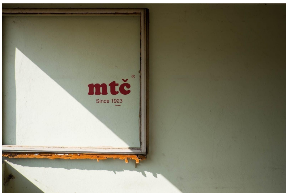
Slika 2. Istaknuti logo na zidu u jednom od nekadašnjih ureda tvornice u Čakovcu, 2019.

Krajem šezdesetih godina 20. stoljeća dolazi do ozbiljnijih financijskih problema za tvrtku. Djelomična modernizacija MTČ-a proizašla je iz radničkog sindikata, što je privremeno omogućilo tvornici da preživi krizne godine na zalasku socijalističke Jugoslavije u osamdesetim godinama 20. stoljeća. 20 Sredinom devedesetih godina 20. stoljeća, u samostalnoj Republici Hrvatskoj, tvrtka je privatizirana i podijeljena na nekoliko manjih dioničkih društava: MTČ Tvornica rublja d.d. (Čakovec), MTČ Tvornica čarapa d.d. (Čakovec), MTČ Tvornica dječje trikotaže d.d. (Prelog) i MTČ Tvornica trikotaže d.d. (Štrigova). 21 Tvornice i poduzeća su u narednim godinama bile poznate u javnosti po brojnim aferama. 22 Godine 2009. tvrtka je otišla u stečaj, da bi 2014. godine Županijsko državno odvjetništvo podiglo optužnicu protiv četvero osoba osumnjičenih za zlouporabu položaja u gospodarskom poslovanju. 23