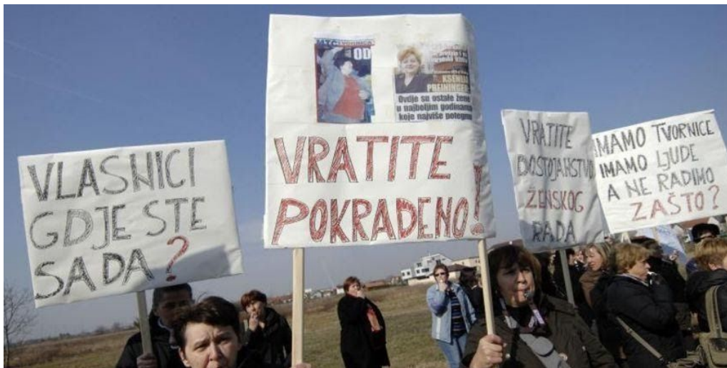
Slika 10. Prosvjed radnica zbog malverzacija u MTČ-u, 2009. godine, ispred tvornice https://rtl-static.cdn.sysbee.net/image/pxl1203086132014062313250389390-06f3fc8838fb4b39d4ed4d2741acfa85_view_article_new.jpg?v=20