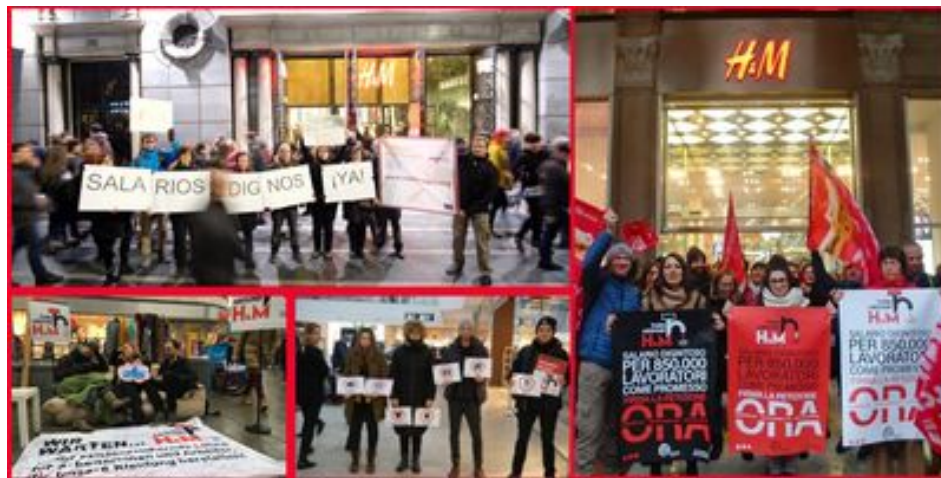
Slika 13. Ulični prosvjedi u sklopu globalne akcije #TurnAroundnHM na nekoliko lokacija diljem svijeta (Austrija, Belgija, Kambodža, Hrvatska, Indija, Hong Kong i dr.) protiv radnih uvjeta u proizvodnim pogonima H&M-a, 2019. godine

fokus udruženja radnici u tekstilnoj industriji, udruga redovito surađuje s drugim udruženjima koja se bave sličnim pitanjima, a s kojima ima i šire zajedničke ciljeve poput općenite redukcije siromaštva, zaštita prava svih posebno ugroženih skupina (žene, djeca, bolesni, stariji itd.).