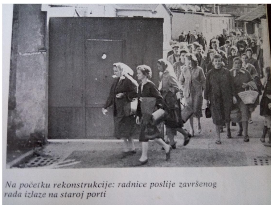
Fotografija „rijeka“ žena, radnica, nakon završenog rada

“Zbog opće politike neinvestiranja u granične krajeve, kao i zbog neadekvatnog odnosa društva prema tekstilnoj industriji općenito - koja je, usput rečeno, na svojim leđima ponijela najveće breme poslijeratne izgradnje, industrijalizacije i elektrifikacije zemlje - u razdoblju od 1946. do 1956. godine nije bilo gotovo nikakvih investicijskih ulaganja u rekonstrukciju i modernizaciju ove tvornice” 19