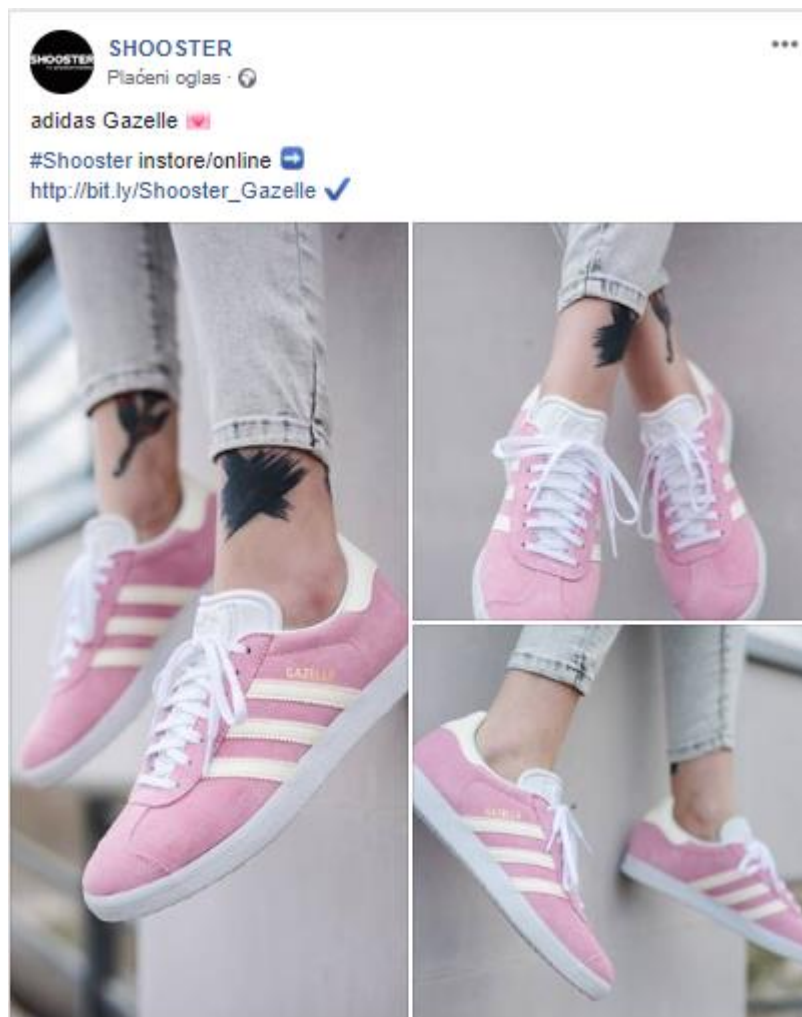
Slika 3: Primjer plaćenog oglasa tvrtke Shooster

uvijek bitnija od kvantitete jer su ljudi zbog velike količine oglasa postali isključivi te lako prepoznaju standardne izraze koje oglasi koriste.