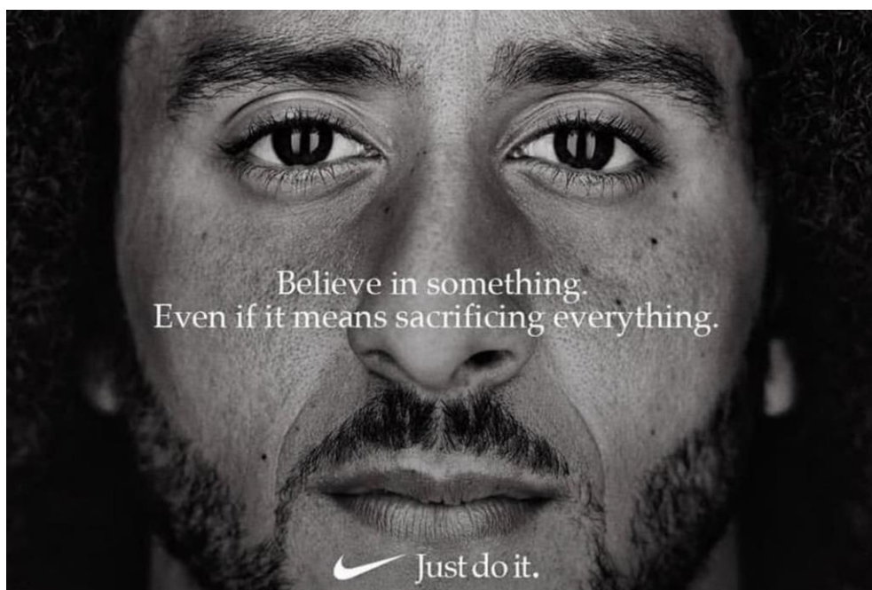
Slika 1: Oglas kampanje „Just Do It“ tvrtke Nike

Kritičari su sumnjali u mogućnost uspjeha cijele kampanje te su smatrali da je Nike žrtvovao potencijalno dobru kampanju kako bi podigao svijest o socijalnoj nepravdi u SAD-u. Privremeno je tako i izgledalo. Velik je broj ljudi na društvenim mrežama kao što su Facebook i YouTube dijelio videozapise na kojima, iz protesta, pale Nike proizvode ili izrezuju Nikeov logotip iz odjeće te su na Twitteru pozivali na bojkotiranje Nikea korištenjem hashtagova kao što su #NikeBoycott i #JustDont (Everett, 2018). Ali nakon analize učestalosti pojavljivanja spomenutih hashtagova koji pozivaju na bojkot primijećeno je kako javnost ne osjeća negativan stav prema Nikeu. Analitičari su tvrdili kako nema razloga za zabrinutost, a ta se situacija uspoređivala s nedavnim bojkotima tvrtke Starbucks (Bary, 2018).