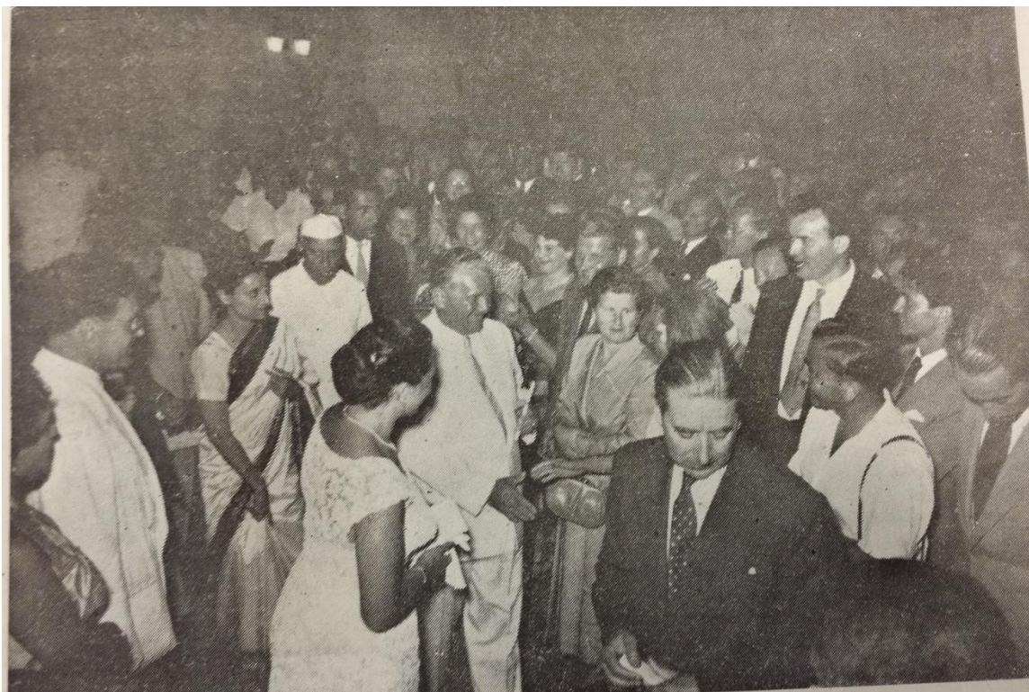
Sl. 2. Poslije premijere Baranovićeve „Licitarskog srca“. Tito, Jovanka, Indira Gandhi i Nehru u društvu dubrovačkih političara i kulturnih radnika.