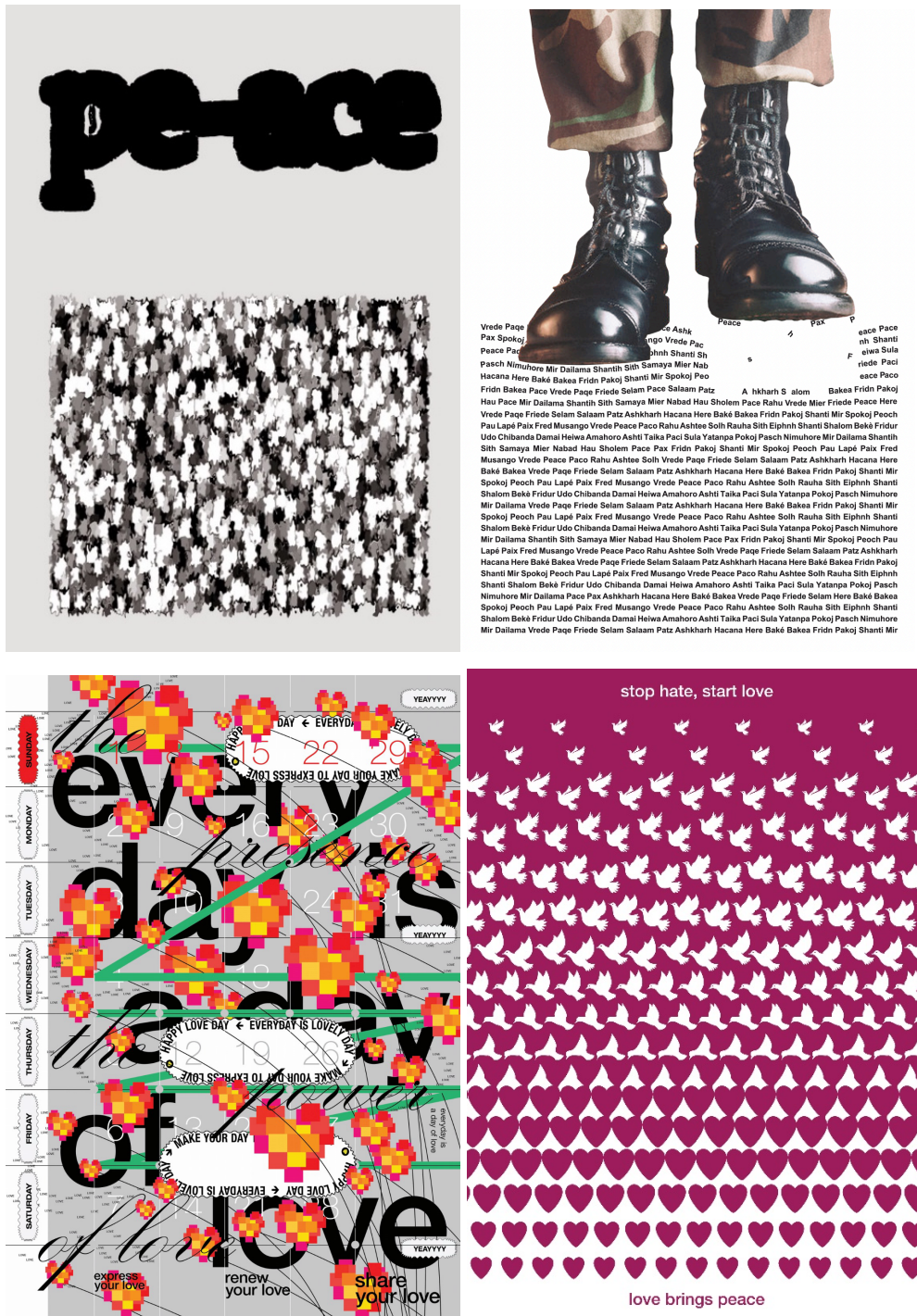
Slika 2. Posteri izložbe koji su prošli selekciju umjetnika Rochallyi (lijevo gore), Marcolla (desno gore), Noordyanto (lijevo dolje) i Noordyanto (desno dolje).

Iračkog rata. U posljednjim godinama u Beču se najviše protestira protiv klimatskih promjena. S tim mirovnim pokretima ideja pozitivnog mira se održala kao glavni dio izložbe te time ostalo strogo u granicama smisla muzeja.