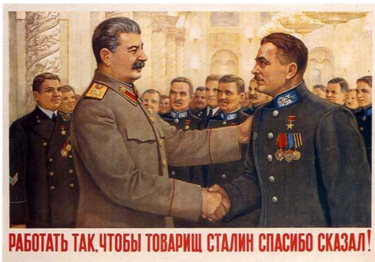
Рис. 6 Работать так, чтобы товарищ Сталин спасибо сказал! Правдин, В.Г (1949)

обстоит дело с данным плакатом; вместо «чтобы товарищ Сталин сказал спасибо» написано «чтобы товарищ Сталин спасибо сказал». Этот прием делает предложение более заметным и запоминающимся, что считается важным фактором в контексте политической пропаганды. Если порядок слов в предложении нестандартен, есть вероятность, что он «уловит» мысли наблюдателя в течение длительного периода времени.