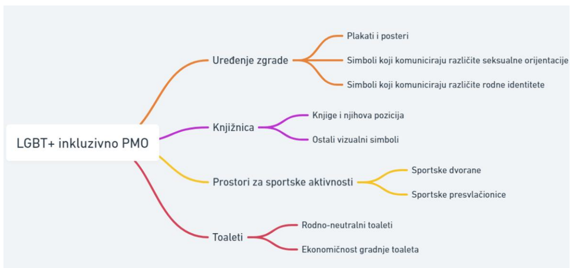
Slika 1. Shema indikatora LGBT+ inkluzivnoga prostorno-materijalnoga okruženja odgojno-obrazovne ustanove

2020; Rübner Jørgensen i Allan, 2022) te studija koju je provela dizajnerska kuća A&DS 6 (2019) tek se granično osvrću na funkciju obrazovnoga prostora, no navedeni autori ne opisuju konkretno indikatore LGBT+ inkluzivnoga prostorno-materijalnoga okruženja odgojno-obrazovne ustanove. Kao važan element prostorno-materijalnog okruženja proučavanjem gore navedenih izvora i literature u ovome radu izdvojio sam četiri osnovna indikatora PMO: uređenje zgrade, knjižnica, prostori za sportske aktivnosti i toaleti. Dodatno na navedene elemente, svaki indikator PMO će u nastavku biti pobliže opisan.