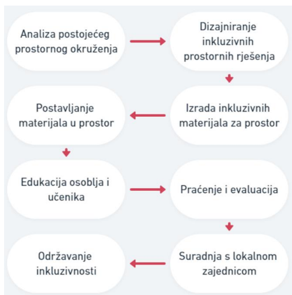
Slika 3. Akcijski plan pedagoga za stvaranje LGBT+ inkluzivnoga PMO odgojno-obrazovne ustanove