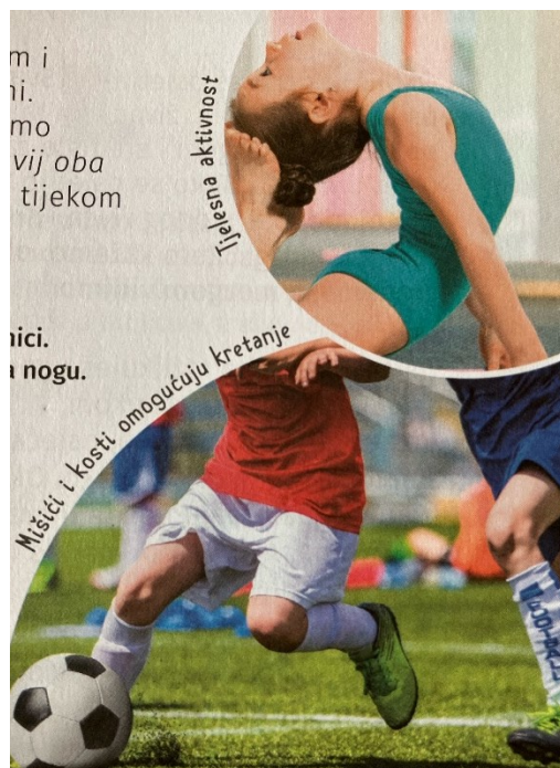
Slika 2. Tradicionalne rodne uloge (Priroda, društvo i ja 4, 2021: 91)