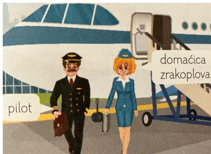
Slika 4. Tradicionalne rodne uloge (Priroda, društvo i ja 2, 2023: 115)

Osim čestih razlika u prikazima dječaka i djevojčica/učenika i učenica, u kojima su dječaci obično fizički aktivni, nestašni, teže se nose s učenjem, a djevojčice su vrijedne i dobre učenice, te prikaza rodne nejednakosti u djelatnostima ljudi, najviše je sadržaja rodne neravnopravnosti uočeno u tekstovima koji se bave roditeljstvom. Iako, zbog povijesti neravnopravnosti rodova tijekom koje je uvijek potlačena bila žena, rasprave o tom problemu najčešće sagledavaju žensku perspektivu, treba u obzir uzeti obje strane, jer kako se na učenicu negativno odražava usvajanje sadržaja u kojem je žensko prikazano kao pasivno, vezano za obiteljski dom, tako i na učenika negativno djeluju sadržaji u kojima se muško opisuje kao snažno, aktivno, ali emotivno hladno. Primjerice: