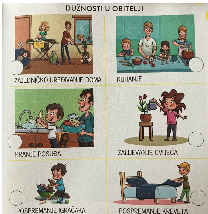
Slika 5. Rodna ravnopravnost u kućanskim poslovima (Istražujemo naš svijet 1, 2023: 53)

U kontrastu s prethodnim primjerima, postoje i prikazi rodne ravnopravnosti.