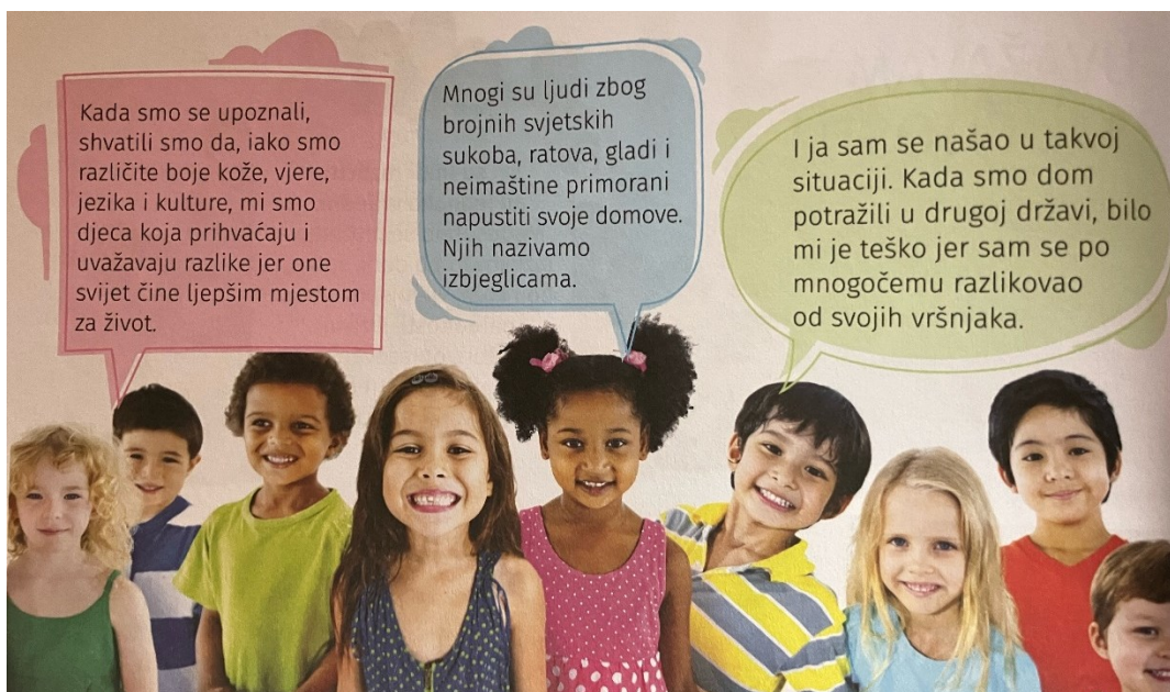
Slika 1. Reprezentacija Drugog (Priroda, društvo i ja 3, 2022: 64)

poruka „Različitosti treba poštivati i uvažavati!“ (Priroda, društvo i ja 3, 2022: 63) Vizualnim prikazom u istoj nastavnoj jedinici reprezentirane su različite rase i kulture, a u diskursu o toleranciji uključuje se i izbjeglištvo: