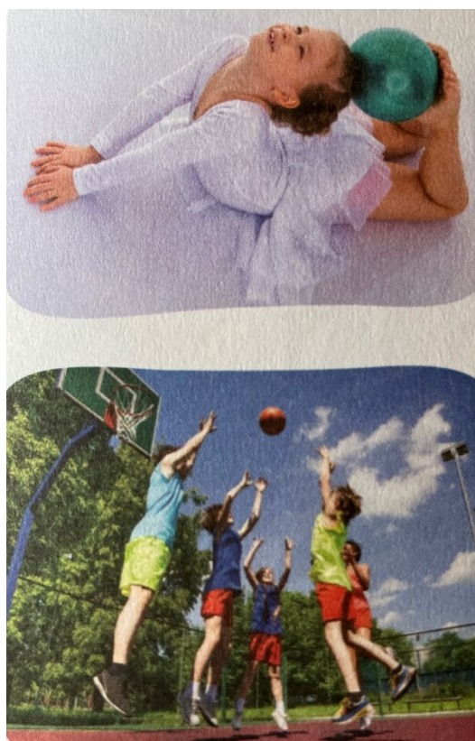
Slika 3. Tradicionalne rodne uloge (Priroda, društvo i ja 3, 2022: 69)