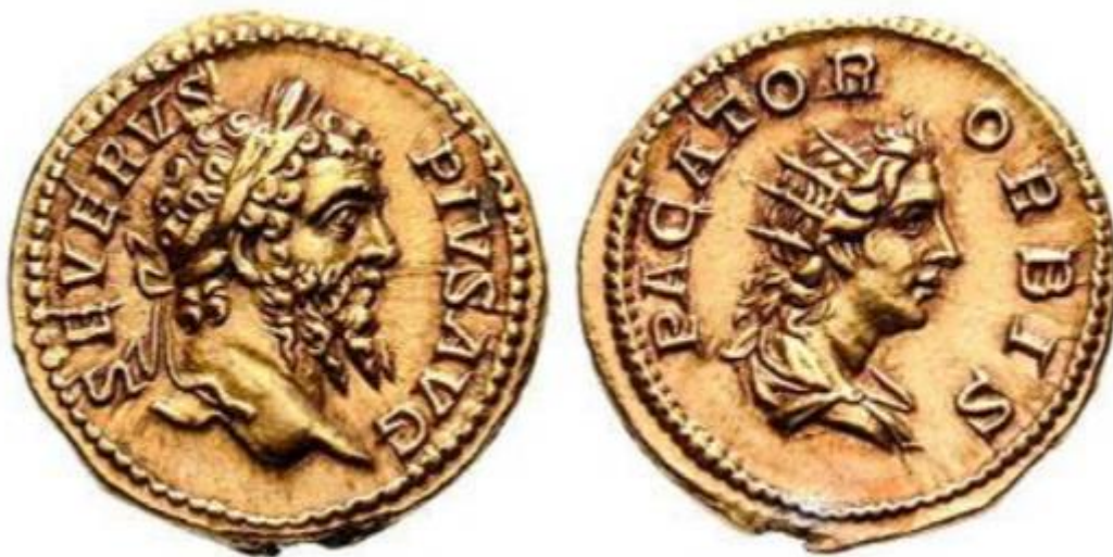
Sl. 5 – Aureus Septimija Severa (206./207.) car okrunjen lovorovim vijencem privezanim lemniscima (avers); Sol okrunjen zrakastom krunom bez lemniska (revers) (Steyn 2013., str. 79., sl. 25).

Zrakaste su krune nerijetko obogaćivale i kameje, geme te skulpture – često su kao atribut služile kod prikaza Oktavijana Augusta, ali i nekih drugih careva poput Trajana te Septimija Severa. Prema Marianne Bergmann, zrakaste se krune pojavljuju u dvjema verzijama – jedna je od njih rezervirana za prikaze careva, a druga za prikaze božanstvenog Sola (Steyn 2013: 56). Sol nikad nije prikazivan s aureolom bez zraka ili pak sa zrakastom krunom učvršćenom vrpčama ( lemnisci ) kao što je to bio slučaj kod prikaza careva (sl. 5) (Steyn 2014: 42). Vrpce su ukazivale na to da se radi o stvarnom objektu, a ne o božanstvenoj svjetlosti.