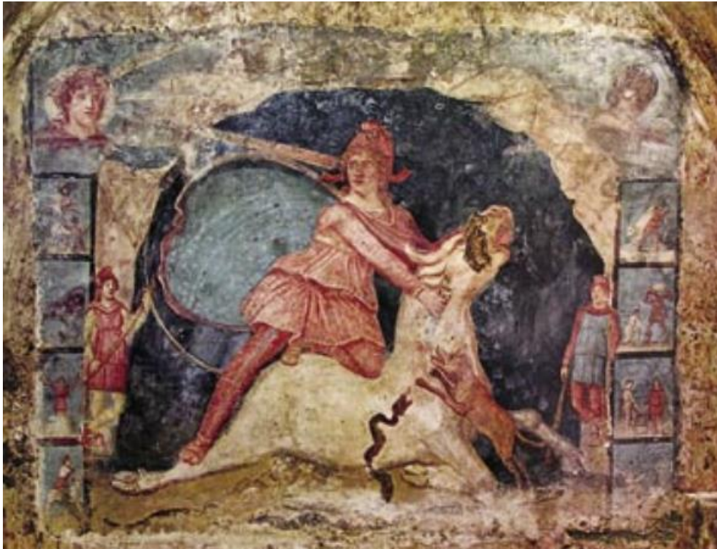
Sl. 4 – Tauroktonija, Mitreo di Marino, Marino kod Rima, Sol i Luna u gornjim uglovima (Miletić 2007., str. 135., sl. 4).

neba, vremena, željeza i zemljanih minerala (Miklobušec 2017: 80, Steyn 2013: 37). Prikazi Sola i Lune pojavljuju se na nekolicini brončanih votivnih trokuta otkrivenih u nekima od dolihenskih svetišta – oni nisu u središtu pozornosti i često su prikazivana samo njihova poprsja, a u ovom slučaju vjerojatno simboliziraju vječnost – aeternitas (Steyn 2013: 37).