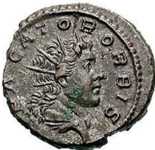
Sl. 10 – Postumov antoninijan, revers (296.) Poprsje/bista Sola sa zrakastom krunom; legenda “PACATOR ORBIS” (donosilac mira) (Steyn 2013., str. 81., sl. 30).

Vrlo su popularni bili i prikazi Sola u kvadrigrji (Halsberghe 1972: 30, Steyn 2013: 60, Usener 1905: 474). Takvi prikazi božanstava u ranijoj carskoj ikonografiji predstavljaju pravu rijetkost (Pérez Yarza 2018: 383). Ovog se puta čitava figura božanstva prikazuje sprijeda (sl. 11) ili u profilu (sl. 12; sl. 13; sl. 14), a pridodavani su joj i motivi zrakaste krune, ogrtača te biča (Steyn 2014: 41, Usener 1905: 474). Takva se vrsta prikaza podudara sa Solovom mitološkom ulogom svemirskog kočijaša koji donosi svjetlost i raspršava tamu (Steyn 2013: 60). Sol u kočiji simbolizira neprekidan ciklus izmjenjivanja dana i noći, a samim time i vječnost te nepobjedivost (Steyn 2014: 41). Potporu navedenom tumačenju predstavlja antoninijan iz perioda vladavine cara Proba na čijem je reversu prikazu Sola u kočiji pridodan natpis: “ SOLI INVICTO ” – nepokorivi Sol/nepokorivo sunce (npr. RIC V Probus 205) (Steyn 2013: 61). U kvadrigrji su prikazivani i Apolon, Jupiter te Helij (Pérez Yarza 2018: 393).