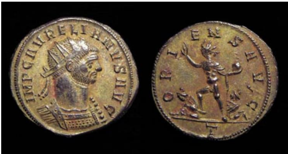
Sl. 2 – Aurelijan sa zrakastom/radijalnom krunom (avers), Sol Oriens (revers) – kovanica iz 274. godine (Miletić 2007., str. 133., sl. 2) (srodno primjerku RIC V Aurelian 61)

Kako bi učvrstio legitimitet svoje vladavine, Aurelijan je svoj lik i ranije asociirao s pojedinim božanstvima – u početku je prikazivan uz Herkula, Marsa i Jupitera (npr. RIC V Aurelian 57, RIC V Aurelian 1, RIC V Aurelian 49) (Usener 1905: 474). Tek je kasnije, kao što je i spomenuto, na kovanicama prikazivan u društvu favoriziranog mu Sola (sl. 2) (Paczkoskie 2021: 27). Takva praksa nije bila neuobičajena niti u ranijim, a niti u kasnijim razdobljima – Galijen je također povezivan sa Solom (npr. RIC V Gallienus 86), Heliogabal s Elagabalom iz Emese (npr. RIC IV Elagabalus 195d), a Konstantin s Kristom (Paczkoskie 2021: 27, Warmind 1993: 215). Kult Sola osjetno jača upravo u periodu koji je uslijedio nakon Galijenove vladavine (Pérez Yarza 2018: 380).