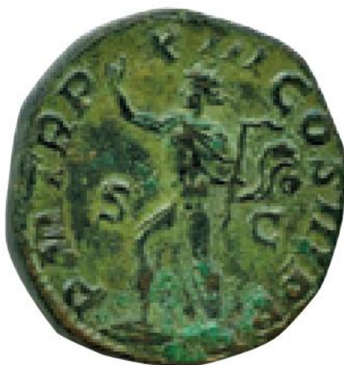
Sl. 16 – Sestercij Aleksandra Severa, revers (222./235) koračajući Sol, u lijevoj ruci drži bič, a desna je ispružena (Steyn 2014., str. 39., sl. 9).

Motivi globusa kojima su prikazi Sola također često nadopunjavani (sl. 17) vjerojatno simboliziraju kozmos – božanstva prikazivana s globusom smatrana su glavnim pokretačima svemira (Steyn 2014: 41). Globus predstavlja i carsku moć – takvoj tvrdnji u prilog idu scene u kojima božanstva poput Sola i Jupitera predaju globus carevima (Steyn 2013: 62, Usener 1905: 474). Kao primjer takvog prikaza moguće je izdvojiti Probov antoninijan – Jupiter koji drži munju caru predaje globus (sl. 18) (npr. RIC V Probus 928). Često pojavljivanje Sola u sličnim prikazima (sl. 19) svjedoči o značaju kojeg je to božanstvo uživalo tijekom trećeg stoljeća (Steyn 2014: 41). Pridodavanjem križa na vrh, spomenuti je motiv globusa tijekom perioda kasne antike prilagođen kršćanskoj ikonografiji (Steyn 2013: 62).