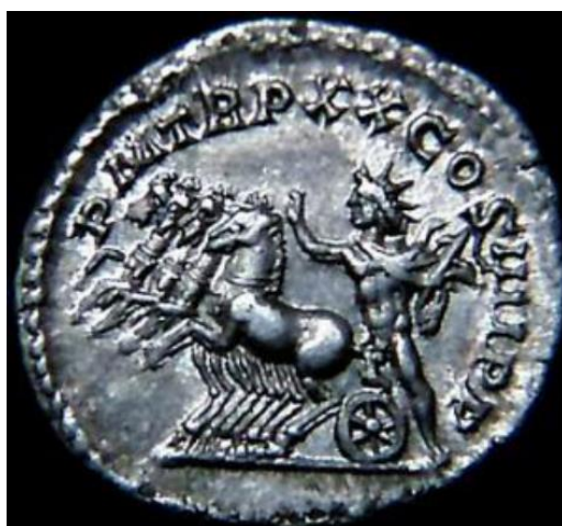
Sl. 12 – Karakalin antoninijan, revers (198./217.) Sol u kvadrigi, prikaz iz profila (Steyn 2013., str. 81., sl. 31).