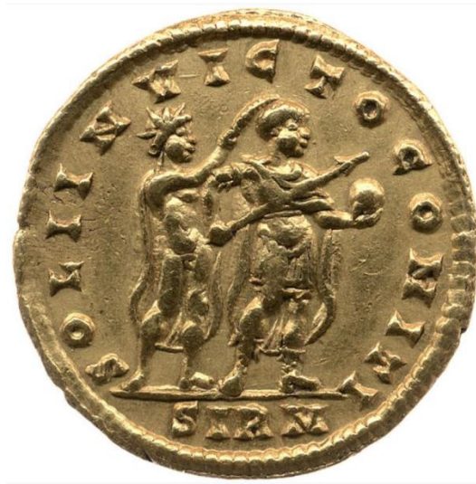
Sl. 21 – Solid Konstantina I., revers (321.) Sol kruni Konstantina I. (RIC VII Sirmium 21) - https://numismatics.org/ocre/id/ric.7.sir.21 )

Figure stojećeg ili koračajućeg Sola su sve do trećeg stoljeća bile netipičan način prikaza tog božanstva. Takvi su, prestižniji prikazi Sola postali srodni prikazima vrhovnog boga Jupitera (Steyn 2014: 42). Primjera radi, scene krunidbe cara koje nagoviještaju prijenos kozmičke moći dotad su bile rezervirane isključivo za potonje spomenuto božanstvo. Pojavljivanje Sola u scenama te vrste jasno i nedvosmisleno sugerira elevaciju tog solarnog kulta. Sol je u scenama te vrste prikazivan kako globus, odnosno moć predaje drugim božanstvima, primjerice Marsu ili Herkulu (Steyn 2013: 63). Njegovi su prikazi i stavom podsjećali na prikaze Jupitera s kojim je tijekom trećeg stoljeća, čini se, usklađeniji nego s Apolonom (Steyn 2013: 63, Steyn 2014: 42). Kao što je i spomenuto, opisana je vrsta prikaza