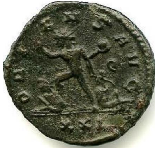
Sl. 20 – Aurelijanov antoninijan, revers (270./275.) Sol gaji dvojicu neprijatelja (Steyn 2014., str. 39., sl. 8).