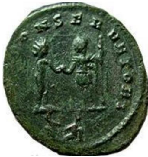
Sl. 19 – Aurelijanov antoninijan, revers (270./275.) Sol caru predaje globus (Steyn 2013., str. 84., sl. 40).

Sola je u stojećem ili koračajućem položaju bilo moguće prikazati u aktivnostima u kojima to nije bilo izvedivo kada su u pitanju portretni prikazi ili prikazi božanstva u kočiji. Božanstvo je najčešće prikazivano s podignutom desnom rukom i dlanom okrenutim prema naprijed – gesta je to koja simbolizira naredbu, nadmoć ili pak blagoslov. Prikazi takvog karaktera neodoljivo podsjećaju na neke od konjaničkih skulptura careva. Sol je u pojedinim scenama prikazivan i kako gazi svoje neprijatelje – takvi prikazi impliciraju konačnu božansku, odnosno carevu pobjedu (sl. 20) (Steyn 2014: 42). Za vrijeme Aurelijana populariziranu praksu preuzima Probus, a slične su scene zastupljene i tijekom četvrtog stoljeća (Usener 1905: 474). Također, zabilježene su i rijetke scene u kojima Sol okrunjuje cara čija vladavina na taj način dobiva dodatan legitimitet (sl. 21) (Steyn 2013: 62).