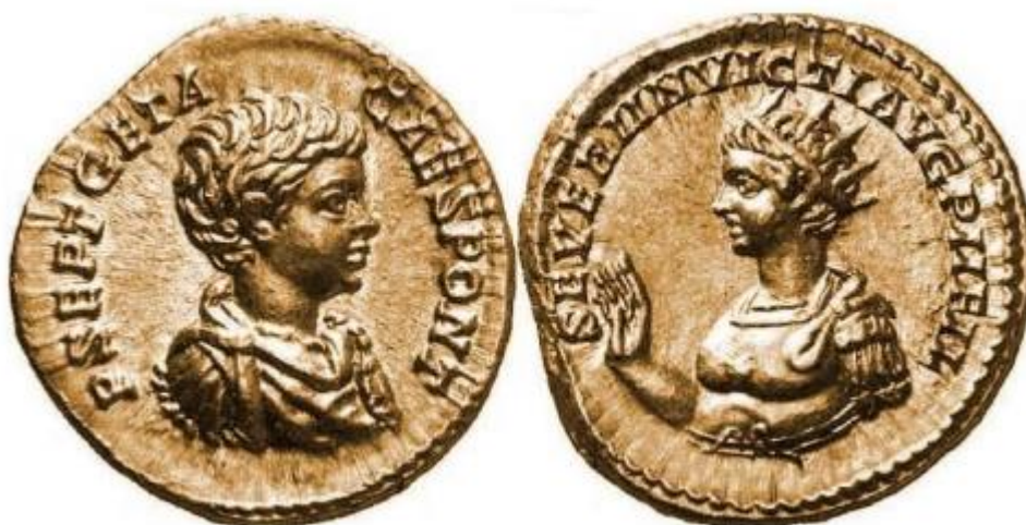
Sl. 8 – Getin aureus (209./211.) prikaz Gete (avers); prikaz Gete ili Karakale okrunjenog zrakastom krunom bez lemniska (revers) (Steyn 2013., str. 80., sl. 27).

Među nebrojenim kovanicama s motivima zrakaste krune, zabilježene su i poneke s unikatnim prikazima. Primjera radi, na reversu kovanice datirane na sam početak 3. st. (200. – 202. g.) prikazan je mladi Karakala (ili Geta) ispružene desne ruke sa zrakastom krunom bez vrpce (sl. 8) (npr. RIC IV Geta 21). S obzirom na jasno naznačenu gestikulaciju i činjenicu da je zrakasta kruna bez lemniska na većini drugih kovanica označavala isključivi atribut božanstvenog Sola, čini se da je u ovom slučaju Karakala (ili Geta) direktno izjednačen s tim božanstvom (Steyn 2013: 56).