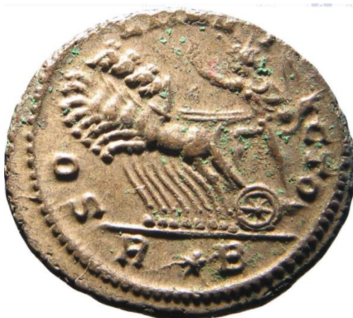
Sl. 13 – Probov antoninijan, revers (276./282.) Sol u kvadrigi, prikaz iz profila (Br. 294722 – Online coins of the Roman Empire - https://en.numista.com/catalogue/pieces294722.html )