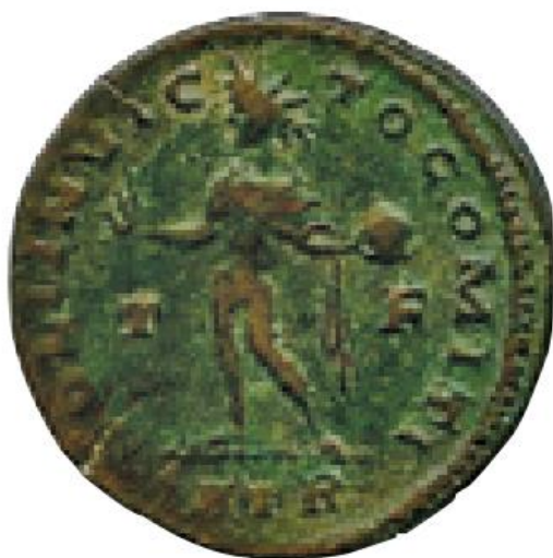
Sl. 17 – Sol s globusom u lijevoj ruci, revers (vladavina cara Konstantina I.) (Steyn 2014., str. 39., sl. 7).

Motivi globusa kojima su prikazi Sola također često nadopunjavani (sl. 17) vjerojatno simboliziraju kozmos – božanstva prikazivana s globusom smatrana su glavnim pokretačima svemira (Steyn 2014: 41). Globus predstavlja i carsku moć – takvoj tvrdnji u prilog idu scene u kojima božanstva poput Sola i Jupitera predaju globus carevima (Steyn 2013: 62, Usener 1905: 474). Kao primjer takvog prikaza moguće je izdvojiti Probov antoninijan – Jupiter koji drži munju caru predaje globus (sl. 18) (npr. RIC V Probus 928). Često pojavljivanje Sola u sličnim prikazima (sl. 19) svjedoči o značaju kojeg je to božanstvo uživalo tijekom trećeg stoljeća (Steyn 2014: 41). Pridodavanjem križa na vrh, spomenuti je motiv globusa tijekom perioda kasne antike prilagođen kršćanskoj ikonografiji (Steyn 2013: 62).