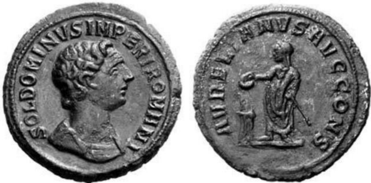
Sl. 9 – Aurelijanov antoninijan (274.) prikaz neokrunjenog Sola (avers); figuralni prikaz cara Aurelijana (revers) (Steyn 2013., str. 80., sl. 28).

Nadalje, kao iznimku je prikladno istaknuti i jedan primjerak antoninijana, odnosno aurelijana datiranog u razdoblje vladavine cara Aurelijana (sl. 9). Ta je kovanica posebna po tome što je car prikazan na reversu. S druge strane, na aversu je prikazan lik božanstvenog Sola bez krune – identifikaciju božanstva podupire natpis “SOL DOMINVS IMPERI ROMANI” (Sol gospodar rimske moći). Neobične ikonografske postavke ovog nadasve rijetkog primjerka kovanice možda simboliziraju vremensko poklapanje dvaju bitnih događaja – za vrijeme Aurelijanovog boravka u Palmiri i njegovih ratovanja s tamošnjom kraljicom Zenobijom, 8. studenog 272. godine, nastupila je pomrčina sunca (sunce je izgubilo svoje zrake). Navedena je prirodna pojava potencijalno protumačena kao božanstvena pomoć (Sol) zahvaljujući kojoj je car trijumfirao. Takve okolnosti podsjećaju na simboličku pozadinu Augustove pobjede kod Akcija (Steyn 2013: 57).