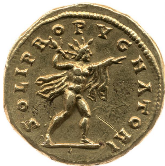
Sl. 25 – Elagabalov antoninijan, revers (218./222.) Prikaz Sola uz legendu SOLI PROPVGNATORI (Br. 276862 – Online coins of the Roman Empire (OCRE) - https://en.numista.com/catalogue/pieces276862.html )

kovanicama se datira u 254. godinu (Pérez Yarza 2018: 395). Car Heliogabal je prema Solu Elagabalu gajio snažne osobne preference (Hijmans 2009: 600).