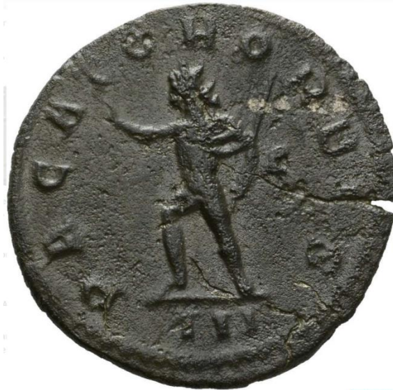
Sl. 24 – Florijanov antoninijan, revers (276.) Prikaz Sola uz legendu PACATOR ORBIS (Br. 291437 – Online coins of the Roman Empire (OCRE) - https://en.numista.com/catalogue/pieces288600.html )

donosilac mira – pacator orbis (sl. 24) (Manders 2012: 130, Pérez Yarza 2018: 384, Usener 1905: 475). Od 260. godine pa nadalje, Solu je pridodavan i epitet invictus (tipično za kovanice Galijena, Aurelijana, Kvintila i Proba) (Hijmans 2009: 600, Manders 2012: 130). Epitet invictus u službenu je carsku titulaturu uveden za vrijeme Komoda (Miletić 2007: 130). Prikazi Sola od tog trenutka postaju neizostavan dio carskih kovanica (Pérez Yarza 2018: 385). U njihovoj su evoluciji najznačajniju ulogu odigrali carevi Galijen, Aurelijan i Prob (Pérez Yarza 2018: 386). Spomenute titule posjeduju vojnu konotaciju i međusobno su povezane. Osim Solu, epitet donosioca mira pridodavan je i Jupiteru te carevima Aurelijanu, Probu i Numerijanu. S druge strane, s epitetom invictus povezivana su božanstva poput Jupitera, Herkula i Marsa. S obzirom na to da navedeni termini označavaju mir i nepobjedivost, moguće ih je povezati s prethodno opisanim legendama oriens Augusti i aeternitas Augusti/imperii , a samim time i sa simboličkim isticanjem početka novog zlatnog doba ( saeculum aureum ) (Manders 2012: 130).