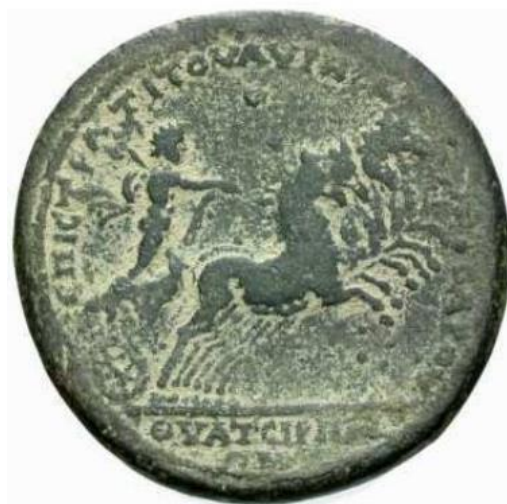
Sl. 14 – Apolon od Tijatire u kvadrigi, vladavina cara Komoda, revers kovanice (Pérez Yarza 2018., str. 394., sl. 6).

Sol je na kovanicama turbulentnog trećeg stoljeća najčešće prikazivan stojeći, odnosno koračajući (Pérez Yarza 2018: 382, Usener 1905: 470). Navedeni se tip prikaza pojavio tijekom perioda vladavine dinastije Severa (Steyn 2013: 61). Božanstvo je obično prikazivano nago ili ogrnuto ogrtačem, okrunjeno zrakastom krunom, ispružene desne ruke i s globusom ili pak bičem u lijevoj ruci (sestercij Aleksandra Severa – Sol drži bič; sl. 16) (Steyn 2014: 41, Usener 1905: 470). Kao jedan od najranijih primjera takve vrste prikaza valja izdvojiti primjerak denara koji potječe iz doba vladavine Septimija Severa – Sol je na reversu te kovanice prikazan licem okrenut ulijevo i okrunjen zrakastom krunom (sl. 15) (npr. RIC IV Septimius Severus 489). K tome, preko lijevog mu je ramena prebačen ogrtač, desna mu je ruka podignuta, a u lijevoj drži bič čiji je drugi kraj prebačen preko njegovog desnog ramena (Steyn 2013: 61).