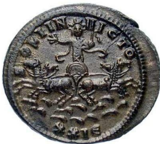
Sl. 11 – Probov antoninijan, revers (276./282.) Sol u kvadrigi, prikaz sprijeda; legenda “SOLI INVICTO” (nepokorivo sunce) (Steyn 2013., str. 81., sl. 32).