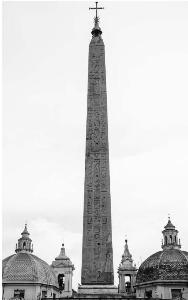
Sl. 3 – Setijev obelisk, Piazza del Popolo, Rim (Belloni 2015., str. 61., sl. 1)