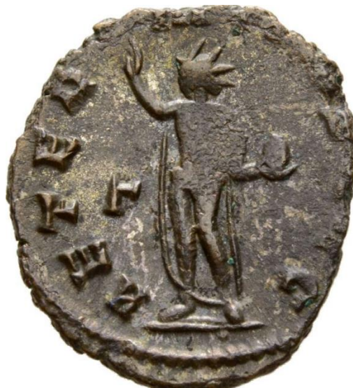
Sl. 23 – Galijenov antoninijan, revers (260./268.) Prikaz Sola uz legendu AETERNITAS AVGG (Br. 288600 – Online coins of the Roman Empire (OCRE) - https://en.numista.com/catalogue/pieces288600.html )

Pored navedenih, prikazi Sola u ponekim su slučajevima imali i druge funkcije. Za vrijeme vladavina Septimija Severa, Karakale, Aurelijana i Florijana božanstvo je isticano kao