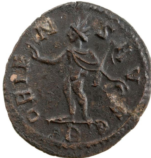
Sl. 22 – Galerijev antoninijan, revers (294./295.) Prikaz Sola uz legendu ORIENS AVGG (Br. 306758 – Online coins of the Roman Empire (OCRE) - https://en.numista.com/catalogue/pieces288600.html )