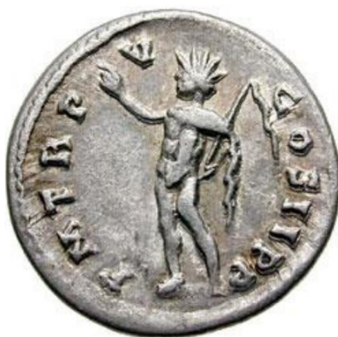
Sl. 15 – Denar Septimija Severa, revers (197.) koračajući Sol prikazan u profilu (Steyn 2013., str. 82., sl. 33).

Sol je na kovanicama turbulentnog trećeg stoljeća najčešće prikazivan stojeći, odnosno koračajući (Pérez Yarza 2018: 382, Usener 1905: 470). Navedeni se tip prikaza pojavio tijekom perioda vladavine dinastije Severa (Steyn 2013: 61). Božanstvo je obično prikazivano nago ili ogrnuto ogrtačem, okrunjeno zrakastom krunom, ispružene desne ruke i s globusom ili pak bičem u lijevoj ruci (sestercij Aleksandra Severa – Sol drži bič; sl. 16) (Steyn 2014: 41, Usener 1905: 470). Kao jedan od najranijih primjera takve vrste prikaza valja izdvojiti primjerak denara koji potječe iz doba vladavine Septimija Severa – Sol je na reversu te kovanice prikazan licem okrenut ulijevo i okrunjen zrakastom krunom (sl. 15) (npr. RIC IV Septimius Severus 489). K tome, preko lijevog mu je ramena prebačen ogrtač, desna mu je ruka podignuta, a u lijevoj drži bič čiji je drugi kraj prebačen preko njegovog desnog ramena (Steyn 2013: 61).