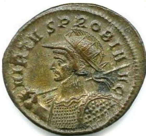
Sl. 7 – Probov antoninijan (276./282.) prikaz cara Proba okrunjenog zrakastom krunom i s kopljem te štitom (Steyn 2014., str. 42., sl. 14).

Među nebrojenim kovanicama s motivima zrakaste krune, zabilježene su i poneke s unikatnim prikazima. Primjera radi, na reversu kovanice datirane na sam početak 3. st. (200. – 202. g.) prikazan je mladi Karakala (ili Geta) ispružene desne ruke sa zrakastom krunom bez vrpce (sl. 8) (npr. RIC IV Geta 21). S obzirom na jasno naznačenu gestikulaciju i činjenicu da je zrakasta kruna bez lemniska na većini drugih kovanica označavala isključivi atribut božanstvenog Sola, čini se da je u ovom slučaju Karakala (ili Geta) direktno izjednačen s tim božanstvom (Steyn 2013: 56).