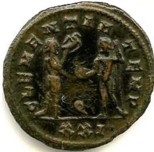
Sl. 18 – Probov antoninijan, revers (276./282.) Jupiter caru predaje globus (Steyn 2013., str. 83., sl. 36).