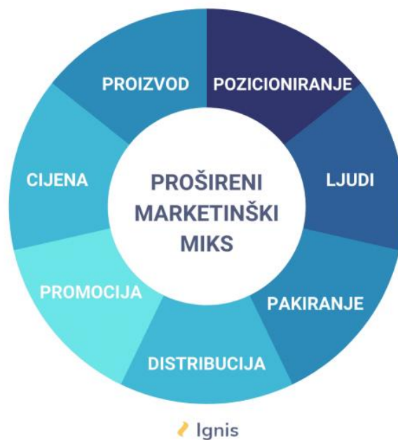
Slika 2. Marketing miks koncept 7P