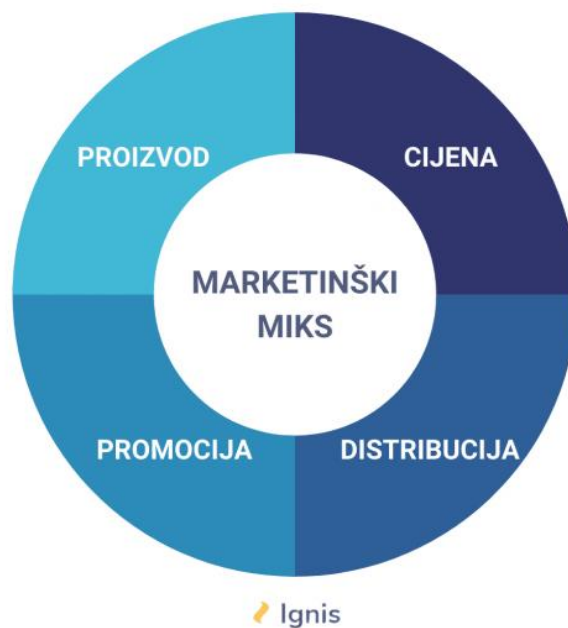
Slika 1. Prikaz modela marketing miksa 4P