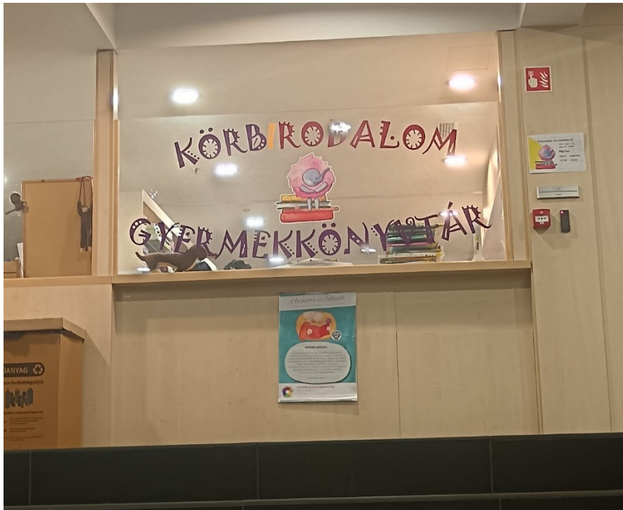
Fotografija 3. Pročelje Dječje knjižnice Körbirodalom (Privatna zbirka, 2024.)

Na ulazu na svaki kat nalazi se grafički tlocrt koji prikazuje pojedine sadržaje na tom katu, kao što se može vidjeti na fotografiji 4. koja prikazuje tlocrt četvrtog kata.