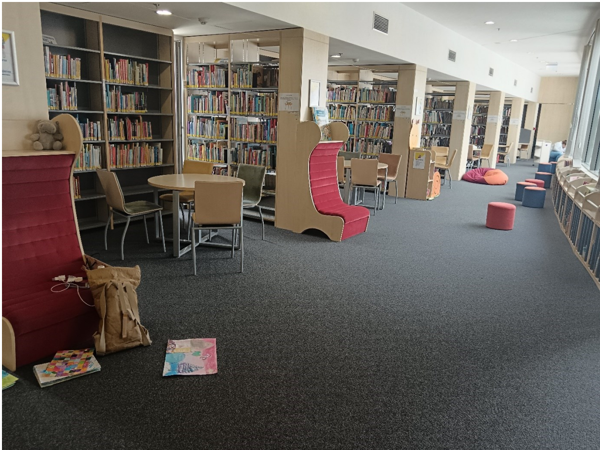
Fotografija 6. Prostor dječje knjižnice