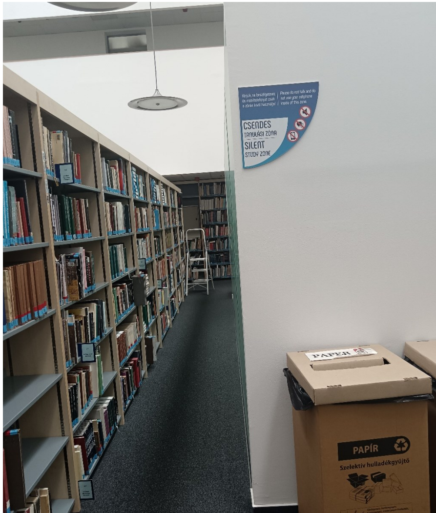
Fotografija 1. Zona tihog učenja