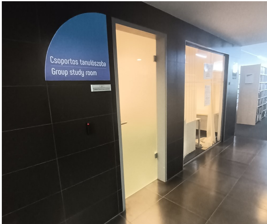
Fotografija 2. Prostorija za grupno učenje

Na trećem je katu stručna literatura iz ekonomije i statistike, prava, marketinga i menadžmenta – taj se dio Knjižnice naziva Benedek Ferenc Jogi és Közgazdaságtudományi Szakkönyvtár (Pravna i ekonomska stručna knjižnica Ferenc Benedek). Tu se također nalazi i Zbirka svjetske banke, Europski dokumentacijski centar i Terminološki dokumentacijski centar, a u rubnom dijelu Knjižnice nalaze se prostorije za tihi rad i proučavanje. Na četvrtom se katu nalaze Dječja knjižnica Körbirodalom, čije pročelje dočekuje posjetitelje još sa stuba – pročelje se može vidjeti na fotografiji 3. – i Glazbeni odjel, koji uključuje razne uređaje za reprodukciju, notne zapise, glazbene zapise te Glazbenu sobu Andora Tiszaija.