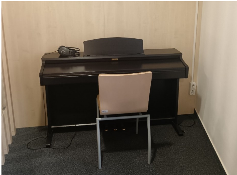
Fotografija 8. Digitalni pijanino za slobodno korištenje (Privatna zbirka, 2024.)

Svim upisanim korisnicima dostupan je na korištenje digitalni pijanino KAWAI KDP80. Svaki korisnik ima pravo besplatno koristiti klavir trideset minuta, a zatim se korištenje pijanina naplaćuje 1000 forinti po satu za odrasle, odnosno 500 forinti za studente ( Zongorahasználat, 2019 ). Pijanino se naravno ne može iznositi iz knjižnice, već se koristi u prostoru Glazbene zbirke, a vizualno je odvojen od ostatka zbirke trima drvenim pregradama, što se može vidjeti na fotografiji 8. Pijanino se može koristiti samo uz slušalice kako glazba ne bi smetala drugim korisnicima.