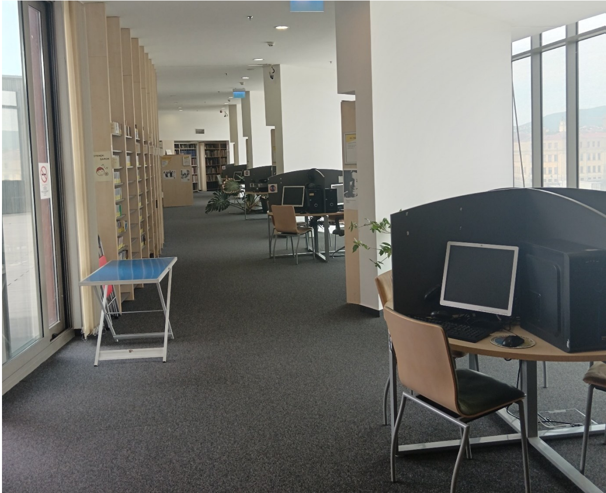
Fotografija 7. Slušaonica glazbenog fonda (Privatna zbirka, 2024.)

Osim zbirke u Centru znanja, u područnoj knjižnici Apáczai Csere János nalazi se fonoteka koja sadrži ploče, glazbene i književne CD-ove i audioknjige. Većina audiomaterijala dostupna je samo za korištenje u knjižnici, dok se audioknjige i dječje pjesme mogu posuditi.