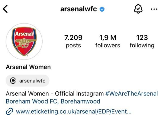
Slika 5 Službeni profil ženske momčadi nogometnog kluba Arsenal na društvenoj mreži Instagram (Arsenal WFC, 2024).