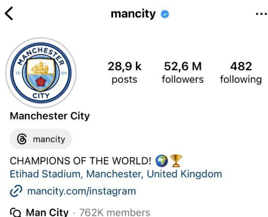
Slika 3 Službeni profil nogometnog kluba Manchester City na društvenoj mreži Instagram (Manchester City, 2024).