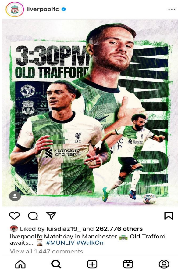
Slika 1 Objava nogometnog kluba Liverpool na društvenoj mreži Instagram uoči utakmice protiv nogometnog kluba Manchester United (Liverpool FC, 2024).

Ovo je samo jedan od primjera korištenja mogućnosti društvenih mreža kako bi se promovirao neki sportski događaj, u ovom slučaju nogometna utakmica. Povezanost društvenih mreža i sporta pokazuje i primjer Europskog nogometnog prvenstva 2020. godine, na kojemu je jedan od službenih sponzora bila društvena mreža TikTok. Tijekom prvenstva navijači su se na TikTok-u mogli uključiti u kampanju „Where fans play“ u kojoj su se objavljivale slike i videozapisi navijača kako navijaju za svoju državu, rade nogometne trikove, poznate proslave nogometaša i brojne druge. Navedena kampanja povezala je navijače iz raznih zemalja, ali i zainteresirala one koji nisu znali za to prvenstvo. Tijekom trajanja utakmica objavljivan je razni sadržaj koji će potaknuti interakciju s navijačima, primjerice videozapisi pogodaka, slike navijača i igrača sa stadiona, reakcije trenera i mnogo više. U promociju navedenog prvenstva putem TikTok-a bili su uključeni i umirovljeni nogometaši, primjerice bivši engleski reprezentativac i Arsenalov igrač Ashley Cole došao je pred vrata navijača kako bi mu darovao dvije ulaznice za finale prvenstva. Događaj je