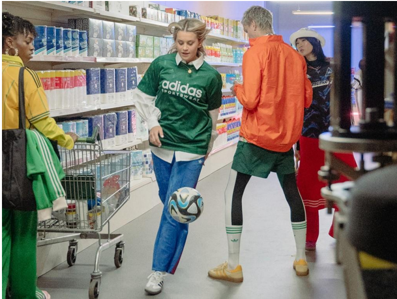
Slika 8 Nogometašica Alessia Russo u kratkom filmu u sklopu Adidasove kampanje „ Play Until They Can't Look Away “. (Adidas, 2023).

milijunsku praćenost na njihovim društvenim mrežama te ovakve kampanje približavaju ženski nogomet puno široj publici te ga čine popularnijim. Sami naslov kampanje želi poslati poruku da je ženski nogomet prisutan te da će ga se igrati unatoč negativnim komentarima. Sljedeća slika prikazuje dio filma koji je objavljen u sklopu kampanje „ Play Until They Can't Look Away “.