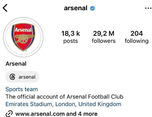
Slika 4 Službeni profil muške momčadi nogometnog kluba Arsenal na društvenoj mreži Instagram (Arsenal, 2024).