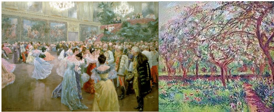
Slika 6. Court Ball at the Hofburg Slika 7. Apple Trees in Bloom at Giverny

Opcija koju možemo iskoristiti u muzejima su virtualne priče. Tokom gledanja filmova i serija ili čitanja knjiga, jeste li ikad razmišljali koliko bi zanimljivo bilo da možete i sami biti u toj priči, da se nalazite u toj okolini, da ste okruženi tim likovima i da proživite njihova iskustva? Upravo to možemo ostvariti sa virtualnim pričama, imamo mogućnost stvaranja točno tog iskustva, ako ne i boljeg. Kombinacijom digitalnog pripovijedanja i virtualne stvarnosti možemo se zateći u raznim okolinama, primjerice na baroknom balu Wilhelm Gausea koji vidimo na slici 6., ili u poznatim vrtovima koje je slikao Claude Monet na slici 7. Dakle pomoću naočala doživjeli bi potpuni imerzivni svijet, dok bi preko zvučnika svirala glazba i pričale se priče o tom dobu. Zanimljivo je što pomoću virtualne stvarnosti imamo priliku preći preko barijere vremena i prostora, više nije važno u kojem dobu se nalazimo, ni na kojem mjestu se nalazimo, sve što nam je potrebno je par naočala kako bismo prisustvovali raznim vremenima i udaljenim mjestima.