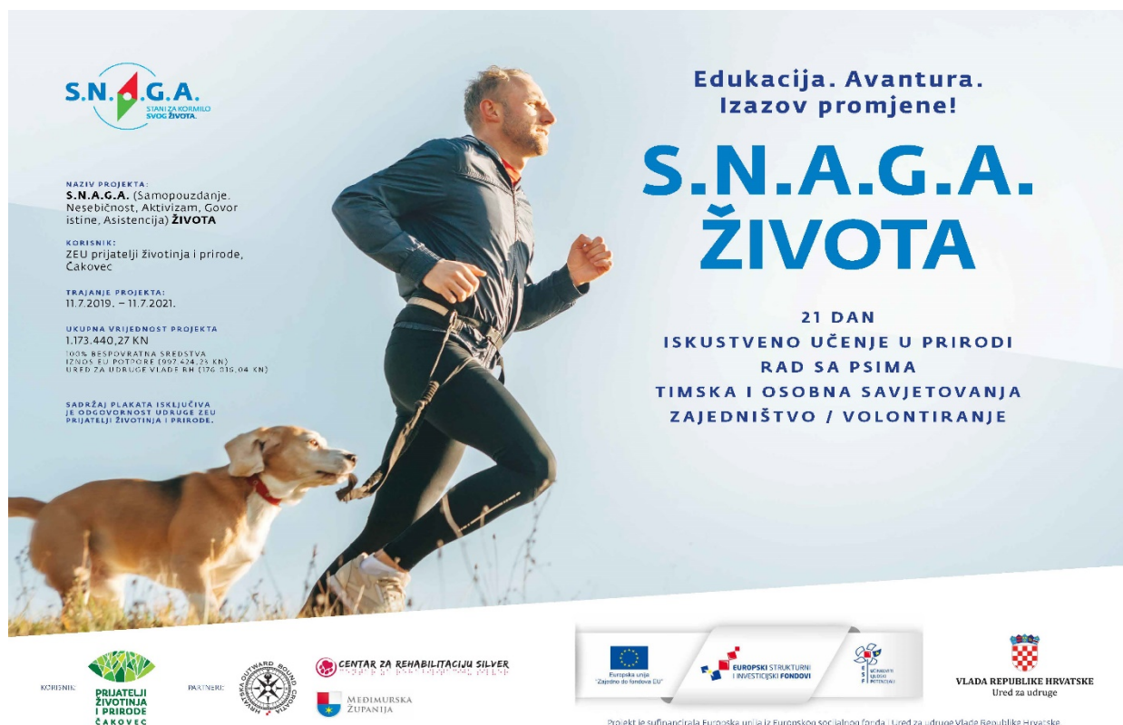
Slika 1: Projektni plakat (1) – S.N.A.G.A. života 22