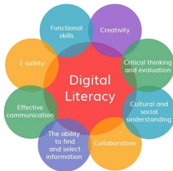
Slika 1.: Sastavnice digitalne pismenosti

Pismenost je oduvijek jedna od glavnih osobina suvremenog društva. Ona je temelj za sva tehnološka i sociološka postignuća čovjeka modernog doba. Mijenjala se i razvijala kroz povijest, prateći promjene i razvoj društva. Život u ubrzanom tehnološkom razvoju 21. stoljeća, okruženost različitim medijima i izvorima informacija utjecali su na pojam pismenosti. Taj je pojam nekada uključivao vještine kao što su čitanje, pisanje i aritmetika, dok se primjenom tehnologije širi i na druga okruženja (Katić, 2022). Ovisno o mediju, govori se i o različitim vrstama pismenosti. „Digitalna, internetska ili web pismenost odnosi se na razumijevanje hiperteksta, multimedijalnih tekstova, oznaka (eng. tags ) odnosno poznavanje načina na koji funkcionira Internet te vještine korištenja digitalne građe“ (Stropnik, 2013).